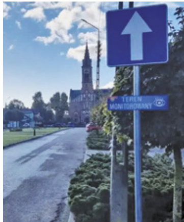
Nowe punkty monitoringu powstaną w siedmiu miejscowościach

W ramach inwestycji przewidziano również montaż kamer wyposażonych w system automatycznego rozpoznawania tablic rejestracyjnych (ANPR). Takie rozwiązanie ma wspierać działania związane z poprawą bezpieczeństwa oraz pomocą służbom w