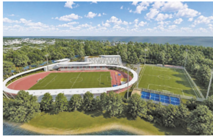
Wstępna koncepcja przewiduje m.in. modernizację boiska wraz z oświetleniem oraz stworzenie rozbudowanego zaplecza dla sportowców