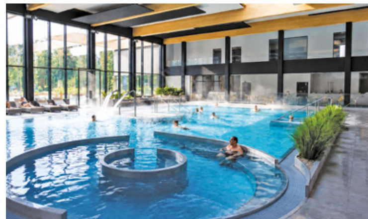
WIZUALIZACJA: UM OTWOCK

Wymagania zależą od stanowiska. W przypadku ratowników konieczne są aktualne uprawnienia ratownika wodnego oraz dokument potwierdzający spełnienie dodatkowych wymogów zgodnie z przepisami o bezpieczeństwie osób przebywających na obszarach wodnych. Instruktorzy pływania muszą mieć uprawnienia instruktora pływania lub inne kwalifikacje wymagane do prowadzenia zajęć. Od kandydatów do pracy w gastronomii wymagane są m.in. aktualne badania sanitarno-epidemiologiczne, a od kierowców – prawo jazdy i doświadczenie w prowadzeniu pojazdów. Przy stanowiskach administracyjnych i specjalistycznych pojawiają się z kolei wymagania związane z doświadczeniem, znajomością przepisów, obsługą systemów księgowych, IT albo marketingiem.