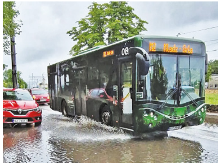
Przebudowywane jest skrzyżowanie ul. Poniatowskiego i ul. Pułaskiego przy parku miejskim

O tym dowiadujemy się od Urzędu Miasta Otwock, bo budowa ronda będzie miała wpływ na kursowanie autobusów miejskich.