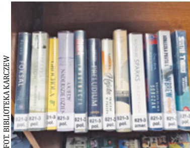
Nie podano terminu ponownego otwarcia placówki

Filia Biblioteczna „Ługi” w Karczewie została zalana i do odwołania pozostaje nieczynna. Trwają prace porządkowe oraz zabezpieczanie księgozbioru.