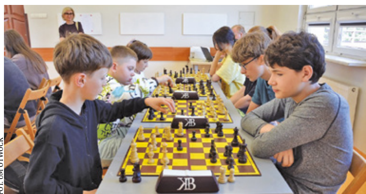
Młodzi zawodnicy udowodnili, że królewska gra ma się w Otwocku bardzo dobrze

– Trzy najlepsze placówki otrzymały puchary oraz medale dla zawodników. Każda szkoła, która brała udział w zawodach otrzymała pamiątkowy dyplom – podkreśla otwocki ratusz. I