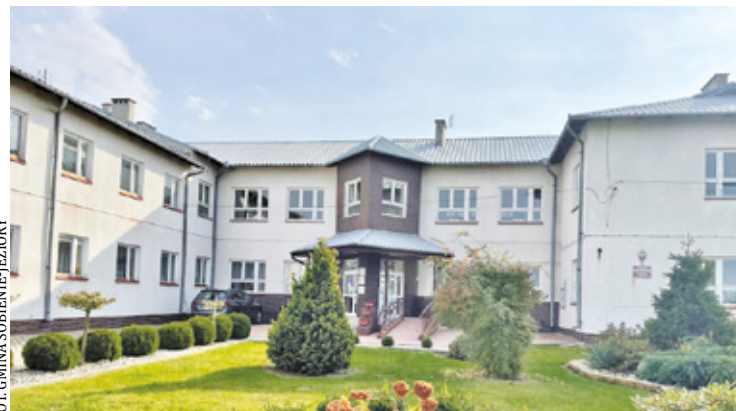
Zaplanowano modernizację systemu grzewczego oraz docieplenie ścian zewnętrznych, stropu pod poddaszem i podłóg

Zakres prac obejmie kompleksową poprawę efektywności energetycznej szkoły. Zaplanowano modernizację systemu grzewczego oraz docieplenie ścian zewnętrznych, stropu pod poddaszem i podłóg.