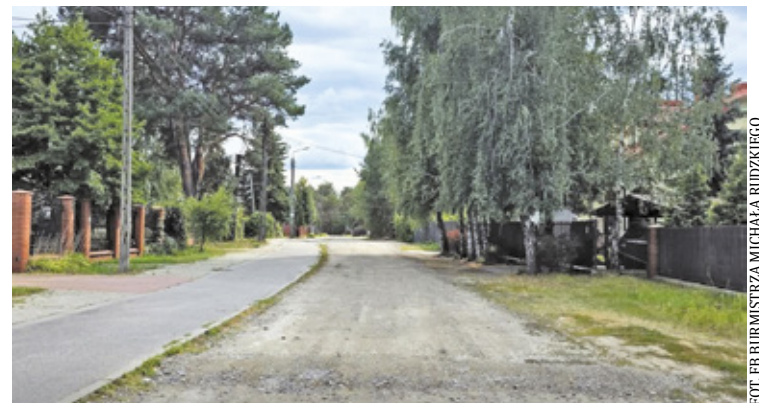
Dofinansowanie ma pomóc w realizacji inwestycji drogowych i przyspieszyć modernizację lokalnej infrastruktury

Jak wynika z informacji przekazanych przez burmistrza, od początku roku gmina prowadzi intensywne działania, związane z przygotowaniem i realizacją kolejnych inwestycji drogowych. W ostatnich miesiącach zakoń-