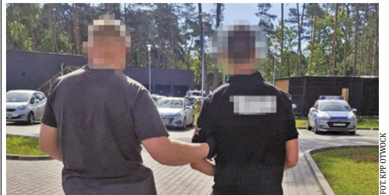
Mężczyzna trafił do aresztu na trzy miesiące

Na wskazane miejsce przyjechali funkcjonariusze z Komisariatu Kolejowego Policji w Warszawie, którzy zatrzymali podejrzanego mężczyznę. Sprawca został przewieziony do komendy w Otwocku. Tam dalsze czynności przejęli otwoccy śledczy. Mężczyzna usłyszał dwa zarzuty niszczenia mienia o charakterze chuligańskim. Przyznał