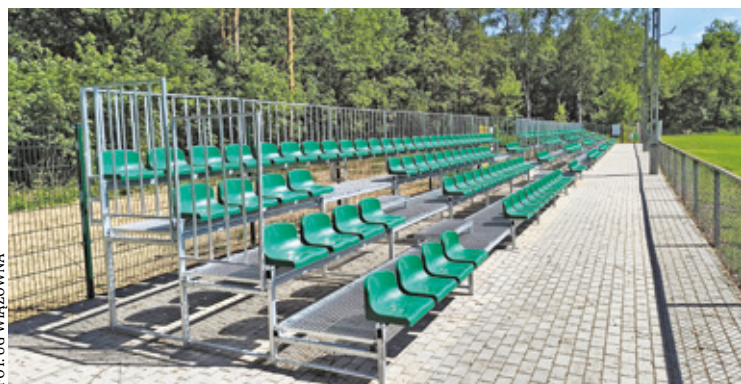
Po modernizacji przy boisku jest 303 miejsc siedzących

Z nowych trybun będą korzystał kibice Advitu i drużyn gości