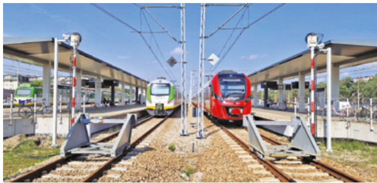
Część pociągów pojedzie według zmienionego rozkładu

– Część pociągów nadal nie zatrzyma się na PKP Michalin i PKP Otwock Świder. Zostanie uruchomiona uzupełniająca komunikacja autobusowa. Wybrane pociągi rozpoczną i zakończą kurs na stacji w Wawrze – wyjaśnia przewoźnik.