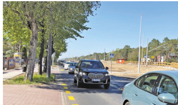
Ul. Pilsudskiego na wysokości Michalina

nie są przeciwko kolei ani samej modernizacji. Ich sprzeciw budziła przede wszystkim skala wycinki drzew, brak jasnego planu nowych nasadzeń oraz obawa, że po zakończeniu inwestycji wzdłuż torów zostaną głównie beton, stal i wysokie ekrany akustyczne. Dla-