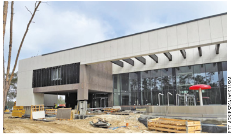
Obiekt będzie nosił imię Jerzego Iwanowa-Szajnowicza. Przed basenem ma stanąć pomnik patrona

Teraz miasto chce określić zasady zagospodarowania zielonych terenów przy kompleksie basenów, zarówno