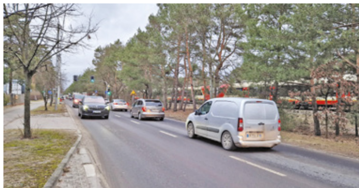
Tak było przed modernizacją linii kolejowej

W Józefowie temat ekranów wraca od dawna. Mieszkańcy i władze miasta zastanawiają się, co zrobić, żeby kilkukilometrowa ściana przy torach nie wyglądała jak plastikowy mur i żeby miasto nie przypominało scenarii z popularnego serialu „Gra o tron”. Chodzi nie tylko o ochronę przed hałasem, ale też o wygląd całej okolicy. Miasto od dawna walczy o to, aby ekrany zostały obsadzone roślinnością, m.in. bluszczem i innymi zimozielonymi pnączami. Z czasem miałyby więc bardziej przypominać zieloną ścianę niż surową konstrukcję techniczną. W ostatnim czasie pojawiły się też inne pomysły. Część mieszkańców Józefowa proponuje drewniane elementy, które mogłyby nawiązywać do stylu świdermajer i „ozdabiać” ekrany.