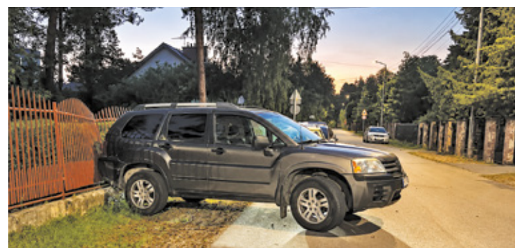
W ostatnich dniach służby interweniowały przy kilku zdarzeniach drogowych w powiecie otwockim

W e wtorek (26 maja) około 17:00 na lokalnej drodze w Glinie w gm. Karczew doszło do zderzenia motocykla marki Honda z samochodem osobowym marki Hyundai.