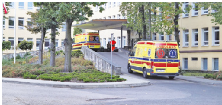
W szpitalu powiatowym w Otwocku powstanie miejsce dziennej opieki długoterminowej

Za te pieniądze będzie przebudowane pierwsze piętro budynku szpitala. Pomieszczenia mają zostać dostosowane do prowadzenia dziennej opieki długoterminowej. W ramach inwestycji zaplanowano prace budowlane i instalacyjne oraz usunięcie barier archi-