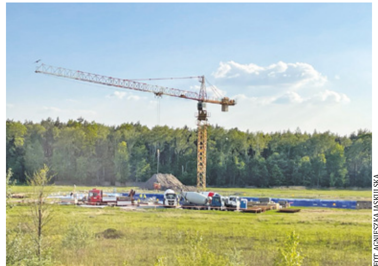
Na terenie dawnego lotniska w Góraszce trwają prace przy infrastrukturze technicznej pod przyszły kompleks

Według projektu nowoczesny obiekt w Góraszce jest otoczony zielenią i otwartą przestrzenią, gdzie harmonijnie łączą się funkcje handlowe,