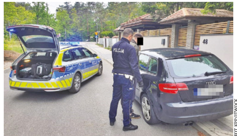
Audi zostało odholowane na policyjny parking, a kierowca trafił do policyjnej celi

Policjanci zatrzymali mężczyznę i szybko usłyszeli dość zaskakujące tłumaczenie. – 29-letni kierowca przeko-