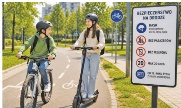
Nowelizacja ma poprawić bezpieczeństwo najmłodszych użytkowników jednośladów i hulajnog elektrycznych

Za dopilnowanie obowiązku jazdy w kasku odpowiadają rodzice i opiekunowie. To oni mogą zostać ukarani grzywną, jeśli pozwolą dziecku jechać bez wymaganego zabezpieczenia. Kask