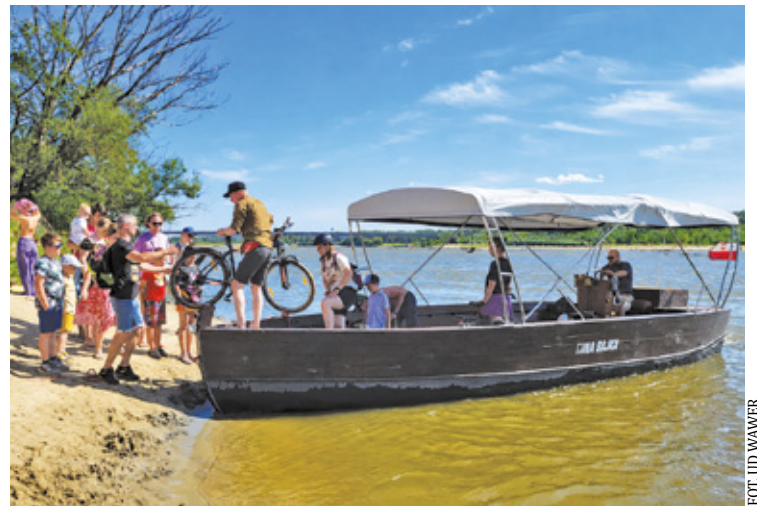
Kilka minut na wodzie wystarczy, by zobaczyć Warszawę z zupełnie innej perspektywy

Organizatorzy przypominają, że strefa cumowania promu nie jest miejscem do kąpeli. Obowiązuje tam bezwzględny zakaz wchodzenia do wody. Nie wolno się kąpać, brodzić, bawić w wodzie ani podpływać kajakiem czy na SUP-ie. Zakaz obowiązuje przez cały