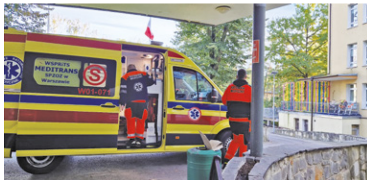
Powiatowe Centrum Zdrowia w Otwocku szuka pracowników na kolejne stanowiska. Najwięcej ofert dotyczy Bloku Operacyjnego i poradni specjalistycznych

– Dokumenty można składać osobiście w Dziale Kadr Powiatowego Centrum Zdrowia przy ul. Batorego 44 w Otwocku, od poniedziałku do piątku w godz. 07:00-15:00 lub przesyłać za pośrednictwem poczty e-mail na adres: kadry@pcz-otwoc.pl – informuje PCZ.