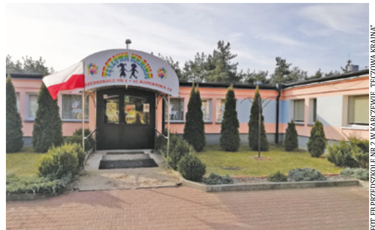
Nowe przedszkole powstanie obok żłobka, tworząc spójny kompleks edukacyjny

– To element naszej polityki bezpieczeństwa i odpowiedzialnego przygotowania Gminy Karczew na ewentual-