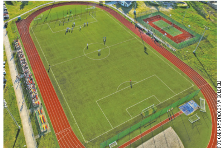
FOT. GMINNY STADION W KOŁBIELI

Samorząd poinformował, że oferty w przetargu można składać do 2 czer-