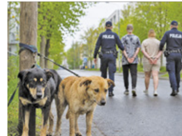
ZDJEŃCIE POGŁĄDOWE

Na szczęście ktoś przechodził w okolicach szkoły, zauważył psy i powia-