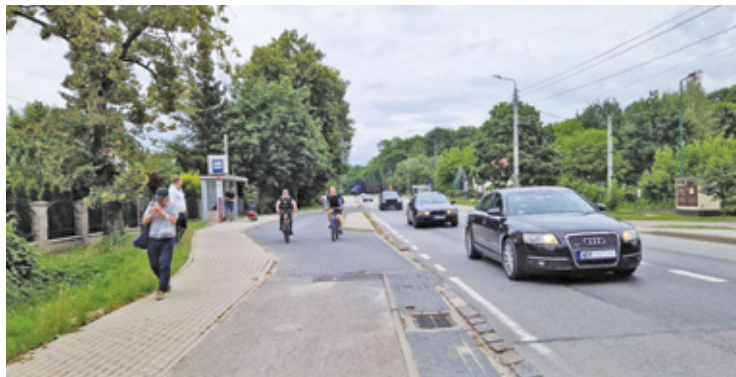
Największy zakres prac będzie dotyczył odcinka drogi wojewódzkiej od ul. Klonowej, przez ul. Boryszewską i ul. Lubelską, aż do ronda przy hotelu

Już teraz ciężarówki nie mogą wjeżdżać na jedną z lokalnych dróg w centralnej części Wiązowny.