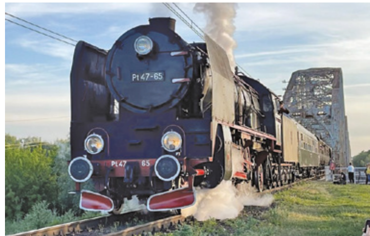
Przejazd pociągu retro przez most na Urzeczcu w Górze Kalwarii miał charakter pożegnalny

Pt4765 to parowóz pośpiesznej polskiej konstrukcji z 1949 roku, zbudowany w zakładach Fablok w Chrzanowie. Lokomotywy serii Pt47