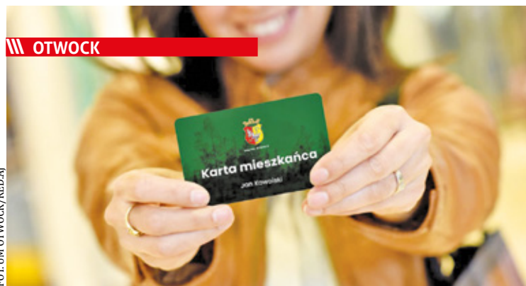
Nowa karta ma być miejskim bonusem dla otwozczan

||| Kołbiel - Jedzenie czeka na potrzebujących s. 7