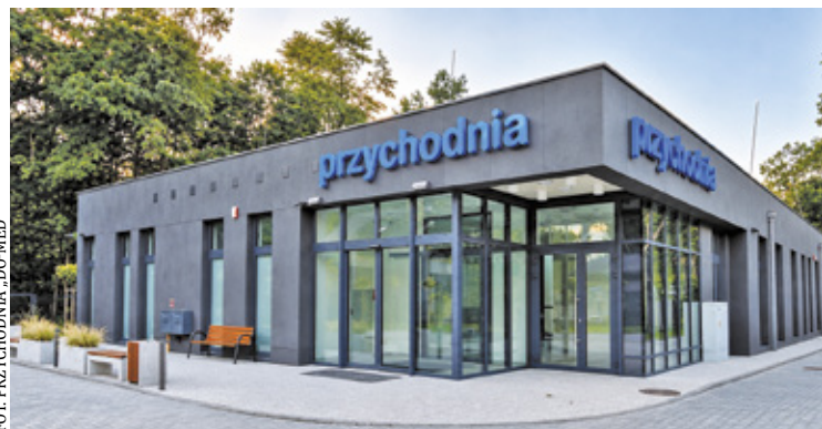
Nowa przychodnia zdrowia i apteka znajduje się przy ul. Ogrodowej i gminnym targowisku

Nowy ośrodek jest dostosowany do potrzeb osób z niepełnosprawnościami oraz rodzin z dziećmi. Budynek ma ok. 630 m 2 i został podzielony na trzy strefy: dla dorosłych, dzieci chorych oraz dzieci zdrowych. W części dla dorosłych są m.in. dwa gabinety lekarza rodzinnego, gabinet zabiegowy, stomatologiczny, ginekologiczny, gabinet pie-