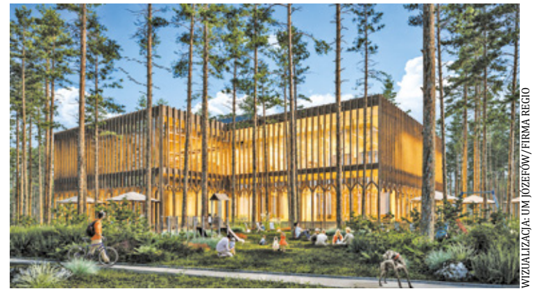
Tak ma wyglądać Willa Kultura w Józefowie

– Willa Kultura ma być miejscem dla mieszkańców w różnym wieku: dzieci, młodzieży, rodzin i seniorów. Ma też służyć lokalnym organizacjom oraz osobom, które będą chciały się spotkać, wziąć udział w wydarzeniach albo skorzystać z oferty biblioteki. Nowy budynek pozwoli nam rozwinąć działalność i poprawić jakość usług w sposób, na który obecna siedziba nie pozwala – tłumaczy UM Józefów.