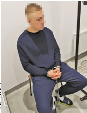
Dwaj podejrzani usłyszeli zarzuty i decyzją sądu trafili do aresztu

– Do dramatycznych wydarzeń doszło podczas spotkania towarzyskiego, na którym spożywano alkohol. Sytuacja szybko wymknęła się spod kontroli i zakończyła brutalnym atakiem – mó-