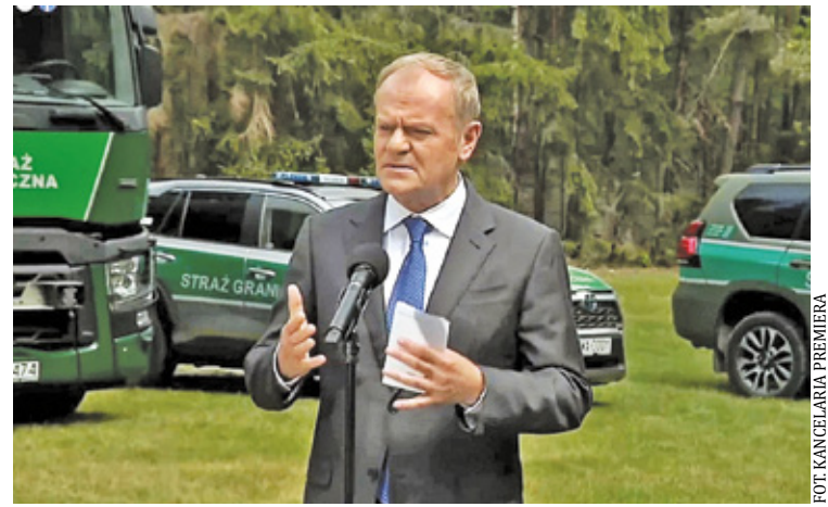
Wizyta w Otwocku była okazją do podsumowania działań służb odpowiedzialnych za bezpieczeństwo granic

Premier zaznaczył, że wynik ten nie oznacza spadku presji migracyjnej. Według niego skuteczność ochrony