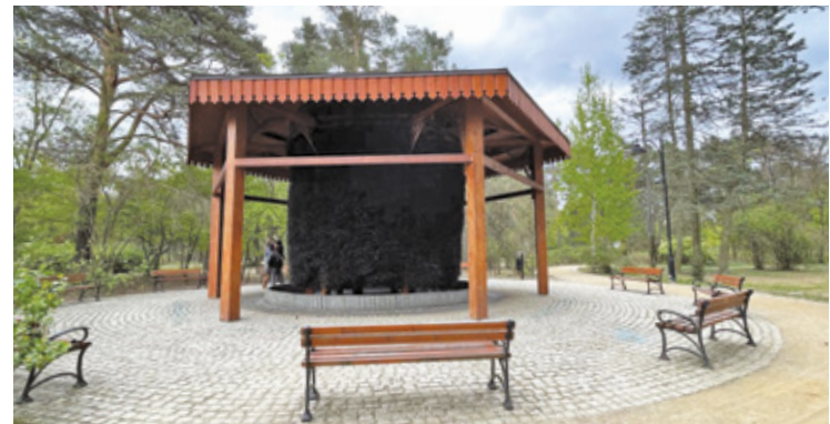
Mieszkańcy mogą korzystać z tężni codziennie w godzinach 10:00 – 20:00, poza deszczowymi dniami

Wokół tężni tworzy się charakterystyczny mikroklimat, często porównywany do tego znad morza. Powstaje dzięki rozpylanej solance, która zawiera m.in. jod, brom i magnez. Przebywanie w pobliżu tężni może wspierać układ