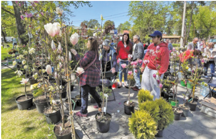
Kiermasz „Ukwiecamy nasze miasto” przyciągnął miłośników zieleni

Na stoiskach można było kupić m.in. kwiaty, byliny, krzewy i drzewka. Była też okazja, żeby porozmawiać z wystawcami, podpytać o pielęgnację roślin i wymienić się ogrodniczymi doświadczeniami. Dużym zainteresowaniem cieszyły się darmowe sadzonki przygotowane przez miasto. Józefowski ratusz rozdał mieszkańcom 3000 sa-