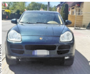
Mężczyzna może stracić nie tylko prawo jazdy, ale także samochód

Są błędy, za które płaci się znacznie wyższą cenę niż tylko ta, zapisana w taryfikatorze mandatów.