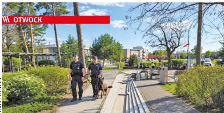
Mundurowi będą zwracać uwagę m.in. na alkohol, papierosy i e-papierosy wśród nieletnich