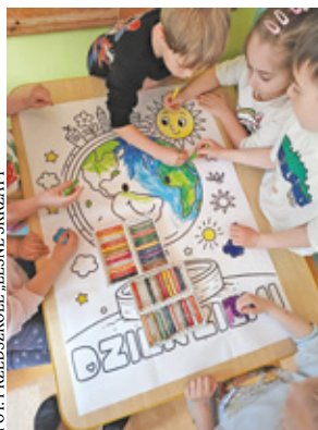
FOT. PRZEDSZKOLE „LEŚNE SKRZATY”

Dzięki udziałowi w projekcie przedszkole otrzymało ploter na własny użytek oraz dwa laptopy. Kadra pedagogiczna wykorzysta sprzęt do tworzenia nowoczesnych materiałów dydaktycznych i uatrakcyjniania zajęć dla dzieci.