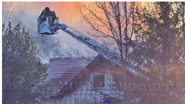
Rodzina z dwójką małych dzieci straciła dach nad głową

N a miejsce szybko przyjechali strażacy, policja, pogotowie ratunkowe i pogotowie energetyczne. W akcji brały udział jednostki: JRG Otwock, WSP Celestynów oraz OSP Otwock Wielki, OSP Regut, OSP Karczew, OSP