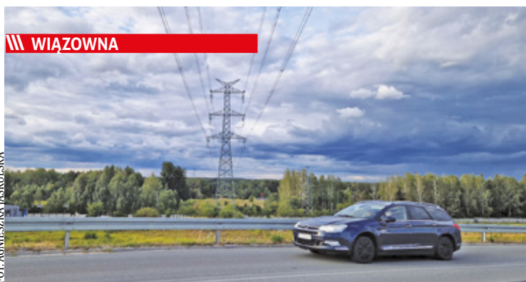
Planowana inwestycja miałyby powstać przy trasie S17