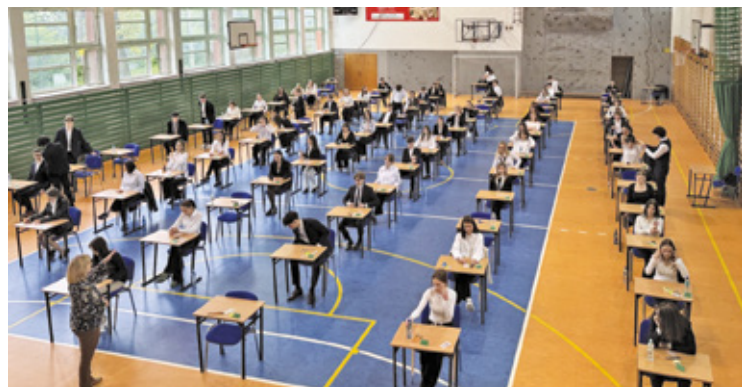
Matury w LO im. Słowackiego w Otwocku

Z kolei drugi temat dotyczył tego, kiedy człowiek zaczyna przejmować się opinią innych. Maturzyści mogli pisać o sytuacjach, w których ważne stają się uznanie, akceptacja, ocena otoczenia albo lęk przed odrzuceniem. Na liczbę punktów wpływa jednak nie tylko treść wypracowania, lecz także język, styl, interpunkcja i ortografia. Zdaniem nauczycieli można się spodziewać, że w tym roku zdawalność matury z języka polskiego będzie wysoka.