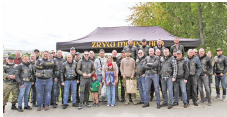
Otwocka edycja akcji Motoserce odbyła się w centrum miasta

Na ul. Andriollego, przy zielonym placu, stanął specjalny ambulans, w którym można było oddać krew. Do