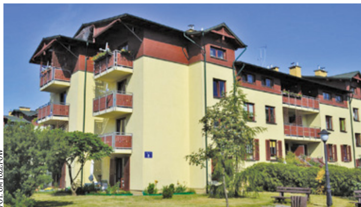
PHOT. UM JÓZEFÓW

Poważne zastrzeżenia dotyczą również stanu technicznego mieszkań. Lokatorzy mówią o popękanych ścianach, odpadających tynkach, wilgoci oraz ciekących i zagrzybionych oknach dachowych. Twierdzą, że naprawy są przeciągane, a zgłaszane problemy bywają zbywane. W ich ocenie