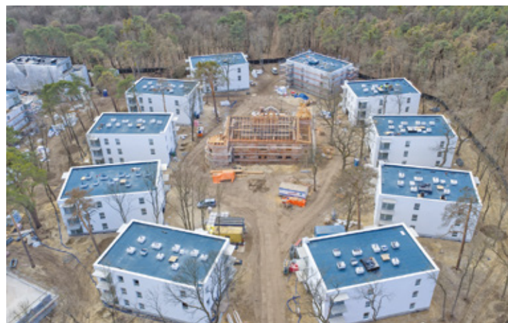
Tak dziś wygląda teren dawnego Dworu Bojarów nad rzeką Świder

W 2024 roku informowaliśmy, że okoliczni mieszkańcy byli zszokowani skalą wycinki prowadzonej podczas przygotowań do inwestycji. – Teren przy Bojarowie był zalesiony, a teraz