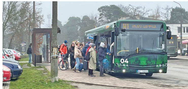
Podczas 2-tygodniowej przerwy w ruchu pociągów pasażerowie będą mogli korzystać także z lokalnych linii autobusowych

• Pasażerowie będą mogli także skorzystać z lokalnych autobusów, które obecnie kursują przez Otwock czy Józefów, m.in. z bezpłatną miejską linią W1, która jedzie trasą S2 do Metra Imielin oraz (płatną) powiatową linią K51 (Karczew-Falenica).