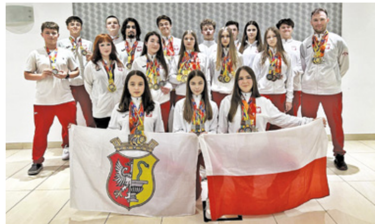
Młodzi karatecy zdobyli podczas mistrzostw świata na Malcie złote, srebrne i brązowe medale

– Nasi multimedaliści Mistrzostw Europy nie tylko bronili tytułów, ale kolejny raz pokazali światowy poziom wyszkolenia i spokój ducha, na który pracuje się latami. Kata w ich wykonaniu to unikalne połączenie dynamiki