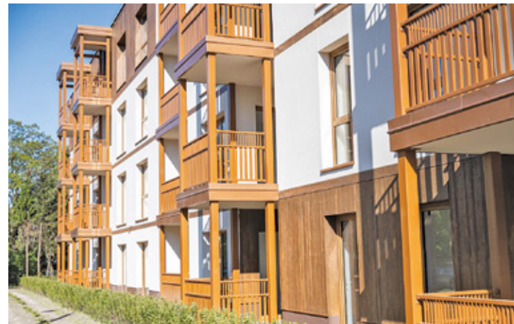
W budynku wielorodzinnym jest 66 mieszkań o powierzchni 35–74 m 2

Połączenie nowoczesności z tradycją, bliskość małej tętni solankowej oraz atrakcyjny czynsz 22,84 zł/m 2 (ok. 1,1 tys. zł za 50 m 2 ) wzbudziły ogromne zainteresowanie. W budynku mieści się 66 mieszkań o powierzchni 35–74 m 2 , przeznaczonych dla osób o najniższych dochodach, czyli tych, które nie mogą pozwolić sobie na zakup własnego mieszkania, a jednocześnie nie kwalifikują się do lokali komunalnych. Do dyspozycji mieszkańców jest 67 miejsc w podziemnym garażu oraz dwa miejsca na zewnątrz dla osób z niepełnospraw-