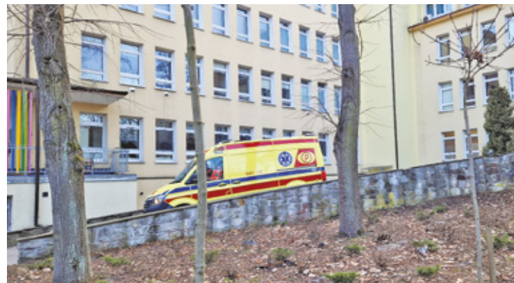
Na oddziale intensywnej terapii od dawna panowała zła atmosfera

– W czerwcu z pracy odeszło trzech anestezjologów. Taka liczba specjalistów jest niezbędna do pełnego i bezpiecznego funkcjonowania oddziału. Obecnie szpital dysponuje personelem anestezjologicznym zapewniającym opiekę nad pacjentami na oddziałach ginekologii i chirurgii, co pozwala na realizację wszystkich zaplanowanych i niezbędnych zabie-