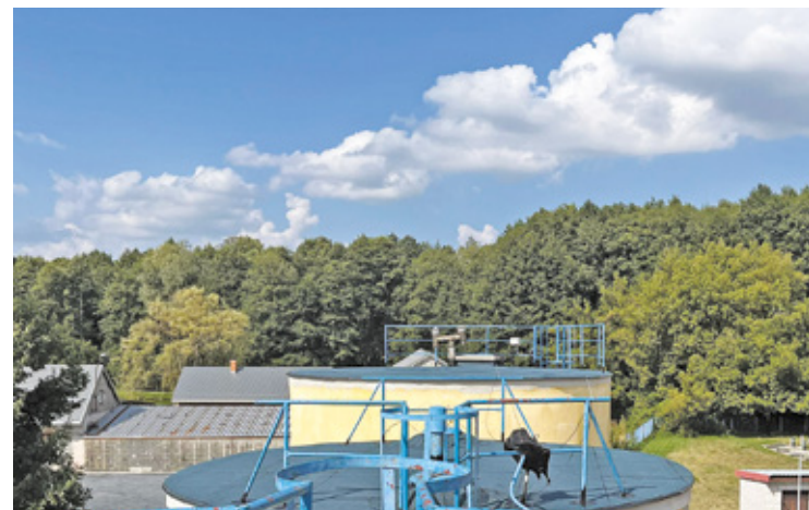
Prace obejmowały wymianę warstw izolacyjnych, naprawy konstrukcyjne oraz zabezpieczenie powierzchni dachowych

Zakończony niedawno drugi etap dotyczył remontu stropodachów. Prace obejmowały wymianę warstw izolacyjnych, naprawy konstrukcyjne oraz za-