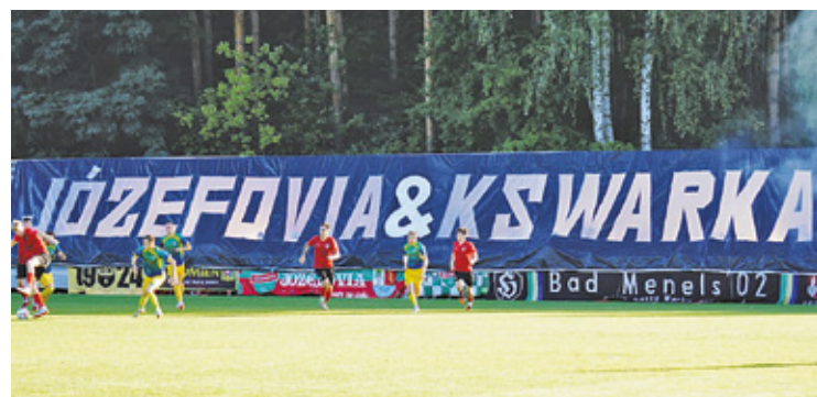
Kibice obu drużyn przyjaźnią się ze sobą

lider Tygrys Huta Mińska 18, wicelider Energia Kozienice 17 i trzeci Znicz II Pruszków 16. W związku z tym wystarczy tylko jeden mecz, aby całkowicie zmienić układ w czołówce stawki. I może się to już stać w najbliższy weekend.