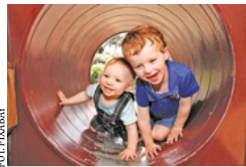
W nowej placówce znajdzie opiekę ponad 70 malutkich dzieci

chodniki, ponad 30 miejsc parkingowych, altana śmietnikowa, zbiornik na deszczówkę, szambo z przyłączem kanalizacyjnym, kanalizacja deszczowa z systemem rozsączania oraz przyłącza gazowe i wodociągowe.