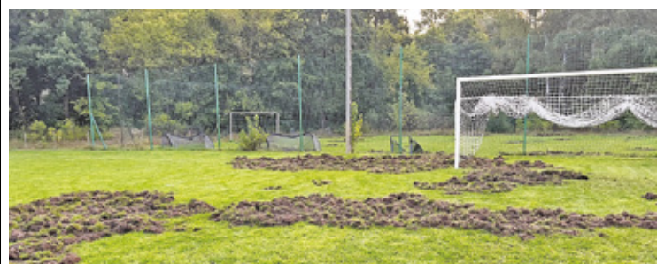
Zwierzęta przeorały boisko niczym pługi

Podobna sytuacja miała miejsce pod koniec sierpnia na terenach klubu PKS Radość w Wawrze. Mimo wzmocnionego ogrodzenia stado dzików i tak przedostało się na boisko, gdzie rozgrzebało murawę. – Od zawsze mieliśmy problem z dzikami. Poprawa ogrodzenia i wzmocnienie zabezpieczeń wokół boisk miały przynieść pozytywne skutki, ale jak się okazuje, duży dzik może wejść na posesję nawet z ogrodzeniem panelowym i bez problemu sforsować ogrodzenie boiska