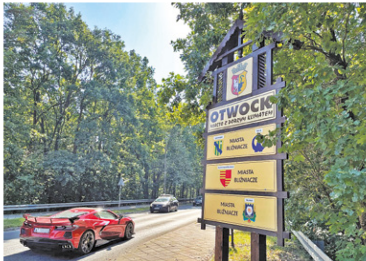
Nowe tablice powitalne będą drewniane i swoim wyglądem nawiązywać do stylu świdermajer

Nowe tablice powitalne będą drewniane i swoim wyglądem nawiązywać do stylu świdermajer. Pierwsze z nich już ustawiono przy wjeździe do miasta od ul. Kołtąta przy moście dla Świdra, gdzie niedawno modernizowano drogę, a drugi witacz jest przy wjeździe z trasy 801 w ul. Kraszewskiego od strony Świdrów Wielkich. Miasto planuje ustawienie takich witaczy przy wjazdach do Otwocka na ulicach: Jana Pawła II, Żeromskiego, Narutowicza,