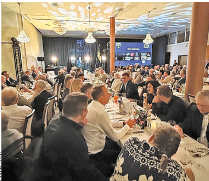
Uroczysta gala odbyła się w hotelu w Wawrze