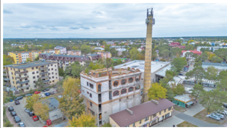
Wiele lat temu kotłownia OSM została zamknięta i od tamtej pory budynek niszczeje