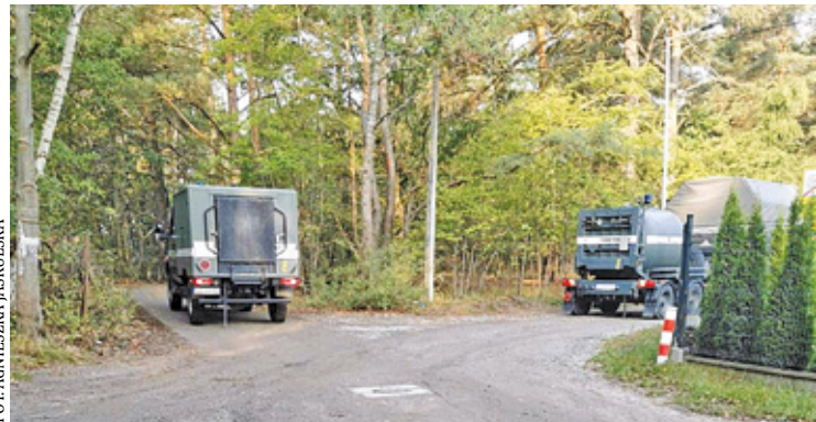
Militarne znalezisko zostanie przewiezione na poligon

Przedmiot zostanie przewieziony na poligon, gdzie po dokładnych oględzinach zostanie bezpiecznie zutyliзовany. Zapewniono również, że nie było żadnego zagrożenia dla mieszkańców,