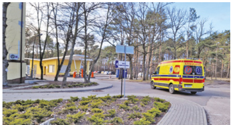
Oddział OIOM w szpitalu powiatowym nie działa od kilku miesięcy

Jak już informowaliśmy, oddział intensywnej terapii w szpitalu powiatowym przy ul. Batorego w Otwocku nie funkcjonuje od początku czerwca br. Było to związane z odejściem trzech anestezjologów. W związku z zawieszeniem działalności oddziału, pacjenci wymagający intensywnej te-