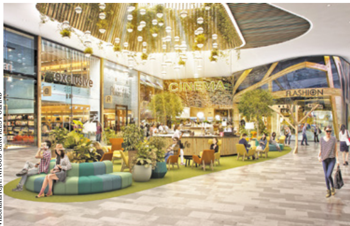
Przy Majalandzie w Góraszce rozpocznie się budowa kompleksu handlowego

N a terenie dawnego lotniska w Góraszce, w gminie Wiązowna przy trasie S17, od lat planowano budowę centrum handlowego. Po wielu perypetiach i 16 latach inwestycja wreszcie zyskuje szansę na realizację. Obecnie – jak już informowaliśmy – Projekt Góraszka, realizowany przez Nhood Services Poland i General Aviation, nie będzie już typowym centrum handlowym, jakie planowano ponad 16 lat temu, lecz powstanie tu ogromny kompleks handlowo-rozrywkowy. W obiekcie będą m.in.: aquapark, kino, klub fitness, centrum medyczne, strefa restauracyjna, park handlowy, outlet, hipermarket, market DIY, stacja paliw z myjnią, a także parking na ponad 1,7 tys. miejsc. Mieszkańcy będą mogli zrobić zakupy w 100 różnych sklepach i butikach różnych marek, a także w hipermarkecie Auchan czy sklepie budowlanym Leroy Merlin.