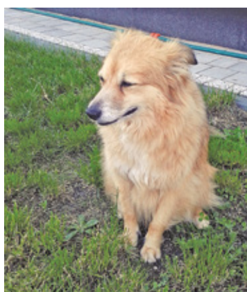
W akcję poszukiwawczą włączyli się Czytelnicy „Przeгляdu”. Udostępniali informacje na Facebooku i innych social mediach

– Dzięki nieocenionej pomocy osób, które się zaangażowały w poszu-