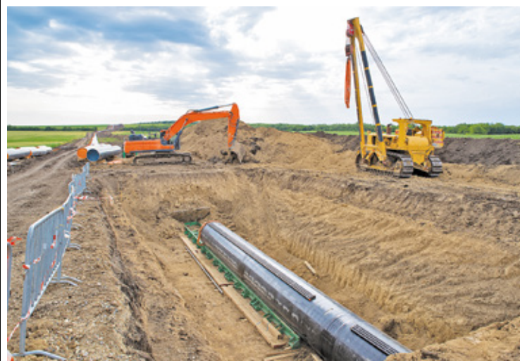
Inwestycja obejmie odcinek od ul. Borowikowej w Majdanie w kierunku oczyszczalni ścieków w Zagórze

Przed rozpoczęciem robót na ul. Zagórskiej wprowadzona zostanie tymczasowa organizacja ruchu drogowego, obowiązująca w trakcie trwania budowy.