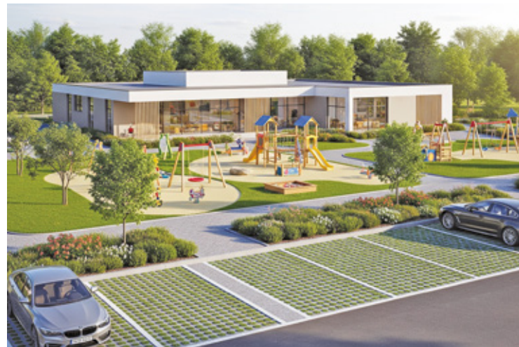
W Zakręcie planowana jest budowa nowoczesnego jednokondygnacyjnego żłobka

Na terenie żłobka przewidziano zieleń oraz plac zabaw (realizowany w ramach osobnego zadania), a także ławki i kosze na śmieci. Powstaną