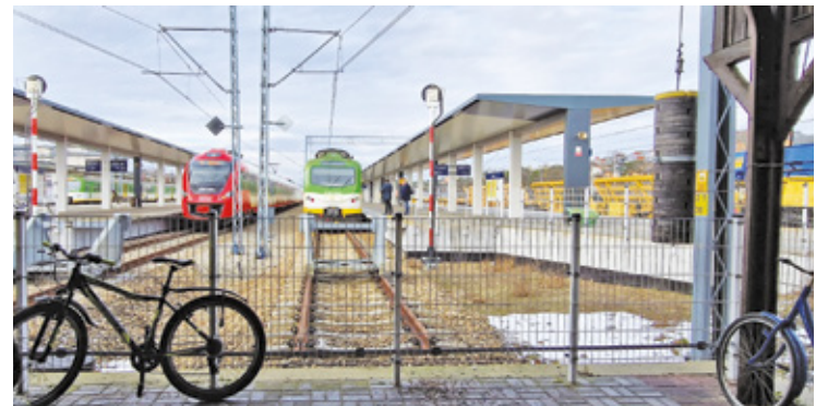
Przez połowę marca 2026 roku pociągi nie będą kursowały

ciągów. Wtedy wykonawca zaplanował 2-tygodniowe wstrzymanie ruchu kolejowego i zastąpienie pociągów autobusami. W tym czasie wykonawca m.in. przełoży urządzenie sterowania ruchem, uruchomi kolejowe bajpasy oraz przygotuje tymczasowe przejazdy i przejścia m.in. w Michalinie i Międzyzlesiu. Czasowa organizacja ruchu i zastępcza komunikacja autobusowa