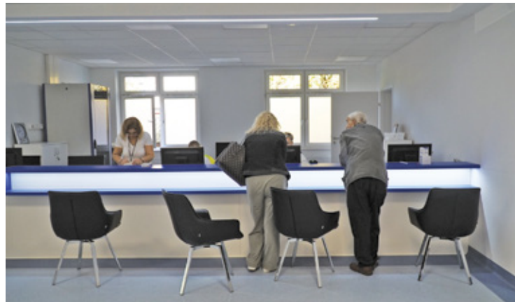
Rok temu zakończono modernizację przychodni przy ul. Armii Krajowej w Otwocku