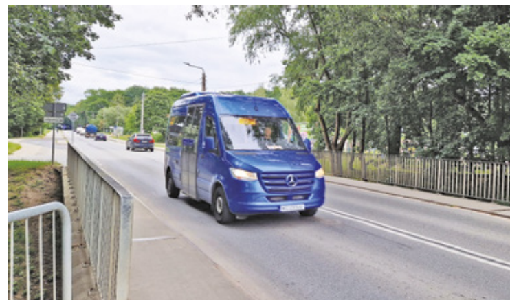
Linie W12 nadal będzie obsługiwał ten sam prywatny przewoźnik, co dotychczas

Urząd Gminy Wiązowna wyjaśnia, że autobus linii W12 jest środkiem transportu publicznego, dlatego jego rozkład nie może być idealnie dopasowany do godzin zakończenia zajęć w każdej szkole. – Przypominamy również, że uczniowie szkół podstawowych mają możliwość korzystania z autobusów szkolnych, na które gmina co roku przeznaczona ponad 600 tys. zł – zaznacza urząd. I dodaje: – Aby dziecko