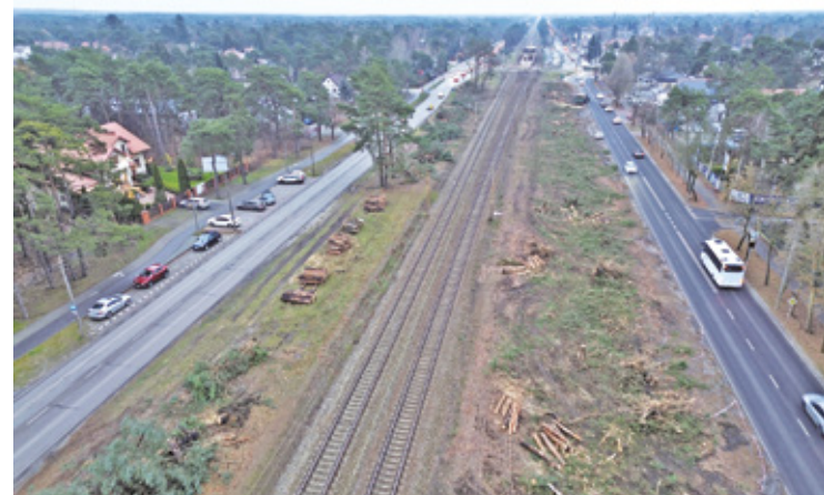
W grudniu i styczniu wykonawca modernizacji linii kolejowej zacznie sporządzanie swojej dokumentacji fotograficznej budynków w Otwocku, Józefowie i Wawrze, położonych najbliżej torów

wani o wizytach pracowników i mieli dobrze widoczne legitymacje lub identyfikatory, co pozwoli łatwo potwierdzić ich tożsamość. Przedstawiciel PKP dodaje, że właściciele mogą również umawiać inwentaryzację bezpośrednio z wykonawcą lub inwestorem.