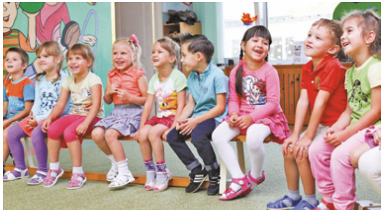
Niedawno radni rozpatrywali skargę na dyrektorkę gminnego przedszkola