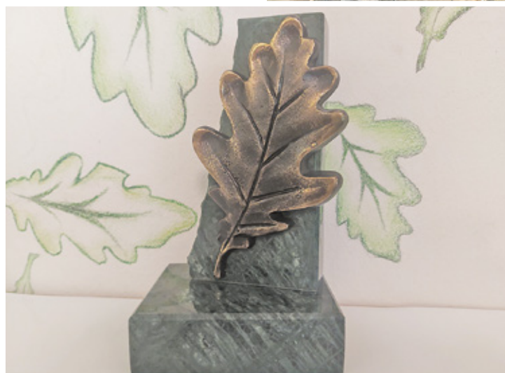
Już po raz siedemnasty statuetki projektu Mariusza Koszuta otrzymają mieszkańcy szczególnie zasłużeni dla miasta

szczenia można także nadsyłać pocztą elektroniczną na adres: promocja@milanowek.pl. Warunkiem przyjęcia wniosku wysłanego mailowo jest dołączenie do niego skanu oryginalnych dokumentów.