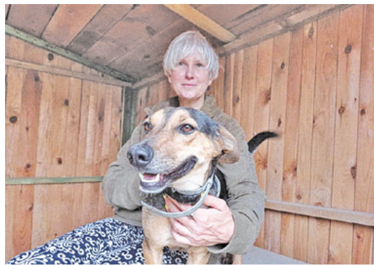
FOT. SCHRONISKO W KORABIEWICACH

W Korabiewicach mieszka 400 zwierząt, ponad 200 spośród nich, to psy. Schronienie znalazły tu jednak także koty, krowy, konie, świnię, owce, kozy, kury, gęsi, lisy i jeno-