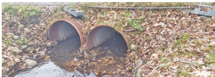
Modernizacja stawu preferowana przez miasto polega m.in. na tym, że woda z cieku, który zasiliał staw, popłynie pod jego powierzchnią tymi rurami

Spór wokół stawu budzi w niektórych środowiskach tak duże emocje, że zwolennicy stanowiska Dendropolis wola się publicznie nie wypowiadać. Z rozmów z mieszkańcami można wyciągnąć wniosek, że chcieliby