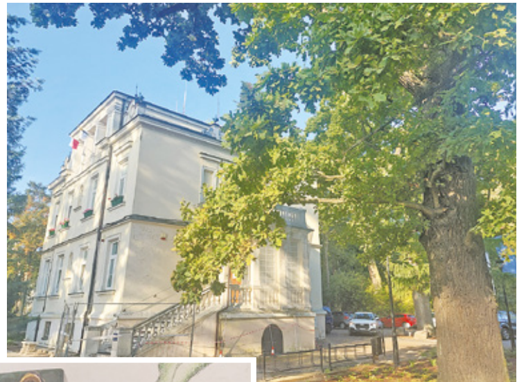
Dęby stanowią ozdobę Milanówka także te rosnące przy urzędzie miasta

a także firmy, organizacje i instytucje. W tym roku zgłoszenia kandydatów do tej nagrody przyjmowane są wyłącznie na formularzach zgłoszeniowych, które dostępne są na stronach miasta. Wypełnione formularze można składać w sekretariacie urzędu miejskiego przy ul. Kościuszki 45 lub w punkcie obsługi interesanta przy ul. Spacerowej 4. Zgło-