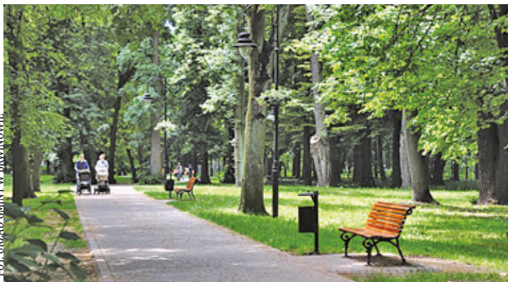
Latarnie w brwinowskim parku włączają się automatycznie na podstawie danych astronomicznych

Samorząd Brwinowa modernizuje oświetlenie uliczne. Dawniej stosowane były aparaty zmierzchowe, ale obecnie włączanie i wyłączenie lamp ulicznych sterowane jest już w większości za pomocą zegarów astro-