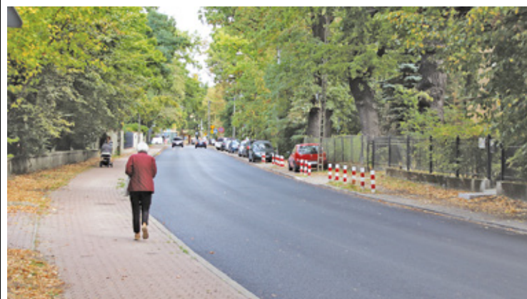
Nowa nawierzchnia na ul. Dębowej w Milanówku

W trakcie realizacji jest remont drogi nr 1526W – ul. Dębowej w Milanówku. To droga łącząca Grodzisk Mazowiecki z Milanówkiem. Naprawy wymagała nawierzchnia na dwóch odcinkach: o długości 252 metrów i 300 metrów (od ul. Skargi do ul. Staszica oraz od ul. Smoleńskiej do ul. Grabowej). Koszt remontu to ok. 1,5 mln zł, w tym prawie 600 000 zł z RFRD. Trwa również rozbudowa drogi powiatowej nr 1515W w miejscowościach Budy-Grzybek w gminie Jaktorów oraz Czarny Las i Makówka w gminie Grodzisk Maz. Jej koszt to ponad 15 mln zł, ale