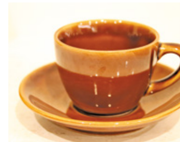
Filiżanka z pruszkowskiego porcelitu

D ziś można odnieść wrażenie, że władze tych miast mają często problem z legendą tych zakładów, która często żyje w społeczeństwie. W internecie pojawiają się grupy osób, które dokumentują historię albo po prostu zbierają wyroby tych nieistniejących już zakładów czy pamiątki.