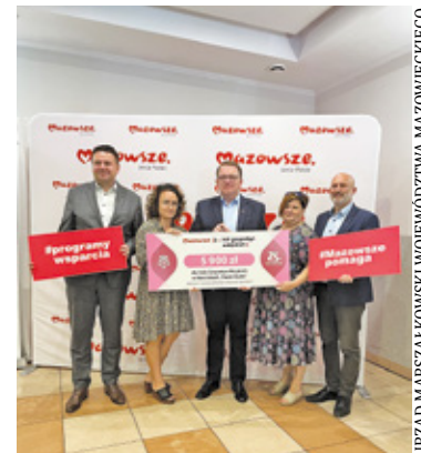
Czek dla koła gospodyń wiejskich w Mościskach

W ramach programu „Mazowsze dla kół gospodyń wiejskich” dofinansowanie m.in. na zakup sprzętu kuchennego przyznano organizacjom w Chrzanowie Małym, Mościskach, Książ-