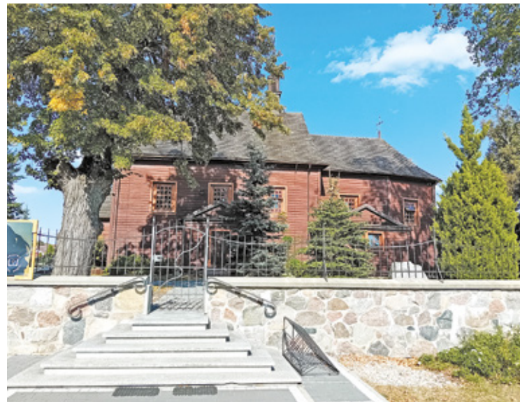
Na terenie parafii kręcono serial Ojciec Mateusz

mesy z Rządowego Programu Odbudowy Zabytków Gmina Wiązowna udziela Parafii dofinansowania w wysokości 512.500,00 zł, z czego 500.000,00 zł pochodzi z dotacji Rządowego Programu Odbudowy Zabytków, natomiast