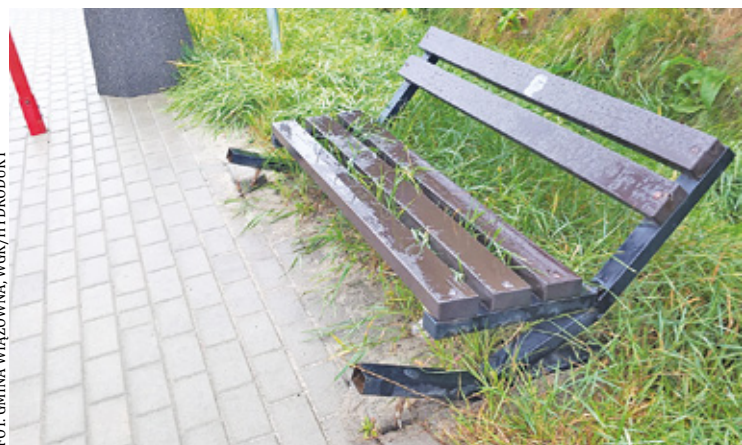
Marnowanie naszych pieniędzy przez bezmyślność wandalów

Mercure Hotel Wiązowna Brant – www.branthotel.pl ul. Równa 20, Majdan, 05-462 Wiązowna, tel. 22 789 00 10