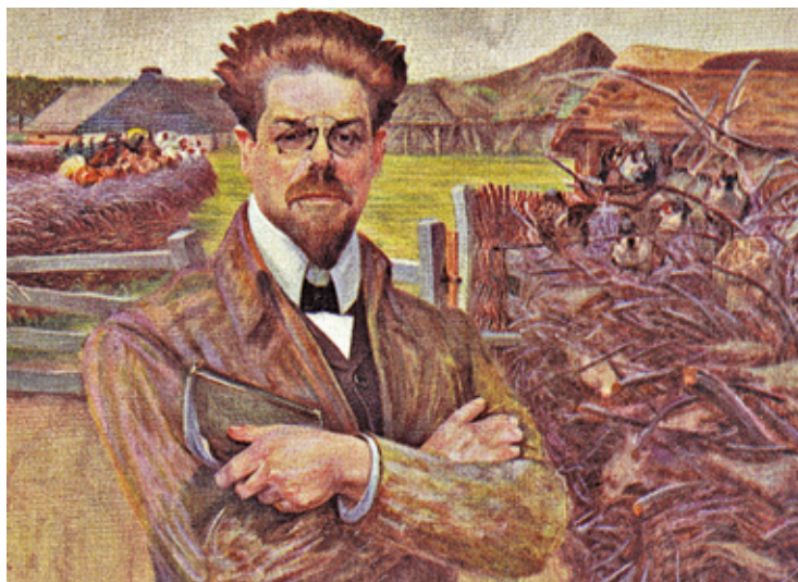
Pisarz Władysław Reymont w obrazie Jacka Malczewskiego

W swojej ostatniej woli pisarz przekazał majątek w Kołaczkowie na dom pracy twórczej Związku Literatów. Aurelia nie miała zamiaru spełnić tego życzenia. Sprzedała posiadłość i wybudowała sobie willę w Warszawie na Żoliborzu. Do tych interesów potrzebny był jej mecenas, więc wyszła za przystojnego mec. Czeszera, nie chciała być narodową wdową, ale gdy Niemcy zaczęli prześladować i zamykać w gettach ludność pochodzenia żydowskiego unieważniła małżeństwo podając powód „non consummatum”. Trzeci mąż