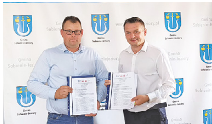
W 13 miesięcy ma zostać wyremontowanych aż 12 dróg gminnych

Zgodnie z założeniami w 13 miesięcy gmina wyremontuje aż 12 odcinków dróg. A które dokładnie?