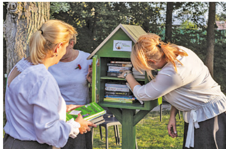
Budka wyposażona w literaturę, ma zachęcać do „uwalniania” książek

– Ważnym punktem programu było uroczyste otwarcie „Budki bookcrossingowej”, która – z inicjatywy Bibliote-