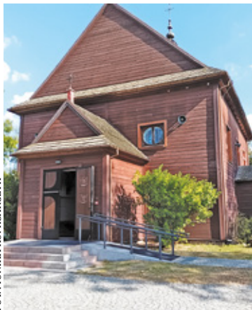
Zabytkowy budynek w 2025 roku przedzie modernizacją

do niego ołtarz główny, dwa ołtarze boczne i ambona. Obrazy zostały namalowane w XVIII wieku. Dzwonnica drewniana z poł. XVIII w., trójkondygnacyjna, zbudowana w bryle kwadratu,