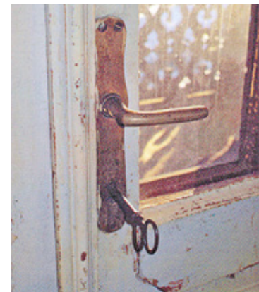
Mosiężne okucia drzwi ze starożytnym kluczem w willi Lala

W listopadzie 1924 r. po całym świecie telegrafy informowały, że Nagrodę Nobla w dziedzinie literatury otrzymał pisarz Władysław Reymont za powieść Chłopi. W tym czasie Reymont był chory na zapalenie płuc, a że z układem oddechowym zawsze miał problem nie wróżyło to dobrze. Wyjechał na Riwiere, ale klimat tamże polecany przez lekarzy nie spowodował poprawy. Wrócił do Warszawy. Piszą o tym, że ciągle coś go gnało, jakiś niepokój go dręczył. Wincenty Witos prezes Polskiego Stronnictwa Ludowego zorganizował z udziałem włościan uroczysto-