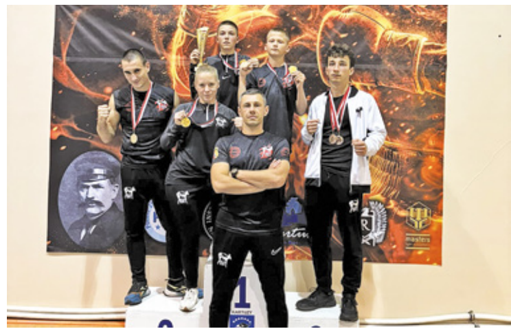
Wielki sukces zawodników sportów walki z Otwocka

Po przerwie Ząbkovia szybko podwyższyła wynik – w 51. minucie bram-