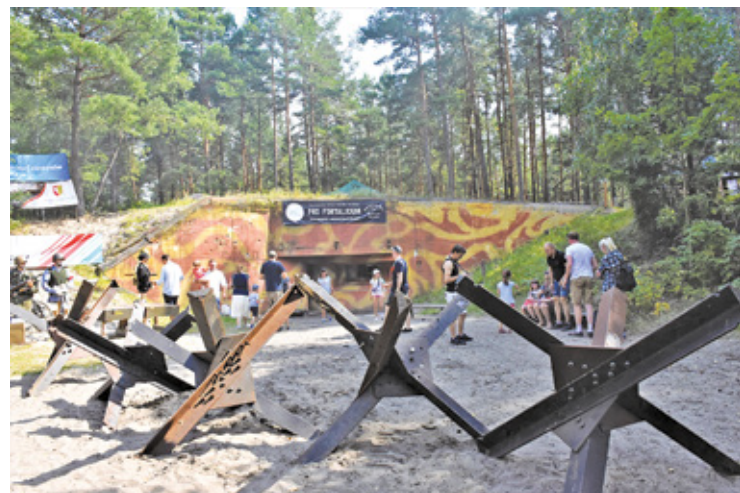
Piknik to duża frajda dla rodzin z dziećmi, a także dla miłośników militariów

Nie zabraknie także wystaw prywatnych kolekcjonerów i muzeów z regionu, prezentujących rzadkie eksponaty związane z historią wojskowości. Od zabytkowych pojazdów po broń i wyposażenie, to prawdziwy raj dla pasjonatów. – Tegoroczna edycja będzie szczególnie interesująca, gdyż po raz pierwszy na pikniku poza kuchnią po-