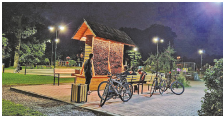
Kilka dni temu w parku postaviono tęźnię solankową

Ostatnio do parku dodano nową atrakcję – tęźnię solankową. Ten nowy obiekt zaskoczył niektórych mieszkańców. – Nie było widać żadnych pracowników. Kiedy ją postaviono? – zastanawia się jeden z mieszkańców. Inna