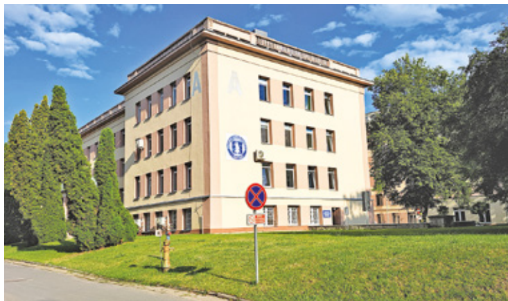
Ministerstwo zablokowało rozbudowę szpitala w Międzylesiu

– Mając na uwadze bardzo trudne warunki panujące w Szpitalnym Oddziale Ratunkowym (SOR), zamierzam powiększyć oddział, co jest związane z rozbudową szpitala – komentuje