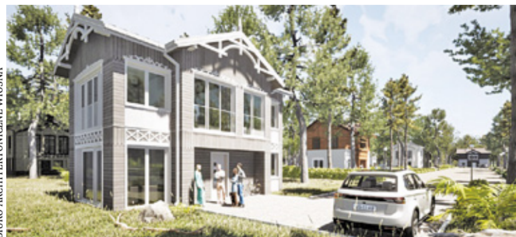
BIURO ARCHITEKTONICZNE WIOSNA

mieszkańców. Otwocki samorząd przeznaczył pieniądze na wykonanie trzech projektów budynków jednorodzinnych o powierzchni do 70 m kw. – Będą dostępne bezpłatnie zarówno dla osób planujących budowę domu, jak i dla tych, którzy chcieliby wykorzystać