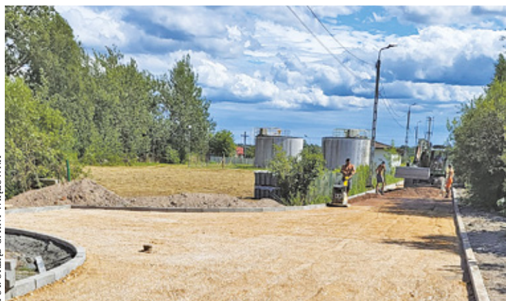
Samorząd modernizuje drogi w gminie

Jednocześnie równolegle trwają prace budowlane na ul. Marii Dąbrowskiej w Woli Duckiej. – Tutaj już powsta-