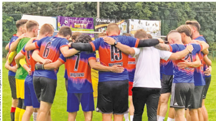
Advit Wiązowna wygrywa w sparingach