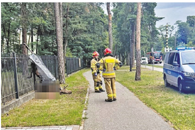
Łoś nadział się na kolce ogrodzenia

Powiat – Przyjdź na Piknik Forteczny s. 5