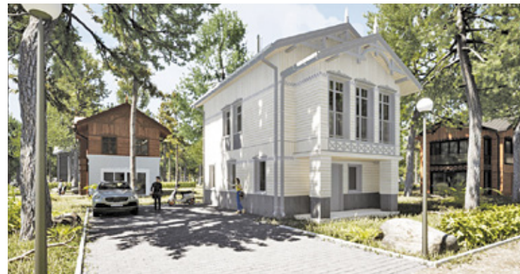
BIURO ARCHITEKTONICZNE WIOSNA

Wszystkie domy mają formę dwukondygnacyjnego prostopadłościowca z nieużytkowym poddaszem i dwuspadowym dachem. Fasady zostały roz-