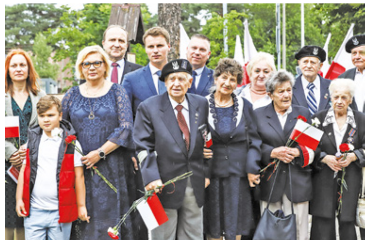
Uroczystości odbyły się m.in. na skwerze przy teatrze w Otwocku