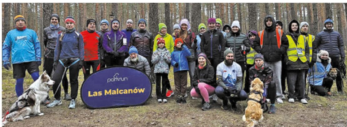
17. parkrun w Malcanowie