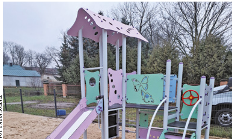
Plac zabaw znajduje się przy ulicy 3 Maja

– Zgodnie z Regulaminem obiektu urządzenia zabawowe przeznaczone są dla dzieci w wieku powyżej 3 lat. Dzieci w wieku do 12 lat na placu zabaw mogą przebywać wyłącznie pod opieką osoby dorosłej. Łączny koszt inwestycji wyniósł 119 396,52 zł (z czego ze środków zewnętrznych pozyskano 47 451 zł) – podkreśla urząd.