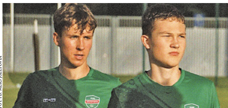
Młodzi zawodnicy regularnie występują w zespole seniorów