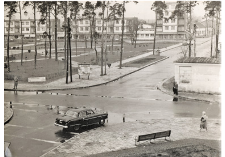
Widok na plac centralny i skrzyżowanie ul. Andrzejowskiej z ul. Powstańców Warszawy – lata 60-70.