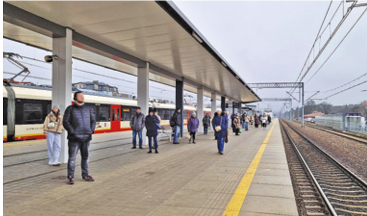
Nowy system informacji pasażerskiej błyskawicznie poinformuje podróżnych o zmianach w rozkładzie

W ramach modernizacji systemu informacji pasażerskiej zostaną zainstalowane kamery na peronach i przystankach kolejowych, także na PKP Otwock. Monitoring ma działać całodobowo i być zintegrowany z inny-