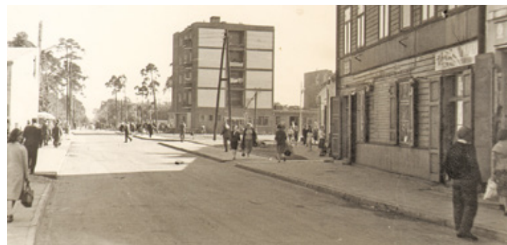
Nowa ul. Andrzejowska na miejscu danej ul. Karczewskiej – widok od ul. Bazarowej – lata 50.

Drugie urbanistyczne porządkowanie Otwocka odbyło się już po II wojnie