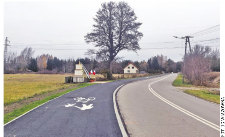
W gminie Wiązowna znajdują się jedne z najdłuższych tras rowerowych w powiecie otwockim

C oraz więcej osób wybiera rower jako środek transportu, co sprawia, że rozbudowa infrastruktury rowerowej stała się priorytetem dla wielu gmin. W gminie Wiązowna znajdują się jedne z najdłuższych tras rowerowych w powiecie otwockim.