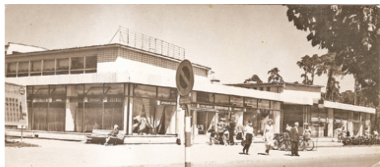
Nieistniejące już pawilony handlowe przy ul. Powstańców Warszawy – pocztówka z lat 60.