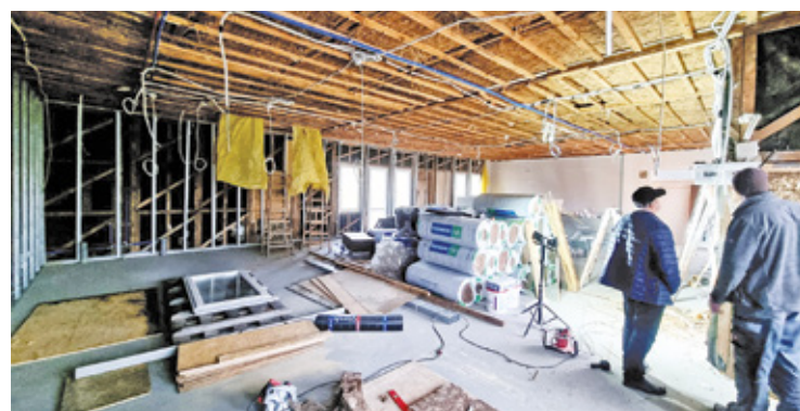
Po ponad 20 latach mieszkańcy Ostrówka będą mieli miejsce do spotkań i integracji

– Wnętrze budynku nie było remontowane od kilkudziesięciu lat. W części pomieszczeń znajdowały się lokale komunalne. Decyzją burmistrza przeznaczenie tych lokali zostało zmienione i przekazano je sołectwu na powiększenie świetlicy. Zakończenie