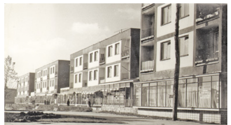
Osiedle Rynek I – lata 60.

Sukces osiągnięty podczas budowy „Osiedla Rynek I” poskutkowało opracowaniem planu dalszej przebudowy centrum w latach 1966-1970. Zaprojektowano „Osiedle Rynek II”, mające składać się z tzw. punktowców, czyli pięciokondygnacyjnych bloków mieszkalnych, które w efekcie nie zostały wybudowane. Natomiast w ramach tej rozbudowy wzniesiono przy ul. Powstańców Warszawy okazały budynek Banku PKO i PZU, pawilon handlowo-administracyjny PSS „Społem” oraz zespół pawilonów handlowych przy ul. Wawerskiej.