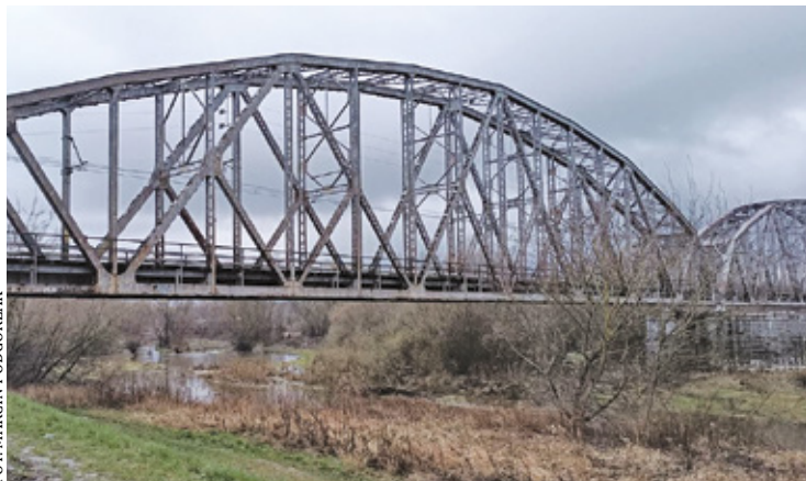
Ścieżka łącząca dwa brzegi Wisły mogłaby stać się atrakcją turystyczną

– Czy na nowym moście kolejowym w Górze Kalwarii będzie przejście dla