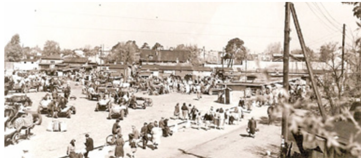
Dawne targowisko miejskie na terenie obecnego Placu Niepodległości – lata 50.

W latach 1956-1958 miejski Wydział Budownictwa pod kierunkiem architekta miejskiego, inż. arch. Jerzego Katkiewicza, opracował gruntowną koncepcję przebudowy, modernizacji i urbanizacji centrum Otwocka. Projekt ten przewidywał m.in. likwidację i przeniesienie targowiska miejskiego z dotychczasowego miejsca na plac przy