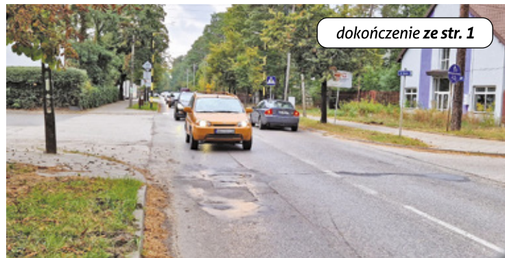
Wykonawca wyznaczył objazd dla kierowców: ul. Majową przez tunel drogowy i rondo, a następnie ul. Jana Pawła II w kierunku Józefowa lub Otwocka

Wykonawca wyznaczył objazd dla kierowców: ul. Majową przez tunel dro-