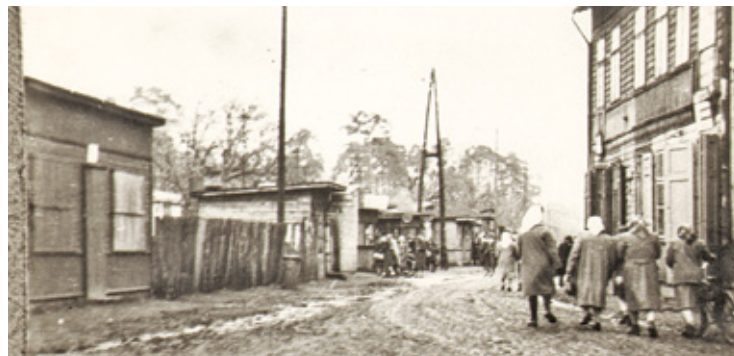
Dawna Karczewska – widok od ul. Bazarowej – lata 50.

owymi na wschodzie, ulicą Staszica na zachodzie, ul. Świderską na północy i ul. Powstańców Warszawy na po-