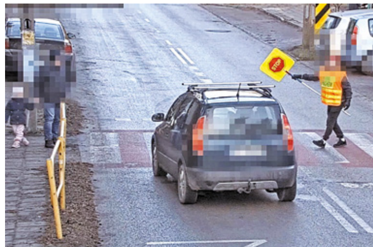
Kierująca skodą za piracką jazdę przy szkole została ukarana 47 punktami karnymi

– Otwocka policja otrzymała zgłoszenie od dyrekcji jednej z otwockich szkół o kierowcy skody, który, ignorując polecenia osoby kierującej ruchem, nie tylko nie ustąpił pierwszeństwa pieszym, ale także z impetem wjechał na pasy, stwarzając poważne zagrożenie w ruchu drogowym. Zdarzenie