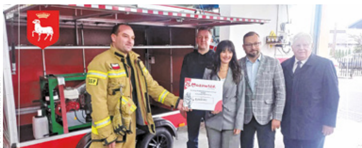
Kompresor będzie służył do napełniania sprężonym powietrzem butli aparatów oddechowych

butli aparatów oddechowych używanych podczas zwalczania pożarów oraz podczas innych zdarzeń, gdzie wymagana jest ochrona dróg oddechowych ratowników. Powietrze z takich butli jest także używane w ratownictwie technicznym do zasilenia zestawów poduszek pneumatycznych, używanych do podnoszenia ciężkich obiektów takich jak auta ciężarowe, elementy zawalonych konstrukcji budowlanych. Zużycie sprężonego powietrza podczas pożarów i innych wymagających akcji jest dosyć duże. Posiadanie takiego