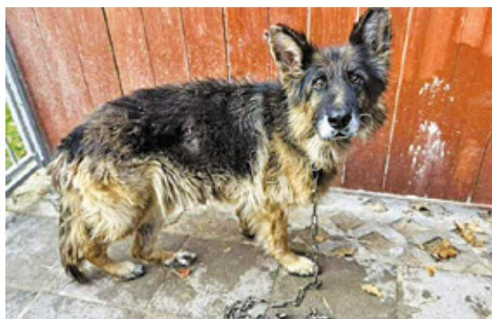
Błyskawicznie udało się zebrać pieniądze na leczenie. Suczka jest w tej chwili pod opieką weterynarza