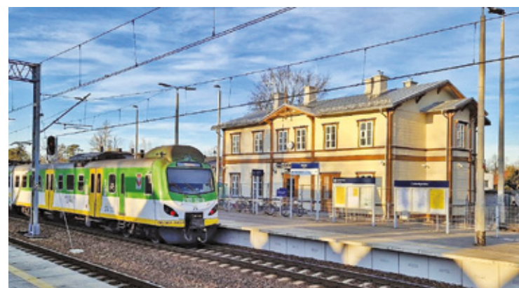
Budynek jest wyposażony w iluminację, która podkreśli jego zabytkowy charakter

poczekalnia, kasa biletowa i łazienka. Na parterze i piętrze przewidziano też pomieszczenia do wynajęcia, które