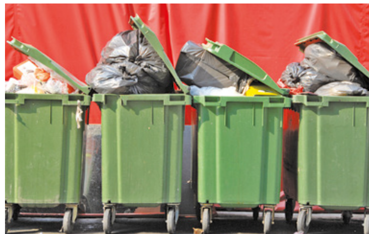
Wójt zwraca uwagę, że stawki ostatni raz były zmieniane pod koniec 2022 roku, a konieczność dopłaty blisko pół miliona złotych wskazuje, że poprzednie władze nie doszacowały stawki

Decyzję o podniesieniu kwoty za odbiór odpadów od 1 stycznia 2025 roku krótko skomentował komitet Wspólnie dla dobra Gminy, podając w mediach społecznościowych: