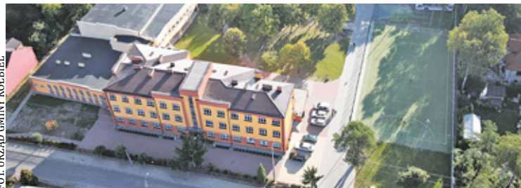
Meble w szkole w Kołbieli są zbyt niskie i nieodpowiednie do potrzeb dzieci w wieku szkolnym

Z wnioskiem o wymianę ławek i krzeseł w dwóch salach lekcyjnych Szkoły Podstawowej im. Armii Krajowej zwrócili się do Przewodniczącego Rady Gminy rodzice.