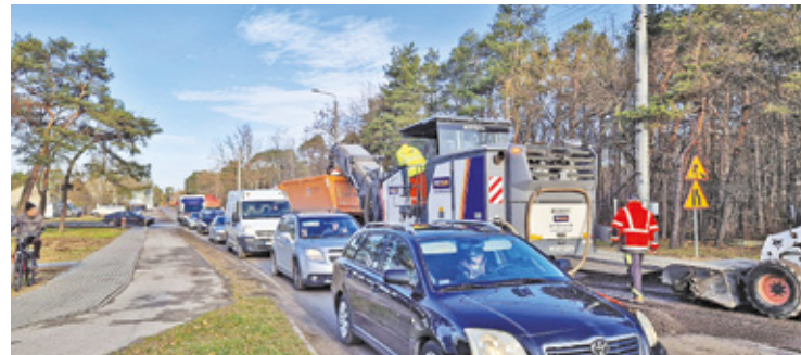
Na ul. Kraszewskiego trwa modernizacja drogi

– Rozkład jazdy pozostał bez zmian – zapewnia Urząd Miasta Otwock. I dodaje, że objazd dla autobusów będzie obowiązywał do poniedziałku (16 grudnia).