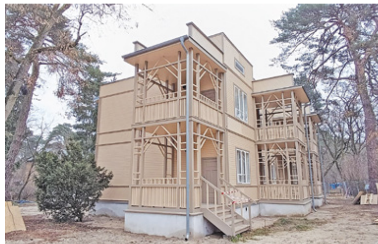
Willa nosi przydomek „Dziadek”, dzięki działalności pedagoga Kazimierza Lisieckiego

Remont zabytkowej willi dobiega końca. – Prowadzone są ostatnie odbiory techniczne, a w przyszłym roku zostaną przeprowadzone prace związane z adaptacją wnętrza i uporządkowaniem terenu wokół budynku – zapewnia mazowiecki konserwator zabytków.