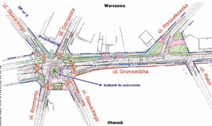
Nowe rondo ma powstać na ul. Grunwaldzkiej w Świdrze

Na skrzyżowaniu ulic Grunwaldzkiej, Reymonta, Ostrowskiej i Słowackiego planuje się wyburzenie drewnianego budynku, budowę ronda, odwodnienia, oświetlenia, a także ul. Grunwaldzkiej prowadzącej od ronda