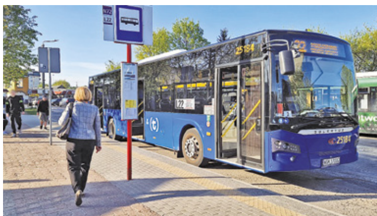
Obowiązuje nowy rozkład jazdy

– W związku z zakończeniem remontu mostu na ul. Napoleońskiej w Gliniance, od poniedziałku przywrócono podstawowe trasy linii L20 i 720. Autobusy kursują aż do krańca Rzakty – zapewnia ZTM. I dodaje, że od poniedziałku linie kursują według nowego rozkładu jazdy. Zlikwidowany został przystanek Glinianka 51, ale zaczęły