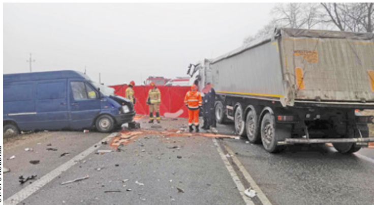
Na krajowej „50” zderzył się bus z TIR-em

Pojazdami które brały udział w wypadku, podróżowały łącznie trzy osoby: