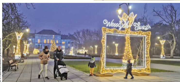
Błyszące iluminacje już tworzą w mieście świąteczną atmosferę