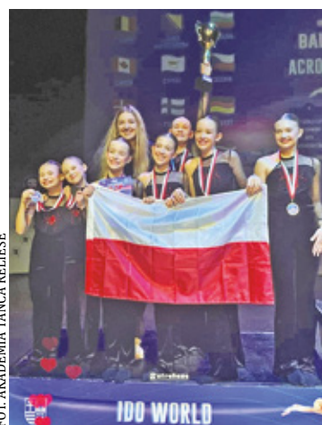
Uczennice szkół w Karczewie wytańczyły Wicemistrzostwo Świata

Podczas Mistrzostw Świata IDO Jazz Dance uczennice z karczewskich szkół zajęły 2. miejsce, zdobywając