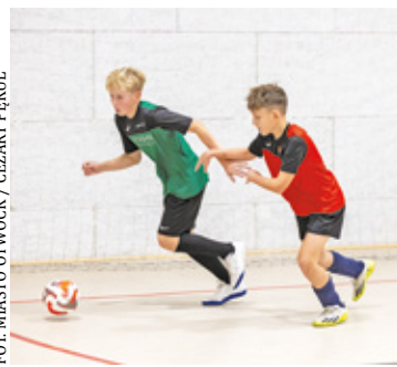
W zimę też można grać w piłkę

towej przy Nukleoniku w Otwocku rywalizowali gracze z roczników 2013 i młodszych oraz 2016 i młodszych. W zmaganiach starszych roczników najwięcej punktów w swoich grupach zdobyli MKS Otwock i KS Sobienie Jeziory. W młodszych najlepiej poradziły sobie: Józefovia Józefów, Victoria Zereń, Sokół Kołbiel, a także AP Deyna. Jak wyliczyli organizatorzy, ogółem rozegrano 48 spotkań, czyli 864 minuty, a więc mieliśmy ponad 14 godzin czystej gry.