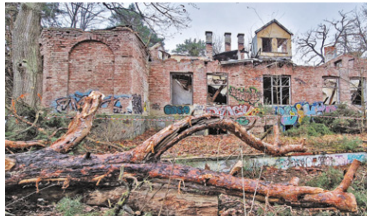
Dwór Bojarów jest wpisany do rejestru zabytków