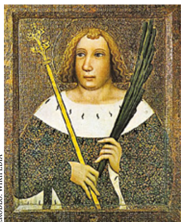
Święty Wit. Obraz wykonany przez Theodericha von Prag

na w 1743 r. pracował przy rozbudowie o boczne kruchty. Jest to kościół barokowy, murowany, tynkowany, orientowany z nawą główną trójprzęsłową. Środkowe przęsło jest szersze od pozostałych, a w nim ulokowane są półkoliście zamknięte otwory arkadowe do bocznych kaplic. Jego wyróżnikiem jest przepiękna, parawanowa, wklęsło-wypukła trzyosiowa fasada. Jej wyjątkowy styl został prawdopodobnie zaczerpnięty z twórczości piemonckiego architekta Guarino Guariniego, a także ze środowiska czeskiego. Nie ma on żadnej analogii w ówczesnym budownictwie sakralnym z rejonu Warszawy. W latach 1911-13 kościół