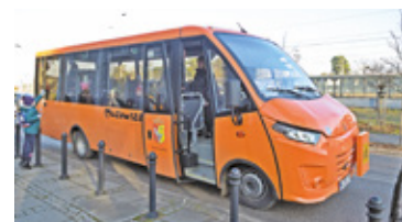
Nowoczesny autobus wyposażony jest w windę dla osób niepełnosprawnych

– Ten charakterystyczny, pomarańczowy pojazd, może zabrać 30 uczniów, w tym dzieci na wózkach inwalidzkich. To szczególnie istotne dla zapewnienia bezpiecznego transportu naszych najmłodszych mieszkańców – podkreśla prezydent Otwocka, Jarosław Margielski. I tłumaczy, że autobus przewozi uczniów do miejskich szkół podsta-