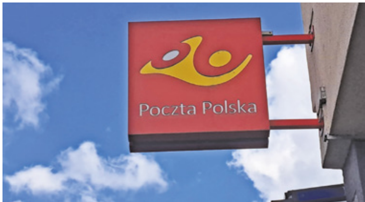
Przedstawicielka Poczty Polskiej zapewnia, że mieszkańcy gminy nie odczuwają wprowadzanych w ich placówce zmian

– Poczta Polska S.A. zgodnie ze zmieniającym się otoczeniem, a w szczególności rosnącym spadkiem