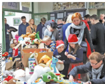
Z każdym rokiem do inicjatywy dołącza coraz więcej darczyńców

zdobią muzea i galerie, ale też amatorzy i dzieci, dla których organizujemy „Gwiazdobranie”. W ubiegłym roku ich twórczość spotkała się z ogromnym zainteresowaniem. Większość prac będzie dostępna w licytacjach on-line na Facebooku „Świąteczny Jarmark Charytatywny Gwiazdobranie i Dawanie” do 14 grudnia. Kilka dzieł zostanie wystawionych na aukcji podczas jarmarku – podkreślają organizatorzy „Gwiazdobrania”.