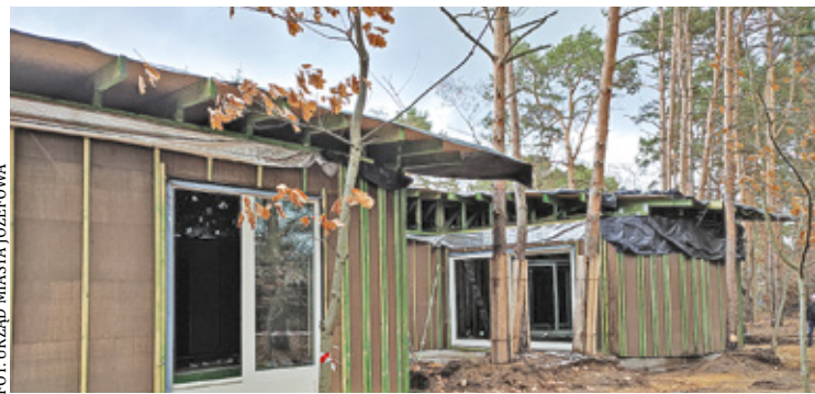
W nowej siedzibie Przedszkola Miejskiego nr 1 wykonano już fundamenty i uzbrojenie terenu w przyłącza wodno-kanalizacyjne i gazowe

Zakończenie robót wstępnie zaplanowane jest na 28 lipca 2025 r. Potem nastąpią prace związane z pozwoleniem na użytkowanie obiektu oraz kontrole za strony Państwowej Straży