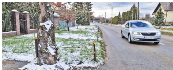
Niektórzy mieszkańcy Otwocka zamontowali przy trawnikach elektryczne pastuchy

Dziki coraz częściej wchodzą do miast. Ryją w trawnikach, na poboczach dróg, zaglądną na posesje i straszą mieszkańców. Ich obecność