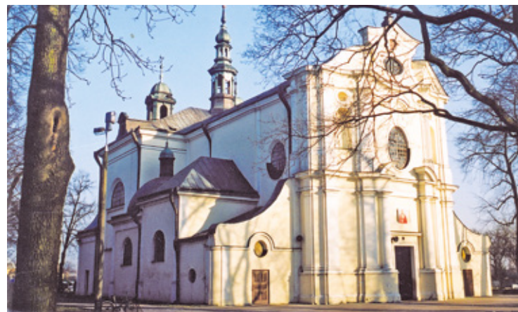
Kościół św. Wita

ga znajduje się w kaplicy Borkowskich przy farze w Kazimierzu Dolnym). Tego rodzaju nagrobki uznawane są przez historyków sztuki za charakterystyczne dla polskiego mieszczaństwa katolickiego XVI w. i nie mające analogii w Europie Zachodniej. Pewną wątpliwość budzi tylko fakt, że płyta jest datowana