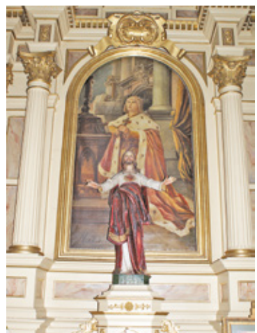
Ołtarz z obrazem św. Kazimierz