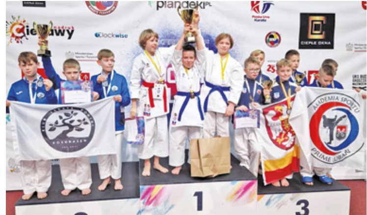
Na pierwszym stopniu podium!

towej przy Nukleoniku w Otwocku rywalizowali gracze z roczników 2013 i młodszych oraz 2016 i młodszych. W zmaganiach starszych roczników najwięcej punktów w swoich grupach zdobyli MKS Otwock i KS Sobienie Jeziory. W młodszych najlepiej poradziły sobie: Józefovia Józefów, Victoria Zereń, Sokół Kołbiel, a także AP Deyna. Jak wyliczyli organizatorzy, ogółem rozegrano 48 spotkań, czyli 864 minuty, a więc mieliśmy ponad 14 godzin czystej gry.