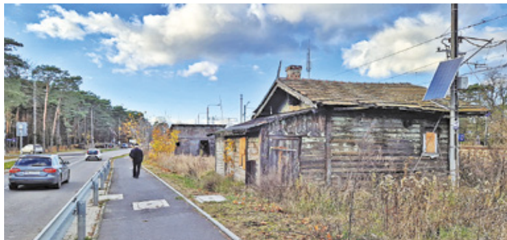
Otwocki magistrat zabezpieczył w kasie 100 tys. zł na opracowanie kompleksowego projektu rewitalizacji budynku

D omek Dróżnika w Otwocku to jeden z najstarszych obiektów w mieście, który powstał w 1910 roku. Od dekad wpisał się w krajobraz miasta. Wielu mieszkańców patrzy na niego z sentymentem, ale także ze smutkiem, bo obecnie ten ponad stuletni drewniany budynek dosłownie rozpada się na naszych oczach.