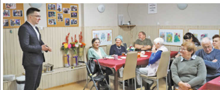
Adresatem dofinansowania jest Powiatowe Centrum Pomocy Rodzinie w Otwocku

– Seniorzy, to wyjątkowi ludzie, od których wszyscy możemy się uczyć, a oni chętnie dzielą się swoim doświadczeniem, sprawiając, że nam żyje się łatwiej. Cieszymy się, że dzięki uzyska-