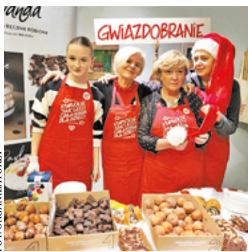
To już 18. edycja akcji charytatywnej

Świąteczny jarmark odbędzie się w niedzielę (8 grudnia) w SP 3 w Józefowie przy ul. Leśnej 39. Zaplanowano kawiarenkę z domowymi wypiekami,