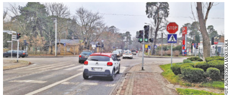
Investycja zakłada montaż nowoczesnej sygnalizacji świetlnej na skrzyżowaniu ul. Kołłątaja z ul. Majową. System będzie wyposażony w czujniki i kamery, które dostosują działanie sygnalizacji do natężenia ruchu

Odcinek, który zostanie przebudowany, rozpoczyna się od mostu na Świdrze i kończy na skrzyżowaniu z ulicą Majową.