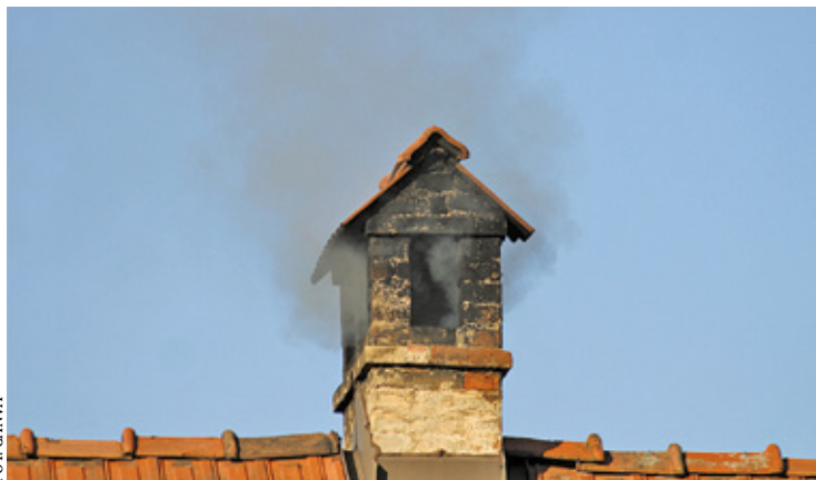
Urzędnicy z Józefowa planują przeprowadzenie minimum 182 kontroli

– Dron nie będzie użytkowany przy wykonywaniu kontroli w 2024 roku. Kontrole w odniesieniu do osób fizycznych, prowadzone są przez przeszkolonych i upoważnionych pracowników gminy oraz straży miejskiej i dotyczą w szczególności wykorzystywanego źródła ciepła lub stosowanego paliwa lub popiołów paleniskowych. Miasto posiada specjalistyczny sprzęt do poboru próbek popiołu. Po ich pobraniu z paleniska próbka popiołu przekazywana jest do specjalistycznego laboratorium w celu weryfikacji czy w danym