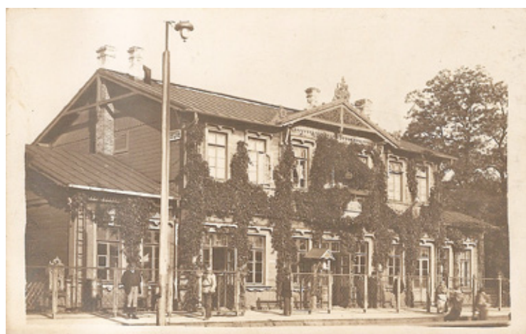
Dworzec kolejowy w Otwocku. Pocztówka z początku XX w.

Od zakończenia wojny, aż do końca lat 50. wydawaniem pocztówek zajmowało się wiele wydawnictw, które często wykorzystywały przedwojenne zdjęcia czy wzory. Kilkadziesiąt różnych wzorów opracowało i wydało grono otwockich i świderskich fotografów. Wśród nich prym wiódł Zakład Fotograficzny Lisowskiego ze Świdra, który specjalizował się w fotografowaniu rzeki oraz obiektów wypoczynkowych. Niestety były one wydawane w niewielkich nakładach, często poniżej 50 egzemplarzy. Ok. 1950 r. nakładem Spółdzielczego Instytutu Wydawniczego „Kraj” z Warszawy (późniejsze Wydawnictwo PTTK „Kraj”) wyszła seria ok. 30 pocztówek z wycinankami ludowymi. Była to seria „Dawna wycinanka podwarszawska” prezentująca jednobarwne wycinanki ludowe z początku XIX w. wytworzone we wsi Świdry (obecnie Świdry Wielkie) i okolicach. Oryginały wycinanek pochodziły ze zbiorów Muzeum Przemysłu w Krakowie.