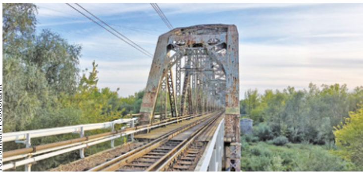
PKP PLK S.A. są za tym, by jedną z kładek technicznych nowego mostu poszerzyć i odpowiednio przekształcić na publiczną, ogólnodostępną kładkę

Most został w 2021 roku wpisany do ewidencji zabytków, ale zbliżająca się modernizacja linii kolejowej nr 12 Skierniewice – Łuków spowodowała, że zarządca infrastruktury złożył pismo w sprawie wykreślenia obiektu z rejestru. Powodem, który podawano, był zły stan techniczny.