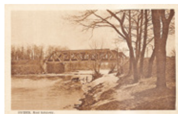
Most kolejowy na Świdrze. Widokówka z okresu międzywojennego