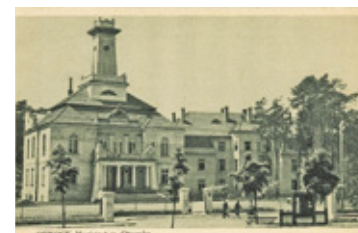
Otwocki magistrat. Widokówka z okresu międzywojennego

Co do przedstawianych widoków na współczesnych widokówkach to nadal dominują takie obiekty jak ratusz miejski, Dom Uzdrowski czyli obecnie LO im. K.I. Gałczyńskiego, dwo-