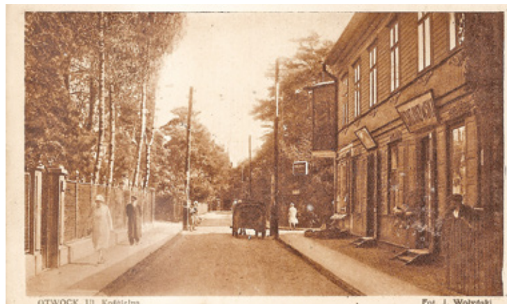
Ulica Kościelna w Otwocku. Widokówka z okresu międzywojennego

Pod koniec lat 50. XX w. zaczęły ukazywać się wielkonakładowe (czasami nawet po 20000 szt.) pocztówki prezentujące walory Otwocka i okolic wydawane przez Biuro Wydawnicze „Ruch” należące do koncernu RSW „Prasa”, przekształcone w 1974 r. w Krajową Agencję Wydawniczą. Przez ponad 30 lat wydawnictwo to zmonopolizowało rynek wydawniczy otwockich pocztówek eliminując innych wydawców. Pocztówki z tego okresu prezentują dosyć wąską gamę tematów. Można na nich zobaczyć widoki centrum miasta w okolicach wybudowanego