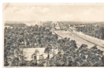
Widok na plant kolejowy z wieży ratusza otwockiego. Widokówka z okresu międzywojennego

Zróżnicowanie wśród wydawców oraz prezentowanych tematów na kartkach powróciła po 1990 r. Dzięki temu zwiększyła się też różnorodność wydawanych pocztówek ale paradoksalnie zmniejszyła się ich dostępność. Związane to było z rozproszeniem wydawców oraz niskimi nakładami pocztówek.