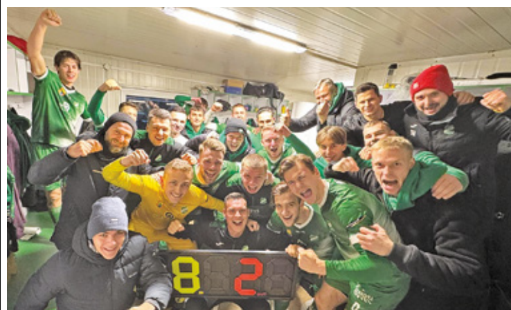
Beniaminek nie ma litości!

7:1, 8:3, 10:1, 8:1, teraz 8:2 – te triumfy naprawdę robią wrażenie! Na tę chwilę Advit zajmuje 3. miejsce w tabeli ligi okręgowej, mając 29 punktów.