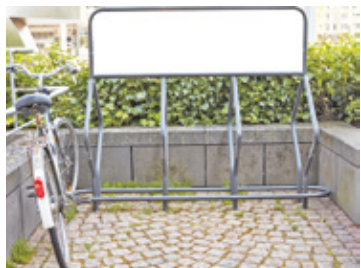
Z wnioskiem o wsparcie zwróciła się Rada Rodziców

Radni podczas sesji zdecydowali o przekazaniu wsparcia dla gminy Kołbiel. Chodzi konkretnie o zakup stojaków na rowery dla szkoły w Kątach.