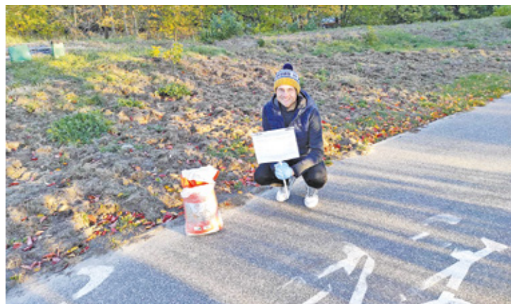
Radni próbują odstraszyć dziki preparatem, rozsypanym na ścieżkach rowerowych

– Na terenie miasta odnotowujemy wzmożoną aktywność dzików. Jest ich po prostu więcej. Nie mają naturalnych wrogów, nie dokuczają im pasożyty. Mogą żerować na miejskich terenach zielonych. Pod koszonymi trawnikami znajduje się mnóstwo pędraków, larw i dżdżownic. Dziki pozyskują pokarm przez buchtowanie, czyli rycie w ziemi. Po takim nocnym obiedzie dzików ziemia wygląda jakby ktoś przekopał