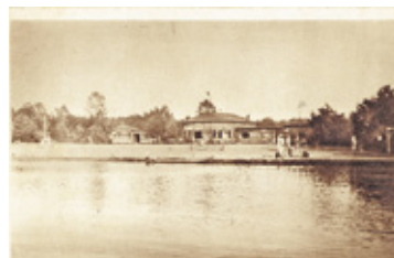
Plaża nad Świdrem. Widokówka z okresu międzywojennego

wanego w 1961 r. Osiedla Rynek i urządzanego Placu XX-lecia PRL (obecnie Plac Niepodległości), rzekę Świdra z okalającą przyrodą i plażami, budynki magistratu, Liceum Ogólnokształcącego (dawny Dom Uzdrowski), Technikum Nukleonowego i Dworca PKP. Do nielicznych należą widokówki pokazujące nowe osiedla mieszkaniowej wzdłuż ulic Andriollego, Sportowej, Poniatońskiego czy Kmicica lub... Instytut Badań Jądrowych (obecnie Narodowe Centrum Badań Jądrowych).