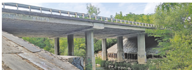
Most nad rzeką Świder, przeznaczony do rozbiórki. W jego miejsce zostanie wybudowany nowy

N a drodze wojewódzkiej nr 801 realizowane były równocześnie dwie inwestycje. Zarówno budowa dwóch mostów na wysokości Otwocka jak i karczewski odcinek Nadwiślanki są już gotowe. Jednak, żeby obiekty były dostępne dla kierowców, musi być wydana przez Wojewódzki Inspektorat Nadzoru Budowlanego decyzja pozwolenia na użytkowanie. Kontrola WINB została już przeprowadzona i odpow-