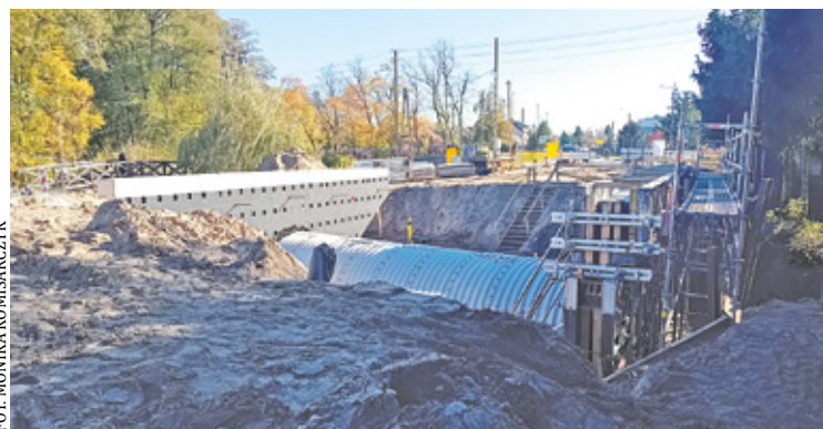
Rzecznik prasowy Starostwa Powiatowego w Otwocku informuje, że prace remontowe mostu na Napoleńskiej są na zaawansowanym etapie

– W najbliższych tygodniach planowane jest zakończenie prac, związa-