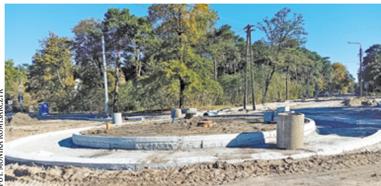
Rondo nabrało już finalnego kształtu – usunięto kolizje infrastrukturalne jak i zrealizowano systemy odwodnienia

go do ul. Tatrzańskiej w Śródborowie. Podczas modernizacji ma powstać nowa nawierzchnia, chodniki i ścieżki