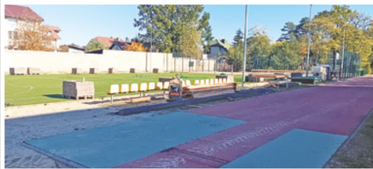
Budowa zadaszona nad boiskiem SP 4 im. Józefa Piłsudskiego

Obecnie na terenie SP nr 2, po wykonanym demontażu i robotach