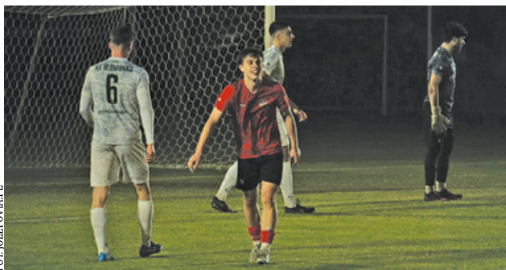
Józefovia miała szansę na komplet punktów