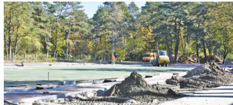
Budowa zadaszona nad boiskiem SP 2 im. Ireny Sendlerowej

fundamentowych rozpoczęto, montaż konstrukcji zadaszona boiska wielofunkcyjnego i jego zaplecza.