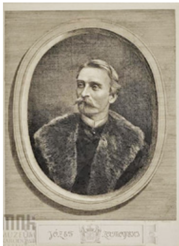
Józef Florian Zamoyski. Portret ze zbiorów Muzeum Narodowego w Krakowie

Na początku XIX w. dobra kołbielskie należały do Chrzanowskich z Rudna, tak jak i całe miasteczko Kołbiel, mocno podupadły. W 1866 r. majątek, liczący ok. 2100 ha, zakupiła rodzina Zamoyskich. Miało to znaczenie dla ogólnej zamożności mieszkańców regionu i przyczyniło się do wykształcenia oryginalnej kultury ludowej, przejawiającej się w budownictwie drewnianym, obrzędach, strojach, tkactwie, wycinankach, muzyce i tańcach.