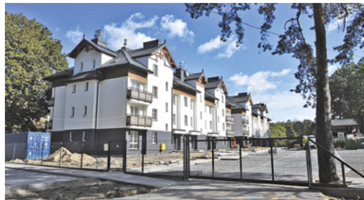
W lokalach wykończono łazienki i częściowo kuchnie

– Już na etapie projektowania inwestycji zadaliśmy, aby dla każdego