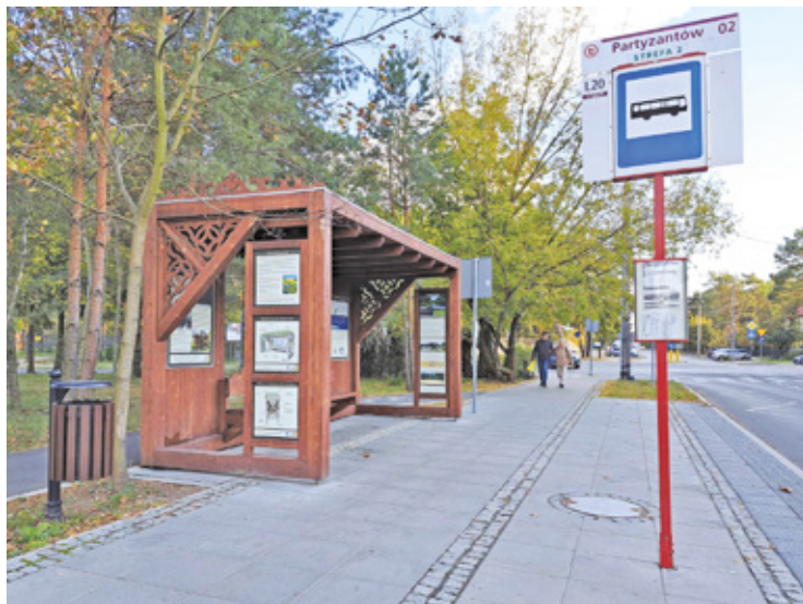
Przystanek M1 i M2 w Otwocku

– Umowa z ZTM Warszawa na linie L obowiązuje do końca lipca 2025 r. i nie ma planów, aby ją przedłużyć. Miasto zamierza przystąpić do Związku