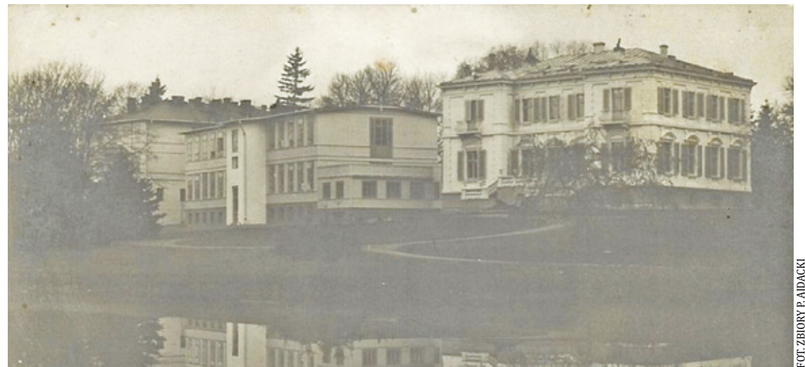
Pałac Zamoyskich w Starej Wsi k. Kołbieli – pocztówka sprzed 1939 r.