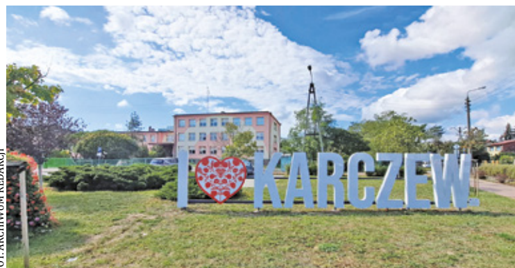
Zostaną zrealizowane cztery zadania, które uzyskają największe poparcie

– Po 2022 r., decyzją większości w poprzedniej Radzie Miejskiej w Karczewie, Budżet Obywatelski de facto przestał funkcjonować. Jako nowa rada chcemy to zmienić i ponownie zorganizować głosowanie, w którym mieszkańcy będą mogli zdecydować, na co chcą przeznaczyć gminne środki w swojej okolicy – powiedział Przewodniczący Rady Miejskiej w Karczewie.