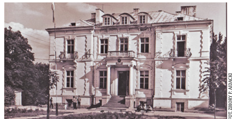
Pałac Zamoyskich w Starej Wsi k. Kołbieli – pocztówka z lat 60. XX w.

ny Instytut Mechaniki Precyzyjnej). Od strony szosy lubelskiej stoi brama wjazdowa, składająca się z dwóch podcieniowych stróżówek, murowana z połowy XIX w. Obecnie mieści się w nich bar „Kordegarda”. Na tyłach pałacu, wśród krzewów stoi osobliwy granitowy obelisk, wystawiony ku czci Józefa hrabiego Zamoyskiego (1835-78) z II połowy XIX w., z napisem: „Józef hr. Zamoyski założyciel postępowego gospodarstwa w Starej Wsi 1866-1878”. Ponadto z dawnego folwarku usytuowanego po drugiej stronie szosy mińskiej można jeszcze zobaczyć murowaną rządówką, stajnie, stajnie zarodowe, obory ze spichlerzami, czworaki, piwnice, dawny młyn mechaniczny, wszystko z XIX w. Po 1945 r. zabudowania były wykorzystywane przez PGR i Zakład Produkcji Doświadczalnej Instytutu Mechaniki Precyzyjnej. Obecnie pałac wraz z parkiem są własnością prywatną, w zabudowaniach folwarku znajdują się mieszkania prywatne, oraz liczne drob-