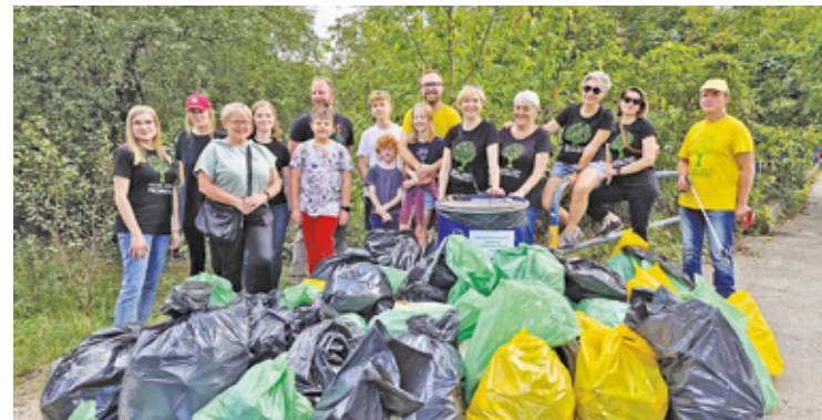
Akcja zakończyła się ogromnym sukcesem dzięki zaangażowaniu około 70 uczestników

Podczas wydarzenia zebrano około 70 worków śmieci, które znajdowały