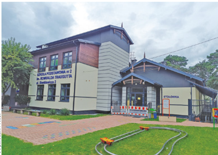
Burmistrz miał już spotkanie z rodzicami. Wcześniej wizytował budynek Miejskiego Przedszkola nr 2 przy ul. Wyszyńskiego, gdzie przeniesiona została 25-osobowa grupa 6-latków z SP2

Przypomnijmy, że do pożaru doszło w maju tego roku. Zapalił się dach stołówki przylegającej do budynku szkoły. Uczniowie zostali natychmiast ewakuowani, a na miejscu pracowało 60 strażaków z jednostek PSP w Otwocku oraz Ochotniczych Straży Pożarnych. Nikomu nic się nie stało. Dzieci