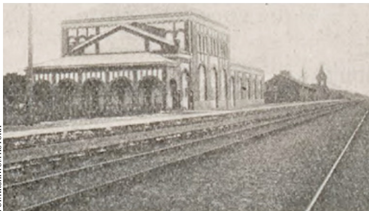
Stacja Falenica budynek dworca wzniesiony w latach 1915-16

W 1897 r. Kolej Nadwiślańska została upaństwowiona. W myśl wydanych wówczas przepisów, szereg dotychczas odrębnych kolei, w tym i Nadwiślańska zostały połączone w