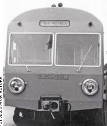
Tablica kierunkowa W-wa Falenica na czole EZT EW58 – wystawa kolejowa podczas Międzynarodowych Targów Poznańskich w l. 70 ubiegłego wieku

i połowych) na wschód od Warszawy (tzw. Bruckenkopf Warschau) dużego znaczenia nabrała faleniccka stacja. Wzniesiono wtedy duży, murowany z czerwonej cegły budynek dworcowy (z kasami biletowymi, poczekalnią, bufetem i wieżą obserwacyjną), murowany budynek łaźni-szaletu oraz dwóch, murowanych z cegły budynków koszarowych dla szeregowych żołnierzy (ul. Patriotów 50A) i oficerów (ul. Patriotów 32A). Wszystkie te nowe budynki architektonicznie nawiązywały do klasycznego pruskiego stylu budownictwa kolejowego. Po rozbudowie stacja stała się ważnym elementem infrastruktury wojskowej wykorzystywanym przez