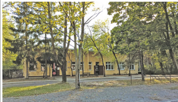
Obiekt stoi pusty nie wiadomo czy i co tu powstanie

– W związku z przeniesieniem Przychodni z ul. Batorego na ul. Armii