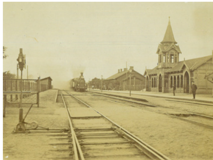
Stacja Falenica na zdjęciu z 1915 r.

Lokalizacja stacji okazała się tymczasowa. Już w latach 1905-1910 rozpoczęto modernizację Warszawskiego Węzła Kolejowego. W ramach tych prac m.in. dobudowano drugi tor z Warszawy do Otwocka oraz wzniesiono charakterystyczne, drewniane budynki stacyjne z wieżyczkami w Radości, Falenicach, Józefowie i Świdrze oraz okazały budynek dworcowy w Otwocku. W tym też czasie faleniccka stacja została przeniesiona w dzisiejszą lokalizację w re-