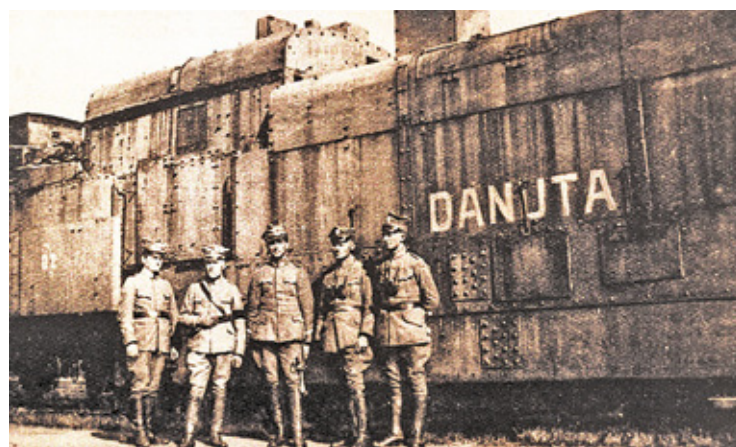
Pociąg pancerny Danuta – zdjęcie z okresu wojny 1920 r.

jon ulic Patriotów, Bysławskiej, Młodej i Walcowniczej. Pierwszą mapą wskazującą obecne położenie stacji w Falenicach jest niemiecka mapa topograficzna KdWR arkusz H33 Warschau-Sued w skali 1:100000 z 1915 r.