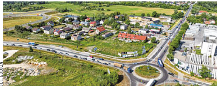
W najbliższym czasie wykonawca będzie musiał przeprowadzić rozpoznanie saperskie, inwentaryzację i wytyczenie geodezyjne

– Nowa droga klasy GP będzie posiadała dwie jezdnie z dwoma pasami ruchu. Wybudowane zostaną obiek-