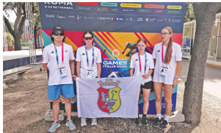
Otwockcy sportowcy zmierzyli się z najlepszymi zawodnikami na świecie

Na ten moment Mazur znajduje się na 5. miejscu w tabeli V Ligi, mając tyle samo oczek co Promna i Energia Kozienice. Strata do lidera – Ożarów