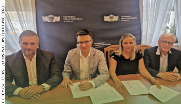
W planach remontowych jest wymiana nawierzchni na dwóch odcinkach o łącznej długości blisko 2 kilometrów

Umowę podpisano w czwartek (5 września) w Urzędzie Wojewódzkim.