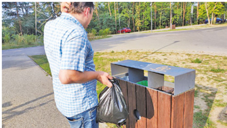
Niekiedy trudno jest zdecydować, do którego pojemnika należy wrzucić śmieci...

Od dłuższego czasu w serwisach „Sklep Play” oraz „App Store” jest dostępna aplikacja mobilna mMieszkaniec. Dzięki niej użytkownicy mogą