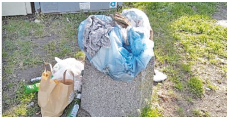
Na fanpage urzędu, pojawiło się kilka zdjęć dokumentujących wysypujące się z koszy miejskich torby i worki ze śmieciami

Drodzy mieszkańcy, ponownie przypominamy, że Gmina Celestynów dba o czystość i porządek na terenie wszystkich miejscowości, zapewniając systematyczny wywóz odpadów z koszy ulicznych. Niestety kosze uliczne mimo częstych odbiorów odpadów są przepełniane odpadami pochodzącymi z gospodarstw domowych! Każdy mieszkaniec ma obowiązek złożenia