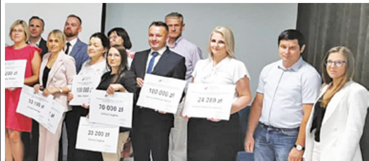
Tym razem za papierowymi czekami mają popłynąć realne pieniądze

Drugie dofinansowanie przeznaczone jest na zakup średniego samochodu ratowniczo-gaśniczego z pełnym wy-