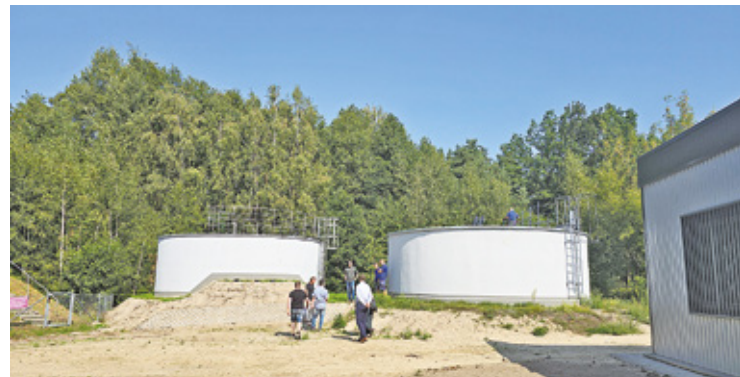
Stacja już działa – mieszkańcy powinni odczuć poprawę jakościową i ilościową

– Woda z rozbudowanej i bardziej wydajnej stacji została wprowadzona już do obiegu. Co najważniejsze inwestycja rozwiąże kluczowy problem zaopatrzenia mieszkańców w rejonu stacji w wodę do picia w odpowiedniej ilości i jakości, a także zakładów produkcyjnych – podkreślił urząd.