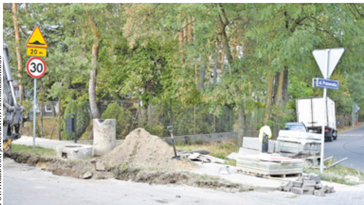
Utrudnień nie da się uniknąć przynajmniej do końca października. Remontu doczekają się też chodniki

– Mimo tymczasowych utrudnień i niedogodności, jakie wystąpią na ul. Okrzei podczas prowadzonych przez wykonawcę robót, należy mieć na uwadze, że po zakończeniu remontu, poprawi się bezpieczeństwo i komfort jazdy użytkowników tej drogi. Dlatego proszę mieszkańców o wyrozumiałość i w miarę możliwości wybór alternatywnych tras na czas realizowanych prac