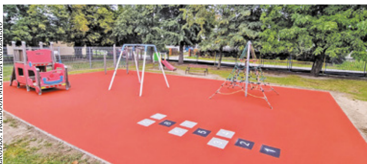
W nowym roku szkolnym dzieci z SP w Glinkach będą się bawić w komfortowych warunkach

Pod koniec lipca podpisano natomiast umowę na remont sali gimnastycznej w Szkole Podstawowej nr 1 w Karczewie. Kompleksowa modernizacja obejmie dach, podłogę na antresoli, oświetlenie, a także cyklinowanie parkietu, odnowienie ścian wewnętrznych, drabinek, czy też wymianę urządzeń do gry zespołowej. Koszt inwestycji, to blisko 760 tys. zł, z czego niemal 300 tys. zł pozyskano z Sejmiku Województwa Mazowieckiego. Prace trwają, a zakończenie planowane jest na koniec września.