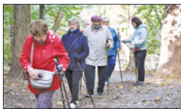
||| Celestynów - Doczekają się klubu? s. 4