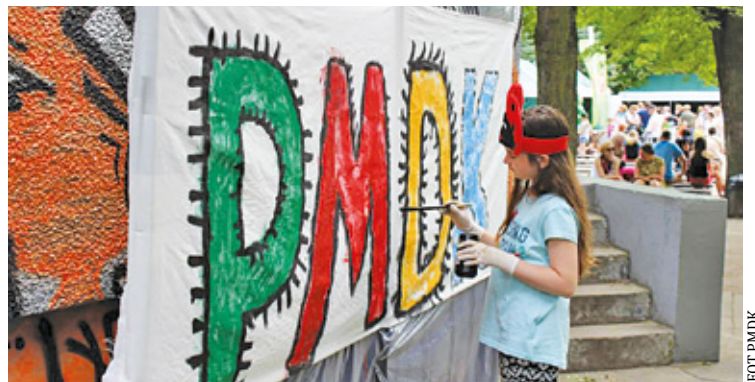
Nową atrakcją na pikniku będzie mobilne planetarium z Centrum Nauki Kopernik

Jedną z tegorocznych nowości będzie Planetobus, mobilne planetarium