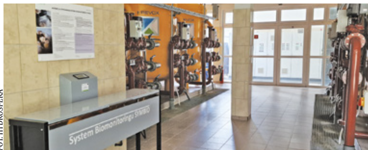
Nowoczesny system biomonitoringu dba o jakość wody

Ludzie mają obawy przed piciem wody z kranu – wielu uważa, że lepsza jest woda z przydomowej studni, inni ufają tylko wodzie butelkowanej. Staramy się zmieniać te przyzwyczajenia organizując akcje edukacyjne i uświadamiając mieszkańcom, że kranówka jest znakomitej jakości, smaczna i można ją pić bez żadnych obaw. Do tego takie działanie jest bardzo proekologiczne, przyczyniając się znacząco do ograniczenia powstawania odpadów plastikowych.