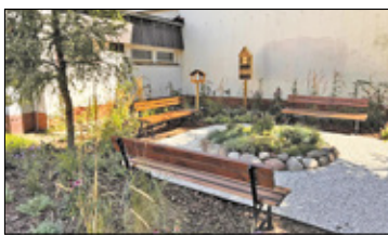
||| Otwock - Edukacyjny ogródek w „4” s. 3