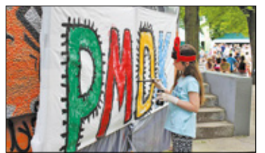
||| Otwock - Planetobus na pikniku s. 5