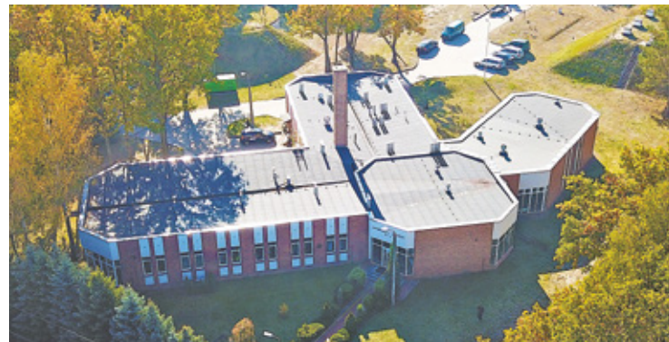
Stacja uzdatniania wody w Józefowie – widok z lotu ptaka

W jaki sposób kontrolujecie jakość wody włączanej do sieci wodociągowej?