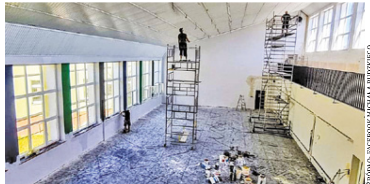
Na nową salę jeszcze przyjdzie chwilę poczekać – SP 1 w Karczewie

– W najbliższych tygodniach rozpocznie się modernizacja placu zabaw w Łukówcu i Kępie Nadbrzeskiej. W najbliższym czasie ruszymy również z modernizacją nawierzchni na placu zabaw przy Zespole Szkolno-Przedszkolnym w Sobiekursku. Pracujemy również nad ogłoszeniem przetargu na budowę parku trampolin między Osiedlem Ługi a Osiedlem Zagóry w