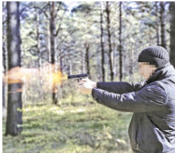
39-latek przyznał, że palił marihuanę, a pistolet gazowy służył mu do rekreacyjnego strzelania w lesie

Funkcjonariusze zatrzymali 39-letniego kierowcę chevroleta. Podczas przeszukania auta znaleziono m.in. pistolet gazowy, ale mężczyzna został zatrzymany z innego powodu.