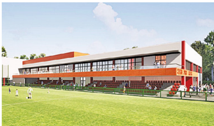
Budowa Centrum Sportu i Rekreacji to ogromna i bardzo kosztowna inwestycja, która przekroczy pierwotne szacunki ponad 63 mln zł

Pod koniec 2021 roku gmina zapewniała, że dokumentacja projektowa powstanie za rok, czyli do końca 2022 roku. Niestety, projekt utknął w martwym punkcie. Zapytaliśmy urząd gminy m.in. o to, na jakim etapie jest realizacja planowanej inwestycji, czy jest już dokumentacja projektowa i co dokładnie ma powstać w ramach budowy nowoczesnego kompleksu sportowego. – Inwestycja miałaby być podzielona na trzy etapy, a ich realizacja zajmie kilka lat. W pierwszym etapie powstałby budynek główny wraz z