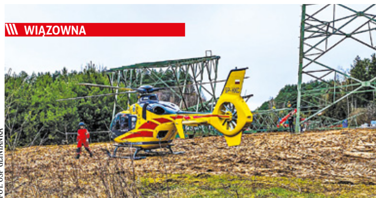
W sytuacji, gdy karetka pogotowia nie może dotrzeć na czas do chorego, na miejsce wezwany jest śmigłowiec LPR

/// Celestynów - Seria aktów wandalizm s. 5