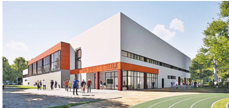
Inwestycja będzie podzielona na etapy, których realizacja zajmie kilka lat

Gmina od lat inwestuje w rozwój aktywności fizycznej mieszkańców i, mimo że sztandarową imprezą sportową od wielu lat jest Półmaraton Wiązowski, to mieszkańcy marzą