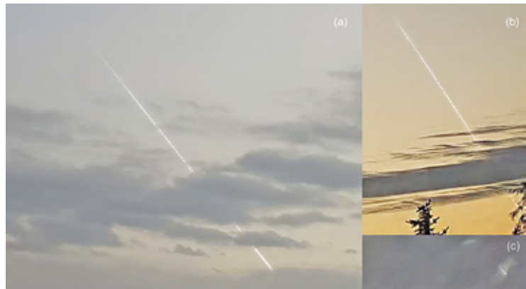
Zarejestrowana trajektoria lotu bolidu

NCBJ w Świerku wyjaśnia: – Obliczenia czeskich badaczy wskazywały, że sfilmowany meteoroid poruszał się po rzadko spotykanej orbicie eliptycznej mieszczącej się między Wenus a Marsem. W ziemską atmosferę wszedł nad Polską, około 130 km od granicy z Czechami. Najwcześniej zauważono