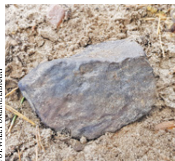
W przypadku meteoroidu z Antonina udało się poznać jego nietypową orbitę, zarejestrować przebieg spadku i odnaleźć fragment, którego kosmiczne pochodzenie potwierdzono w laboratoriach w Świerku

go na wysokości 74 km. Poruszał się wtedy z prędkością niemal 18 km/s – tłumaczy Zbigniew Tymiński z NCBJ w Świerku. – Podczas hamowania, tak gwałtownie kompresował przed sobą powietrze, że rozgrzało się ono do temperatury kilku tysięcy stopni. Utworzona plazma zaczęła odparowywać powierzchnię obiektu i ją topić. Do fragmentacji doszło na wysokości około 40 km. Cały ślad pozostawiony na niebie miał długość 62 km i urywał się na wysokości 23 km, gdy prędkość meteoroidu zmalała do 13 km/s – podkreślają naukowcy z narodowego centrum badań w Otwocku.