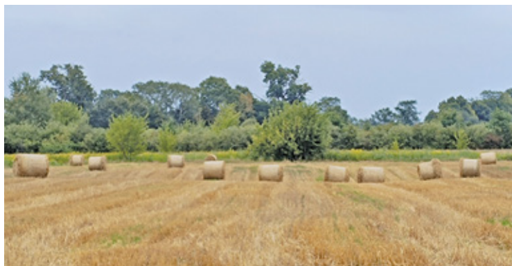
Zachowaj ostrożność podczas prac na polu

Warto pamiętać o tym, że nie każdy może pracować na wysokości,