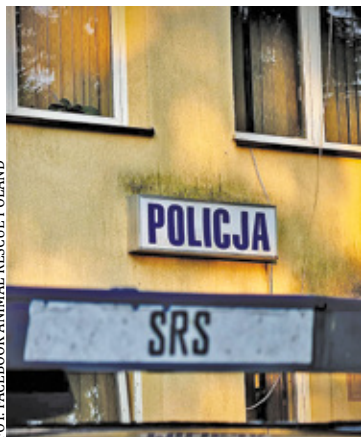
Podczas operacji mundurowi weszli do 15 mieszkań na terenie Warszawy i okolicznych powiatów