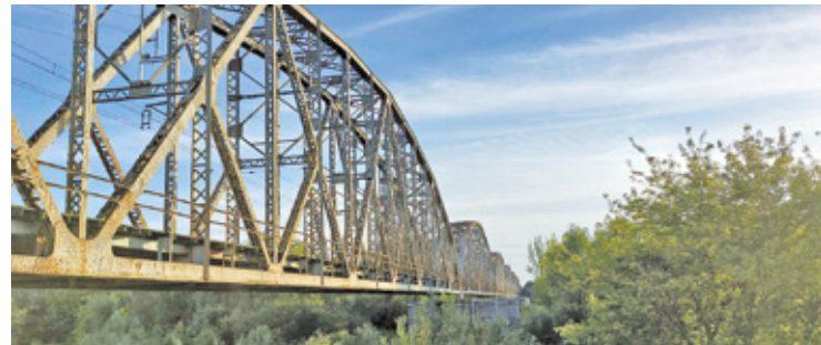
Na kładkę czekają zarówno mieszkańcy, jak i turyści