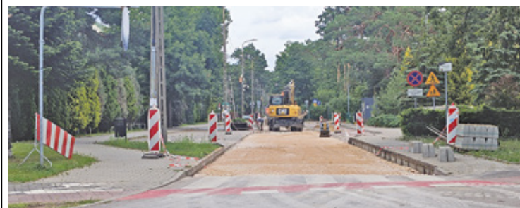
Utrudnienia na ul. Długiej

Modernizacja dwóch józefowskich ulic jest częścią większego planu poprawy infrastruktury drogowej w Józefowie. Nowa nawierzchnia znacząco zwiększy komfort i bezpieczeństwo użytkowników dróg. Jednakże inwestycja, jak każda tego typu, wiąże się z pewnymi niedogodnościami. Najważniejsze z nich to czasowe zamknięcie