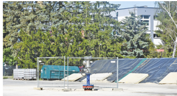
Miejsce odwiertów geotermalnych