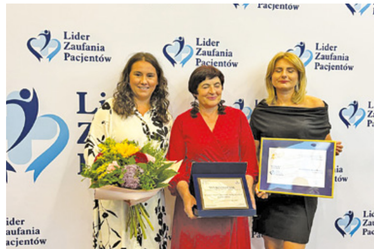
Przedstawicielki SPZOZ Józefów

Obsługa pacjenta stanowi fundament każdej placówki medycznej. Wysoka jakość obsługi wpływa na zaufanie pacjentów oraz ich lojalność. Program „Lider Zaufania Pacjentów” podkreśla, że to pacjent jest najważniejszym elementem w systemie ochrony zdrowia, a dzięki zastosowaniu metody Tajem-