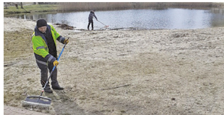
Prace porządkowe w terenie

Pomoc osobom zagrożonym wykluczeniem społecznym jest niezmiernie ważna. Projekty takie jak Spółdzielnia Socjalna „Odmiana” pokazują, jak istotne jest tworzenie przestrzeni, gdzie każdy może znaleźć wsparcie i szansę na lepsze życie. Poprzez oferowanie pracy „Odmiana” pomaga w budowaniu bardziej zintegrowanej i solidarnej społeczności, w której nikt nie jest pozostawiony sam sobie.