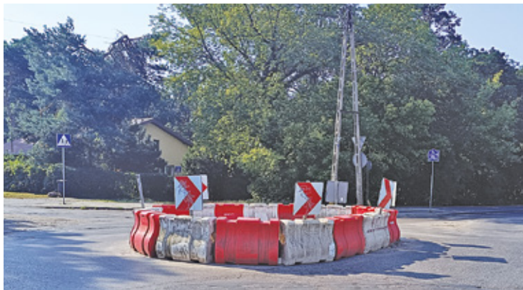
Już wkrótce modernizacja ronda na ul. Reymonta

Projekt obejmuje przebudowę odcinka ul. Reymonta od ul. Żeromskiego do ul. Tatrzyskiej. Kluczowym