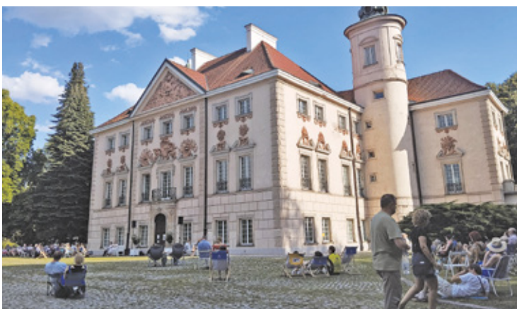
„Klasyka na leżakach” w Otwocku Wielkim

Koncerty promenadowe oferują możliwość słuchania muzyki klasycznej,