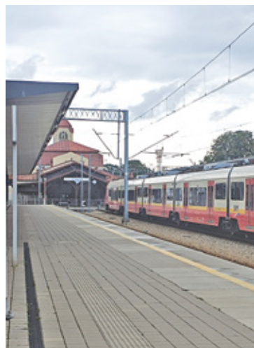
Przebudowa torowisk na trasie Wawer – Otwock

Planowana jest dobudowa dwóch dodatkowych torów, co umożliwi rozdzielenie ruchu pociągów aglomeracyjnych i dalekobieżnych. Dzięki temu