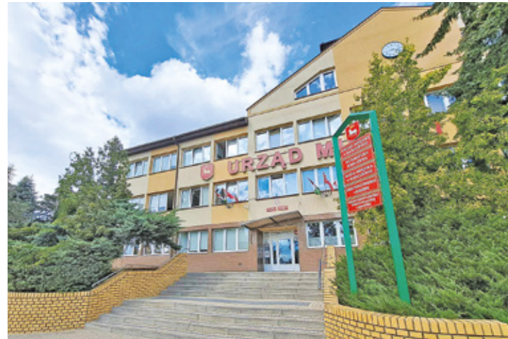
Do Urzędu Miejskiego w Karczewie interesanci przychodzą z przyjemnością

– Najczęściej komentujemy rzeczy, które denerwują nas jako mieszkań-