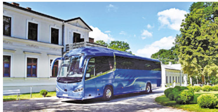
Już wkrótce modernizacja ronda na ul. Reymonta

Nowy przystanek na linii W1 i W2 umożliwi pasażerom dogodną przesiadkę do autobusów linii 146, 213 i 702.