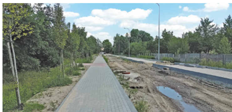
Zakończenie inwestycji przyniesie mieszkańcom wiele ulepszeń i udogodnień

– Inwestycja jest w trakcie. Prace wykonywane są zgodnie z harmonogramem, termin wykonania inwestycji nie jest zagrożony. Zakończenie inwestycji przyniesie mieszkańcom Gminy Karczew wiele ulepszeń i udogodnień.