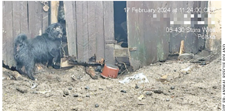
Pies przykuty był do rozlatującej się drewnitni

Pies przykuty był do rozlatującej się drewnitni. Po odebraniu od właściciela Żużel trafił do Schroniska dla