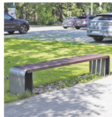
Obecnie ławek jest około 50

– Oczywiście, w Józefowie są ławki. Obecnie jest ich około 50. Tak, sukcesywnie dostawiamy kolejne ławki. W tym roku pojawi się ich 20, a jest