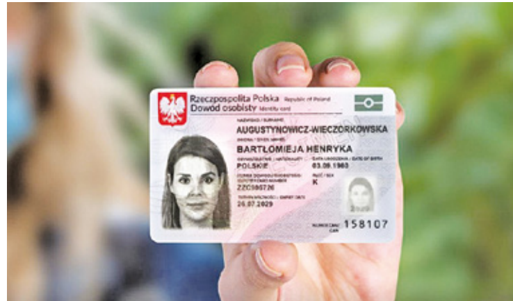
Dodatkowa ochrona przed oszustami może być bardzo przydatna

Usługa zastrzeżenia PESEL jest całkowicie darmowa. Każdy może za-