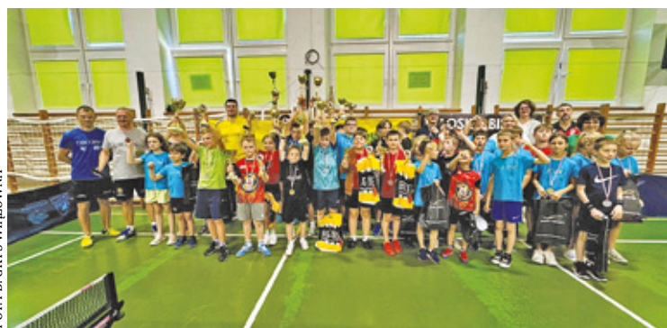
Uczestnicy turnieju w Wiązownie