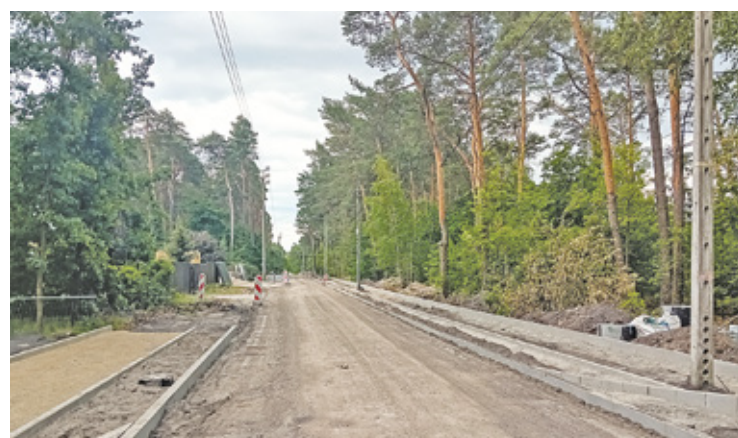
Wśród robót zaplanowano m.in. budowę chodnika i ścieżki rowerowej

– Po wykonaniu prac na wskazanym odcinku ul. Andriollego znacząco poprawi się bezpieczeństwo i walory użytkowe dla turystów i rowerzystów, a jedna z najdłuższych ulic w mieście