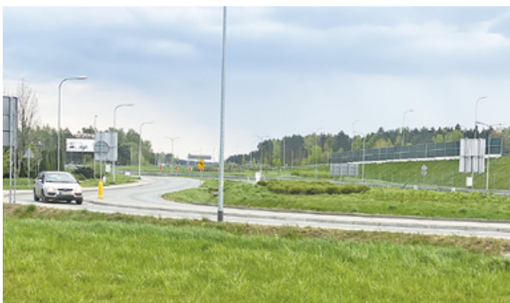
Wyniki pomiaru nie przekroczyły norm hałasu przewidzianych polskim prawem

/// Kraj - Konsekwencje zastrzeżenia numeru PESEL s. 4