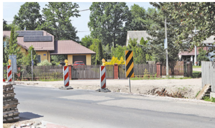
Ostatnie szlify na remontowanej drodze mogą wprowadzić niewielkie utrudnienia dla kierowców

– Rozbudowa drogi powiatowej Nr 2709W w miejscowości Żanęcin dobie-