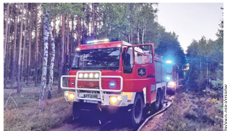
Pożar młdnika w Karczewie gasiło 40 jednostek straży pożarnej

D ruga połowa maja nie była łaskawa dla strażaków. Przypomnijmy, że w czwartek 16 maja musieli się oni mierzyć z pożarem lasu w Karczewie, którego gaszenie zajęło im kilka godzin. Na miejscu pracowało aż 30 jednostek oraz samolot gaśniczy. Niestety, mimo walki z żywiołem, spłonęło około 5 hektarów lasu.