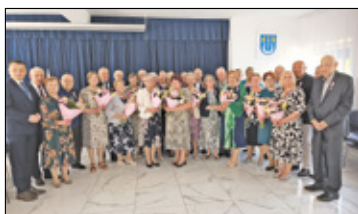
/// Sobienie-Jeziory - Złote gody s. 2

CELESTYNÓW /// JÓZEFÓW /// KARCEW /// KOŁBIEL /// OSIECK /// OTWOCK /// SOBIENIE-JEZIORY /// WIĄZOWNA /// WAWER