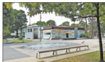
/// Józefów - Kino pod gwiazdami s. 4