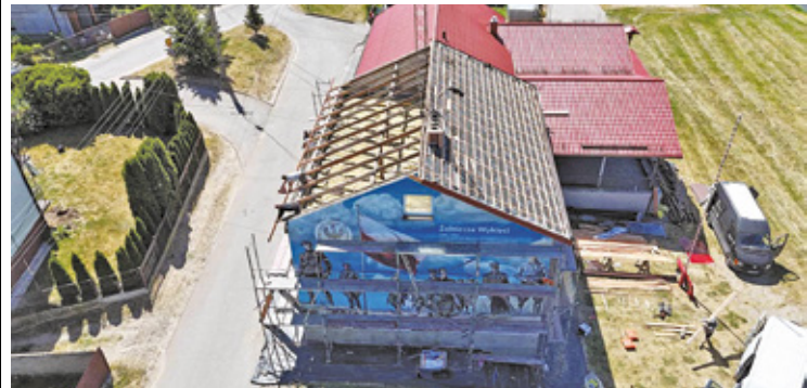
Widok z drona na remontowaną świetlicę

– Na całe szczęście, jak do tej pory, mural nie ucierpiał i nie został uszkodzony, może dlatego, że cały budynek jest monitorowany, a jedna z kamer centralnie „pilnuje” ściany z murem. Po prostu w okresie jego powstawania