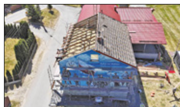
/// Dziecinów - Remont świetlicy s. 4