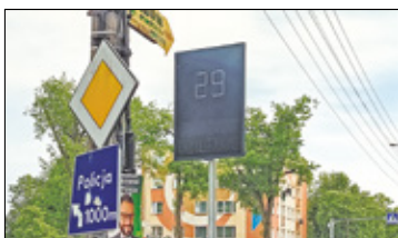
/// Otwock - Aktywne przejścia dla pieszych s. 2