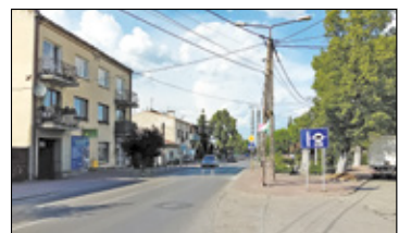
/// Karczew - Remont ul. Mickiewicza s. 5

PÓŁKOLONIE w Twojej okolicy - idealny wybór na wakacje dla dzieci sprawdź na str. 8