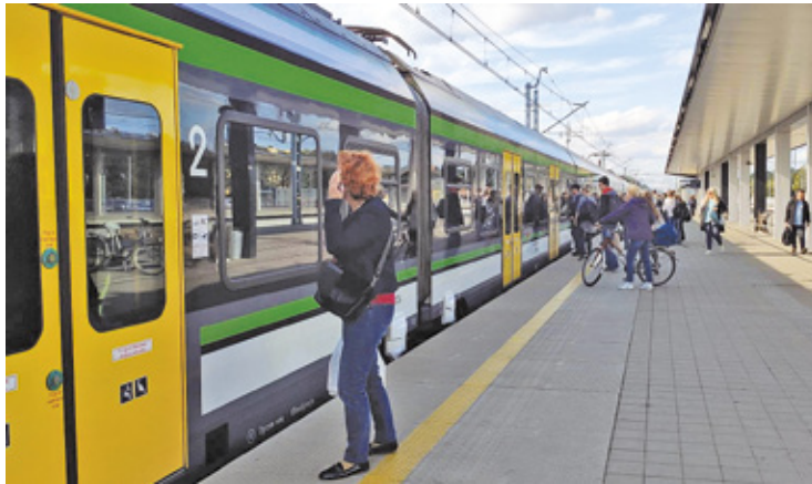
Mieszkańcy powiatu otwockiego coraz częściej decydują się na Bilet Metropolitalny

Kilka dni temu PKP Intercity podniosła ceny biletów i to w znaczny sposób, używając tych samych argumentów, jakie są podkreślane w przypadku innych podwyżek dotyczących wzrost cen energii, inflacji i rosnących stóp procentowych. – Najważniejszym powodem, dla którego jesteśmy zmuszeni zmienić ceny i dostosować je do realiów rynkowych jest bardzo duży wzrost cen energii, które są spowodowane m.in. rosyjską agresją na Ukrainę – tłumaczy PKP Intercity decyzję dot. podwyżki cen biletów. I wyjaśnia w specjalnym komunikacie, że w porównaniu do stycznia 2022 roku cena energii elektrycznej na Towarowej Giełdzie Energii wzrosła aż o 62,18%. Przełoży się to