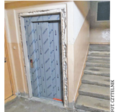
Mieszkańcy bloku przy ul. Bema 4 cieszą się z nowych wind. W ciągu trzech miesięcy zostaną zamontowane pozostałe dźwigi osobowe w bloku pod numerem 2 i 6

Przetarg na wymianę łącznie 10 dźwigów osobowych w kilku klatkach schodowych OSM ogłosiło w 2022 roku. Najlepszą ofertę złożyła Fabryka Urządzeń Dźwigowych w Bołocinie, z którą zarząd OSM podpisał umowę w czerwcu 2022 r. – Prace przy ul. Bema