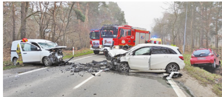
W środę rano zderzyły się czołowo dwie osobówki, a trzeci samochód wpadł do przydrożnego rowu