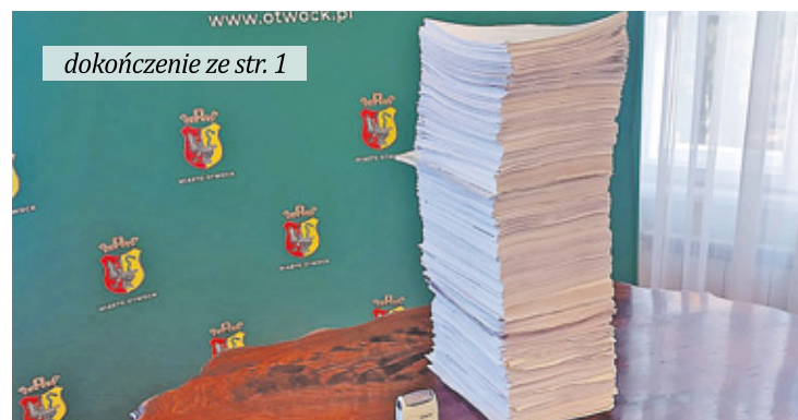
Pozew, który trafił do sądu, liczy 129 stron. Natomiast na batalię sądową miasto przygotowało także ponad 180 załączników, które zawierają ponad 1000 stron

Przygotowanie pozwu wymagało od urzędników determinacji i odszukania w archiwach ogromnej ilości dokumentów sprzed trzech dekad. Kluczowe dla sprawy było przyjęcie uchwały przez Radę Miasta Otwocka