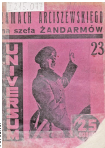
Okładka książki W. Kaliski „Zamach Arciszewskiego na szefa żandarmów” z 1927 r.

strzeżony przez ukrytych strażników. Zdarzało się, że przechodzień, który się zatrzymał przy ogrodzeniu lub bramie, był legitymowany, strażnicy wyrastali nagle jak spod ziemi. Obserwacja domu była trudna, wejście niemożliwe.