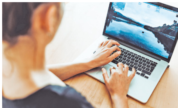
Na zmianie przepisów skorzystają samozatrudnieni z różnych branż

Problem ten dotyczy nawet kilka milionów osób, które pracują, ale nie mają umów o pracę.