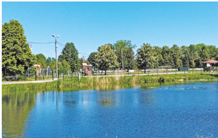
Teren wokół Jeziora Moczydło ma ogromny potencjał

– Opracowanie zaprezentowało zagospodarowanie terenu wokół Jeziora Moczydło w Karczewie wraz z przedstawieniem kontekstu tego zagospodarowania, czyli potencjalnych możliwości z propozycją zagospodarowania działek sąsiednich o charakterze sportowo-rekreacyjnym z usługami sportu i rekreacji. Celem, jaki przyświecał władzom Gminy Karczew przy opracowaniu koncepcji, było uatrakcyjnienie istniejącego terenu zielonego, którego zagospodarowanie pozytywnie wpłynie na: jakość środowiska, bezpieczeństwo użytkowników plaży miejskiej i jej otoczenia, atrakcyjność tego terenu tak