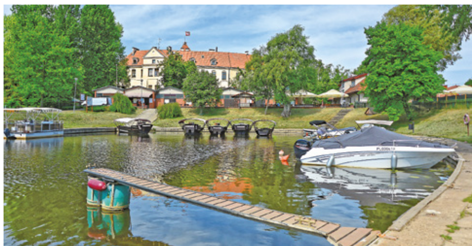
fol. arch. UMWM

4 km na południe od Sadownego czeka na nas krainą obrazowa atrakcja: torfowisko „Kules” i pobliska piaszczyzna wydma. Rozległe torfowisko, najpiękniej wygląda w czasie kwitnienia welnika. Wokół torfowiska jest ścieżka ze znakami i tablicami.