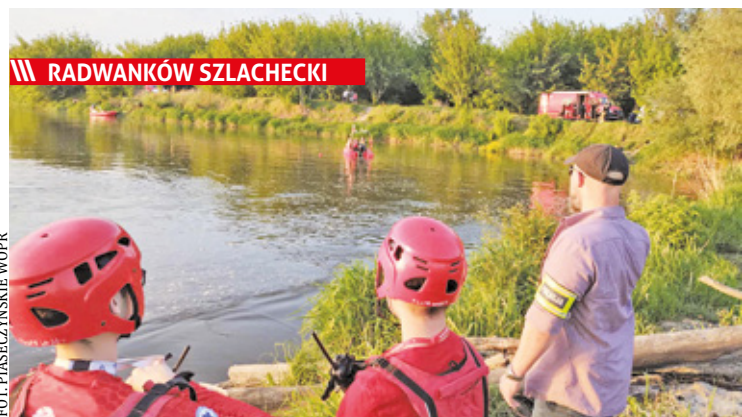
Okoliczności wypadku bada Prokuratura Rejonowa w Garwolinie

/// Karczew - Sezon promowy otwarty! s. 5