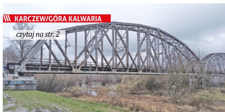
Pomysł ścieżki pieszo-rowerowej powstał w związku z modernizacją linii kolejowej