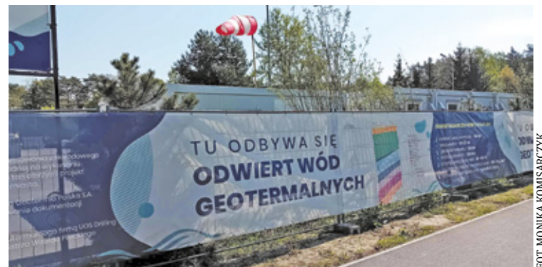
Temperatura wody osiągnięta na wypływie otworu wynosi 40,3 st.