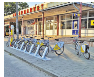
Stacja rowerów przy parku miejskim