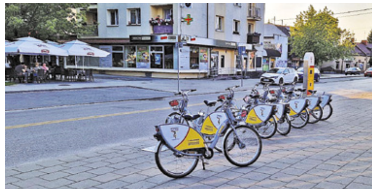
Stacja wypożyczalni rowerów w centrum Otwocka

– Zasady użytkowania pozostają takie same, jak rok wcześniej. Rowery można wypożyczać przez aplikację mobilną, terminal albo kontakt z Biurem Obsługi Klienta Otwockiego Roweru Miejskiego. Wszystkie jednoślady są wyposażone w GPS, mają też blokadę o-lock na tylnym kole roweru, bez której zamknięcia nie można zakończyć wypożyczenia – tłumaczy operator. – W tym roku dochodzi jednak integracja z Józefowem. W obu miastach będzie można wzajemnie korzystać z systemu; to oznacza, że rowery wypożyczone w Otwocku można zwrócić w Józefowie i na odwrót – dodaje.