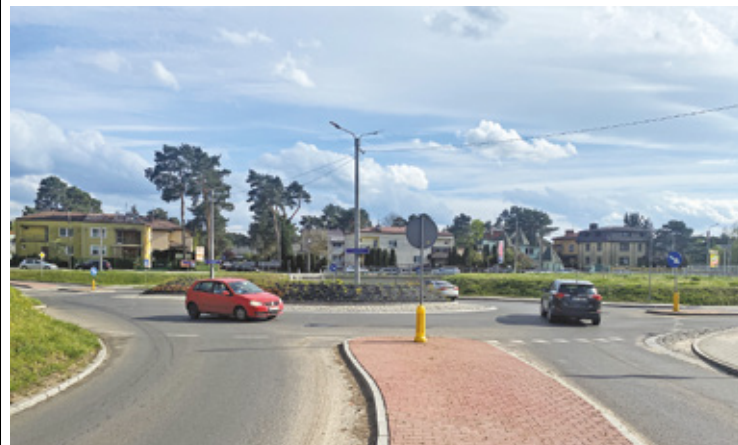
Oficjalne otwarcie, otwartego już ronda odbyło się w zeszłym tygodniu

– Aleksandra Piłsudska stojąca zawsze w pierwszym szeregu na straży wolnej Polski, zmuszona do emigracji ze zniewolonej po raz kolejny ojczyzny