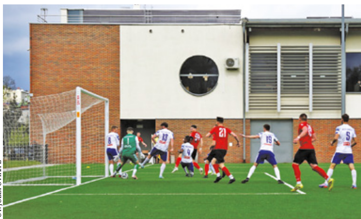
Józefovia bije rekordy zwycięstw