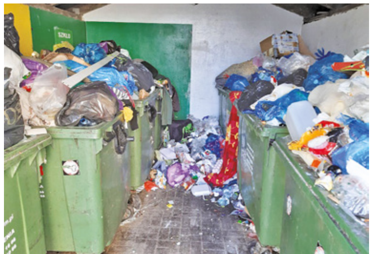
W altanach śmietnikowych zaczęły gromadzić się góry śmieci