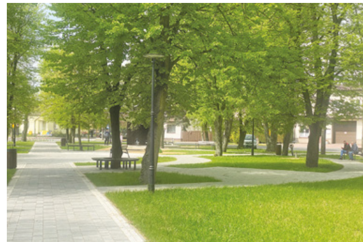
Zmodernizowany skwer zdobi centrum Sobień-Jezior

– W wyniku realizacji projektu istniejący skwer został zmodernizowany, podniesione zostały jego walory estetyczne i funkcjonalne, a w 2023 r. na terenie skweru powstała tężnia solankowa wraz z niezbędną infrastrukturą – czytamy w Serwisie Samorządowym PAP. – Inwestycję Gmina Sobienie-Jeziory zrealizowała w ramach poddziałania 19.2 „Wsparcie na wdrażanie operacji w ramach strategii rozwoju lokalnego kierowanego przez społeczność” objętego Programem Rozwoju Obszarów Wiejskich na lata 2014-2020. Dofinansowanie zostało pozy-