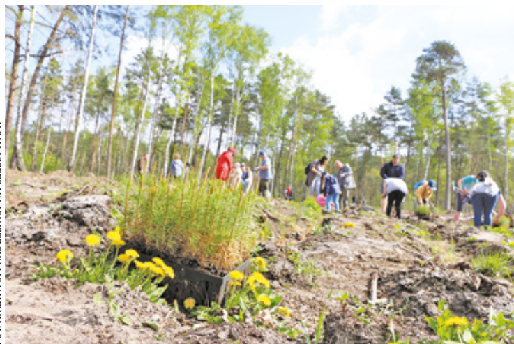
Tylko w tym roku mieszkańcy w ramach akcji posadzili 12 000 drzew

– Wiosna to dla leśników czas bardzo intensywnych prac odnowieniowych. Co roku w Nadleśnictwie Celestynów sadzimy kilkaset tysięcy młodych drzew. Otwarte sadzenie lasu ma charakter edukacyjny. Podczas spotkania uczestnicy dowiedzą się, jak prawidłowo sadzić drzewa oraz na czym polega praca leśnika – czytamy w zaproszeniu na akcję.