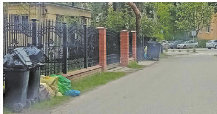
Przy posesjach zabrakło miejsca w pojemnikach na odpady

– W pierwszej kolejności uprzątnięte zostaną altany śmietnikowe na