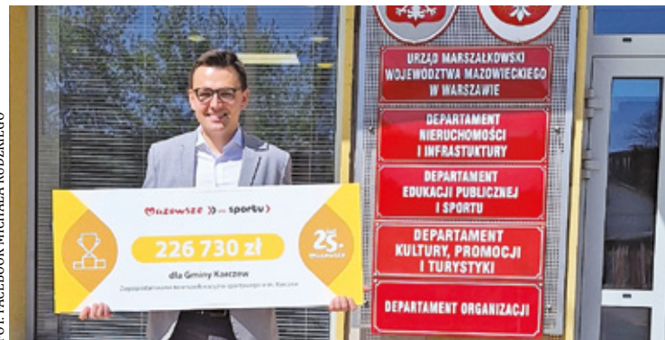
W ramach projektu powstanie park trampolin oraz chodniki, ławki, stojaki na rowery i śmietniki