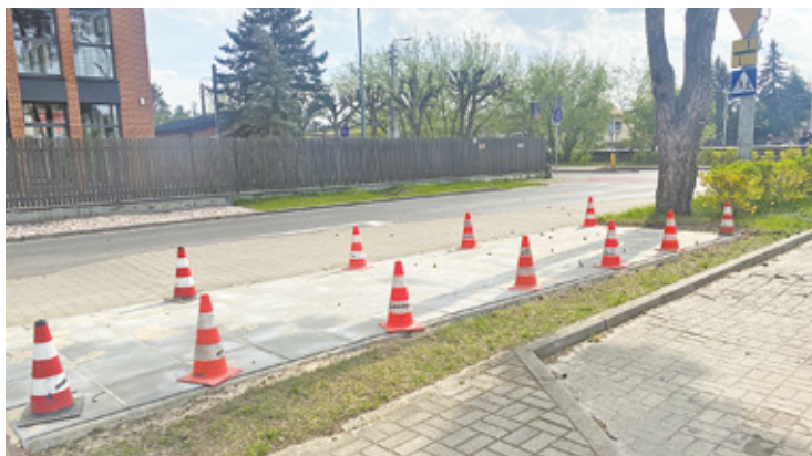
Na skrzyżowaniu Willowej z Sikorskiego przygotowane są już miejsca

– Po przekroczeniu czasu bezpłatnego korzystania z roweru, opłaty za