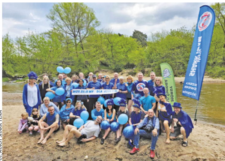
Niedzielną akcją morsów przyciągnęła spore grono zainteresowanych

– Nasza grupa aktywnie chce się angażować w każdą akcję, która ma na celu propagowanie czegoś dobrego. Możemy wspierać każdą akcję i inicjatywę. Lubimy łączyć ludzi i pokazywać, że jeszcze dobrzy ludzie są na świecie