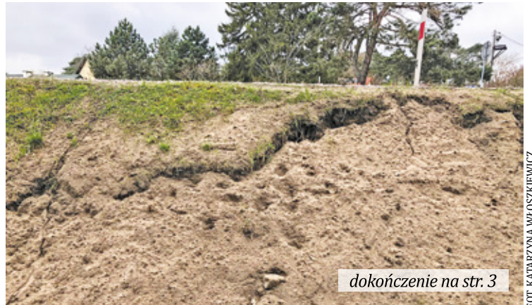
Skarpa na ul. Wiązowskiej wzbudza wiele emocji wśród mieszkańców

- Ziemia pęka, codziennie coraz gorzej to wygląda i jest niebezpiecznie. Szkoda, bo Wiązowska była remonto-