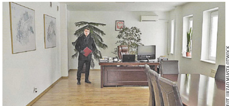
Prezydent pokazuje 60-metrowy gabinet, w którym przez lata urzędował ówczesny prezes spółki

O zakończonym procesie i prawomocnym wyroku byłej głównej księgowej Otwockiego Przedsiębiorstwa Wodociągów i Kanalizacji poinformował w komunikacie Urząd Miasta w Otwocku. Proces dotyczył zdarzeń, które miały miejsce w latach 2014-18, kiedy w miejskiej spółce miało dochodzić do niegospodarności i oszustw. Według