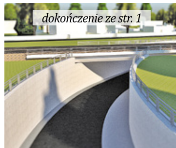
dokończenie ze str. 1

Celestynowskiemu samorządowi udało się pozyskać dofinansowanie, bowiem inwestycja, która pierwotnie (kilka lat temu) miała kosztować kilka milionów złotych, finalnie urosła do kwoty ponad 30 mln zł. Gmina na budowę tunelu wyda niemal 10,1 mln zł, PKP Polskie Linie Kolejowej dołożą 13,2 mln zł, natomiast z budżetu Województwa Mazowieckiego trafi 4 mln zł, a z budżetu powiatu otwockiego 2,5 mln zł.