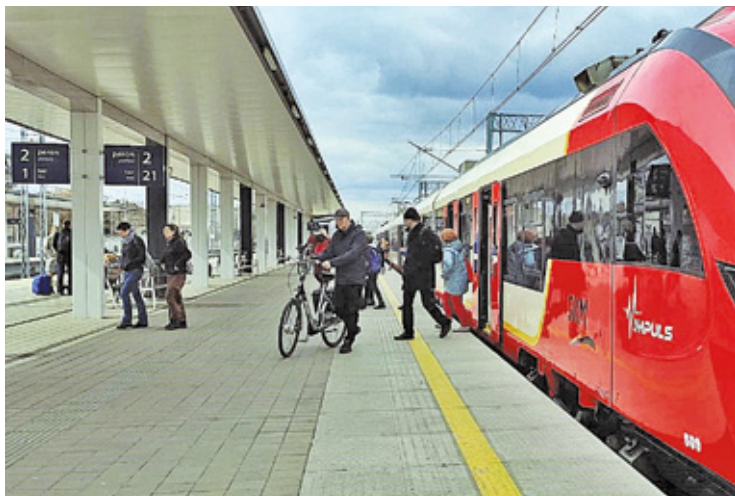
W poniedziałek większość pociągów SKM linii S1 czy Kolei Mazowieckich wróciła na trasę pomiędzy Warszawą a Otwockiem, czy Piławą

Opowiadaliśmy w połowie grudnia, kiedy PKP PLK zamknęło jeden tor na linii średnicowej. – Prace wymagały strefy bezpieczeństwa. Dlatego ruch pociągów utrzymano na jednym z dwóch torów linii podmiejskiej. Organizacja przewozów i rozkład jazdy pociągów były uzgadniane z przewoźnikami. Czasowe zamknięcie toru wykorzystano na intensywne prace. Wykonano ważny etap budowy połączenia pomiędzy podmiejską i dalekobieżną linią średnicową – wyjaśnia Karol Jakubowski z zespołu prasowego PKP Polskie Linie Kolejowe S.A. I dodaje: – Obok przystanku Warszawa Ochota przy nasypie linii średnicowej wykonawca zbudował specjalne ściany szczelne typu „larsen”. Takie działanie pozwala na kontynuację budowy nowego łącznika. Tor łączy linię dalekobieżną z podmiejską linią średnicową. Takie rozwiązanie usprawni