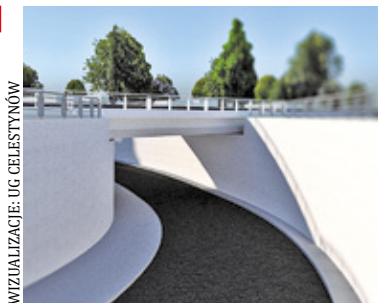
WIZUALIZACJE: UG CELESTYNÓW

To jedna z kontrowersyjnych i najdroższych inwestycji w gminie, która niemal utknęła w martwym punkcie. Kiedy rozpocznie się budowa tunelu drogowego w ul. Jankowskiego?