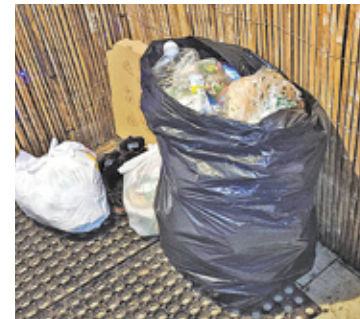
W tym roku, śmieci od mieszkańców będzie odbierała firma „Koma”

Niedawno rozstrzygnięto przetarg na odbiór i zagospodarowanie odpadów komunalnych od mieszkańców. W 2023 roku (podobnie jak w ubiegłym), usługi świadczy firma „Koma”.