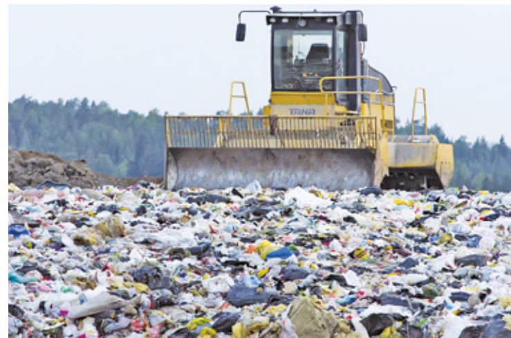
Podstawowe problemy środowiska na obszarze objętym planem i w jego sąsiedztwie, w większości są wynikiem działania składowiska odpadów komunalnych

jest udostępniony w urzędowym BIP-ie oraz w siedzibie urzędu w budynku „B”, pok. 17 (wcześniej należy zgłosić swoją wizytę pod nr tel. 22 779 20 01, wew. 190 lub 152) – informuje Urząd Miasta Otwock. I podkreśla, że publiczną dyskusję nad rozwiązaniami przyjętymi w projekcie planu zagospodarowania,