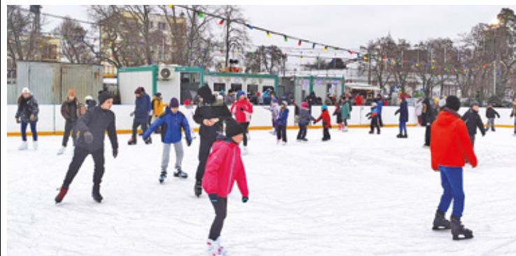
Miłośnicy zimowego sportu z niecierpliwością czekali na otwarcie miejskiego lodowiska

W dni powszednie w godz. 8-15 tafla mogą skorzystać szkoły i placówki edukacyjne. Dopiero po południu ślizgawka jest dostępna nie tylko dla mieszkańców Otwocka, ale także dla osób z sąsiednich miejscowości, bo otwockie lodowisko na razie jest jedynym w okolicy. – W przypadku złych warunków atmosferycznych możliwe będzie ogłoszenie przerwy konserwacyjnej, a nawet zamknięcie lodowiska do czasu poprawy pogody – wyjaśnia otwocki urząd miasta.