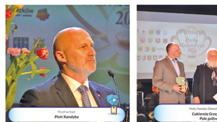
Prezesa na Sejm Piotr Kandyba