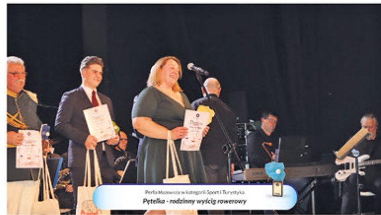
Perła Mazowsza w kategorii Sport i Turystyka Pętella - rodzinny wyścig rowerowy