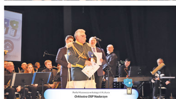
Perła Mazowsza w kategorii Kultury Orkiestra OSP Nadarzyn