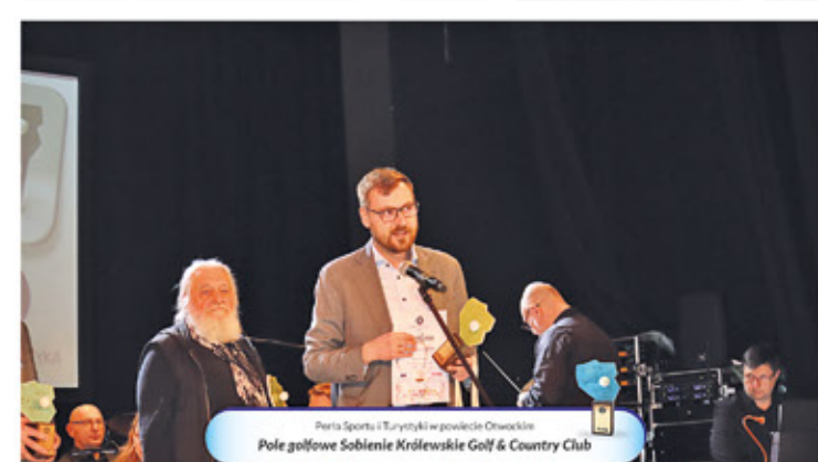
Perła Sportu i Turystyki w powiecie Otwockim Pole golfowe Sobienie Królewskie Golf & Country Club