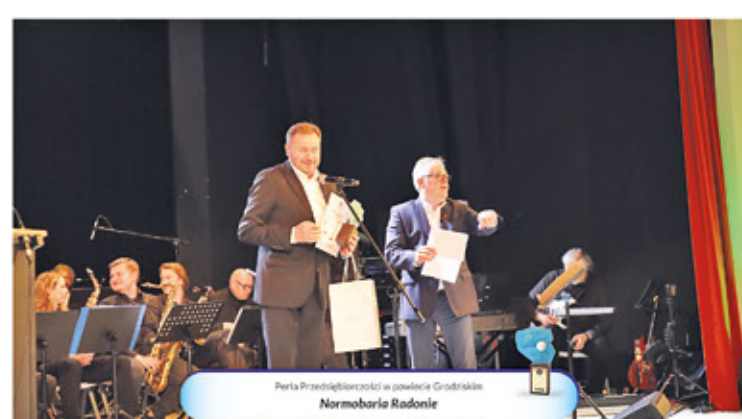
Perła Przedsiębiorczości w powiecie Grodzkim Normbaria Radonie