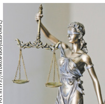
Wyrok jest prawomocny, Józefów otrzyma od otwockiego przedsiębiorstwa blisko 14,5 mln zł

– Wyrok sądu nie wpłynie na codzienną realizację zadań przez miejską spółkę. Żadna z obecnie świadczonych usług nie zostanie wstrzymana, a OPWiK będzie nadal dostarczać wodę oraz odbierać ścieki od mieszkańców Otwocka. Zarząd oraz cała załoga OPWiK uczynią wszystko, aby błędy i rażące zaniedbania poprzednich władz miały jak najmniejsze konsekwencje dla mieszkańców