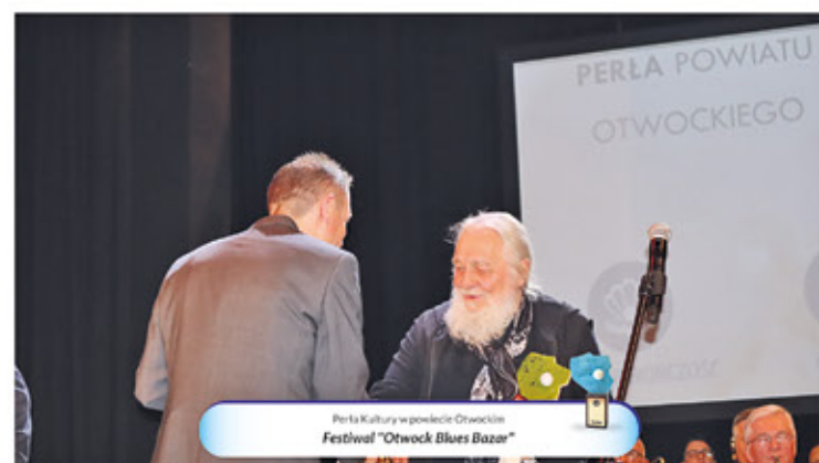
Perła Kultury w powiecie Otwockim Festival "Otwock Blues Bazar"