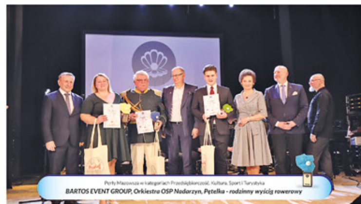
Perła Mazowsza w kategoriach Przedsiębiorczości, Kultury, Sport i Turystyka BARTOS EVENT GROUP, Orkiestra OSP Nadarzyn, Pętella - rodzinny wyścig rowerowy

Organizatorzy konkursu przygotowali nagrody dla zwycięzców, dla osób zgłaszających swoje „perły” oraz biorących udział w głosowaniu.