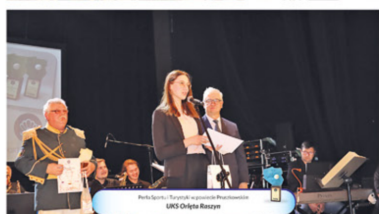
Perła Sportu i Turystyki w powiecie Pruszkowskim UKS Orleto Raszyn

ORGANIZATORZY: Wydawca Sieci Tygodników Lokalnych Przeгляд, LGD Perły Mazowsza, Fundacja Inkubator Inicjatyw Lokalnych, Gminy i Starostwa powiatów Grodzkiego, Otwockiego Piaseczyńskiego i Pruszkowskiego. SPONSORZY: Sieć hoteli De Silva, Firma Floslek, Park Trampolin KOCHAM SKAKAC, Krówki z Milanówka, Studio Metamorfozy Beata Lewandowska STATUETKI zostały wykonane ręcznie w Pracowni Rzeźby Różnych SYNOPSIS w Wilczej Górze zajmującej się aktywacją zawodową osób z autyzmem.