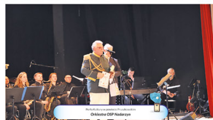
Perła Kultury w powiecie Pruszkowskim Orkiestra OSP Nadarzyn