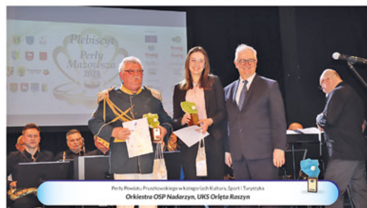
Perła Powiatu Pruszkowskiego w kategoriach Kultury, Sport i Turystyka Orkiestra OSP Nadarzyn, UKS Orleto Raszyn

Kolejne wyróżnienia powędrowały do zwycięzców w powiecie pruszkowskim,