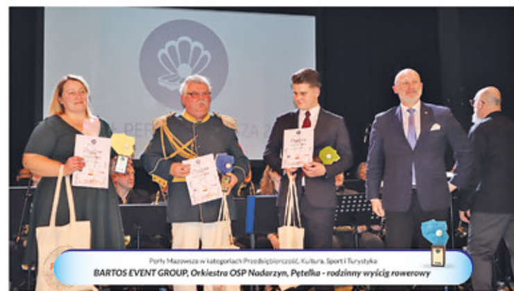
Perła Mazowsza w kategoriach Przedsiębiorczości, Kultury, Sport i Turystyka BARTOS EVENT GROUP, Orkiestra OSP Nadarzyn, Pętella - rodzinny wyścig rowerowy