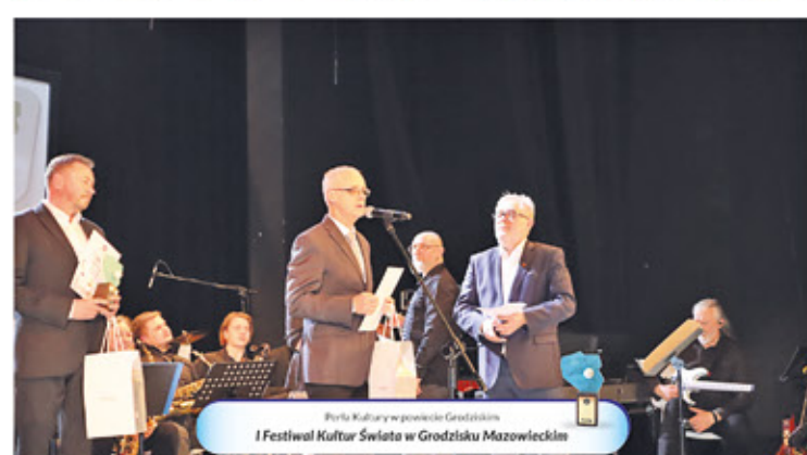
Perła Kultury w powiecie Grodzkim I Festiwal Kultur Świata w Grodzisku Mazowieckim