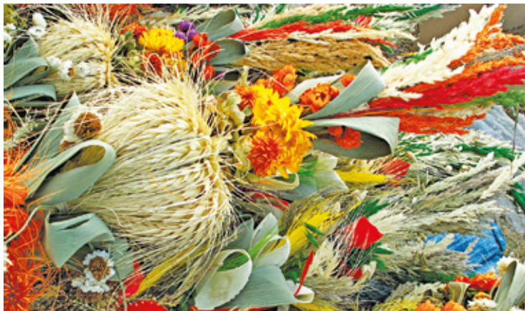
Konkurs będzie połączony z akcją dobroczynną

Konkurs przeprowadzony zostanie w 5 kategoriach wiekowych: dzieci przedszkolne, uczniowie klas 1-3, 4-6,