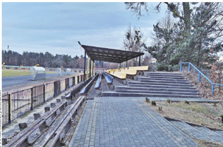
Kompleks basenowy powstanie na dużym terenie przy ul. Karczewskiej i Ślusarskiego

Otwock musiał czekać pół wieku, aby marzenie o basenie zaczęło się urzeczywistniać. Nie było jednak łatwo. W sierpniu 2022 roku ratusz