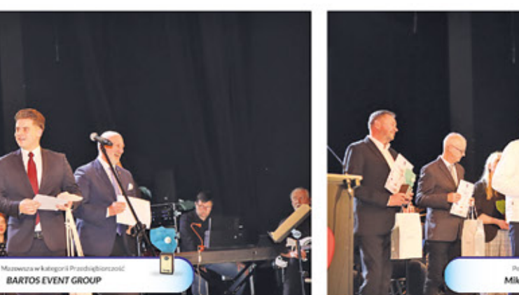
Perła Mazowsza w kategorii Przedsiębiorczości BARTOS EVENT GROUP