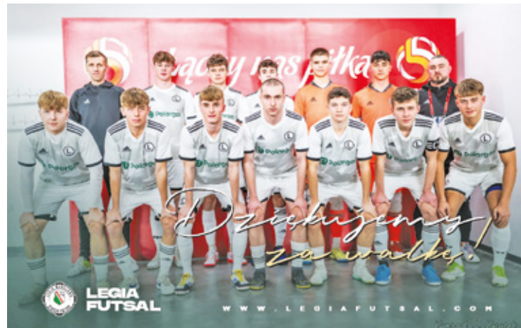
Zawodnicy Mazura w barwach sekcji futsalu warszawskiej Legii