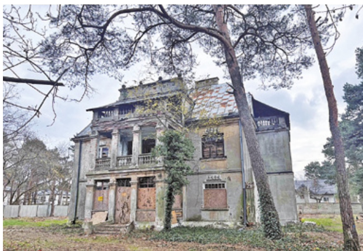
Stan techniczny willi jest bardzo zły