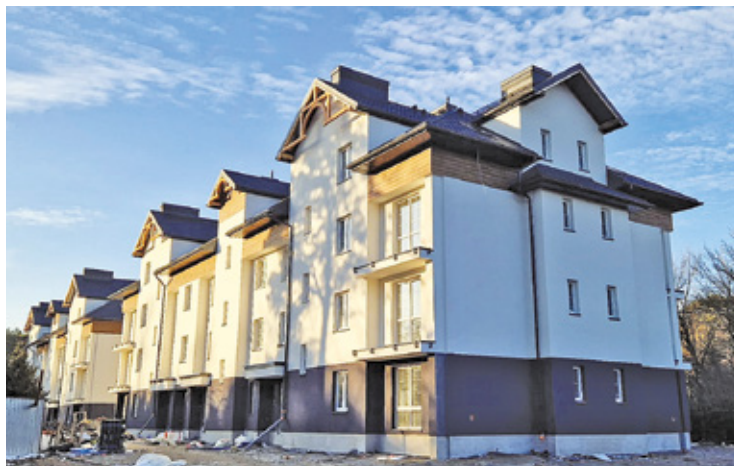
Niektóre mieszkania są przeznaczone m.in. dla seniorów. W lokalach zamieszka 70 rodzin. Obok nowych budynków jest przedszkole

R ok temu rozpoczęto budowę dwóch identycznych budynków wielorodzinnych (A i B) przy ul. Kochanowskiego w Otwocku. Dwa nowe bloki komunalne rozwiążą problem 70 rodzin, którym przydzielono lokale. Dobrą wiadomością dla przyszłych najemców jest to, że obok bloków znajduje się przedszkole.