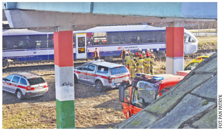
Kobieta przechodziła przez popularne dzikie przejście

Maszynista pociągu zauważył człowieka przechodzącego przez tory i gwałtownie hamował. – 82-letnia kobieta przechodziła w niedozwolonym