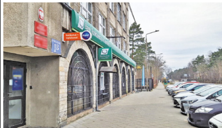
Bank Spółdzielczy w Otwocku