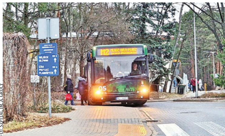
Nowy przystanek jest dużym ułatwieniem dla pacjentów szpitala

stanek ma charakter „Na żądanie”. W związku z zakończeniem przebudowy ul. Warszawskiej przystanek Os. War-