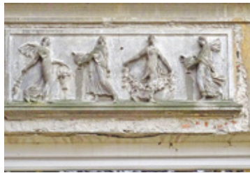
Willa zachowała się bez większych przekształceń