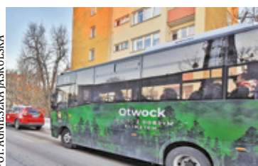
W planach jest także doprowadzenie bezpłatnej komunikacji miejskiej do Europejskiego Centrum Zdrowia

Otwocki ratusz podkreśla, że w planach jest również doprowadzenie bezpłatnej komunikacji miejskiej do Europejskiego Centrum Zdrowia przy ul. Borowej, ale będzie to możliwe dopiero po wykonaniu ul. Cisowej, na którą jest już podpisana umowa, a prace będą realizowane w drugiej połowie 2024 r.