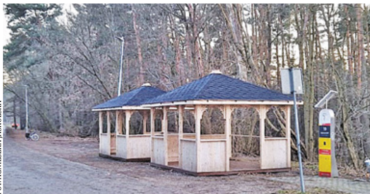
Sprawą zajęli się funkcjonariusze ds. nieletnich, którzy zabezpieczyli nagrania z kamer i zajęli się ustaleniem, kim są nieletni sprawcy

Kilka dni temu do Komendy Powiatowej Policji w Otwocku zgłosił się pracownik Urzędu Miasta Otwocka, który złożył zawiadomienie dotyczące zniszczenia altany przy ul. Turystycznej