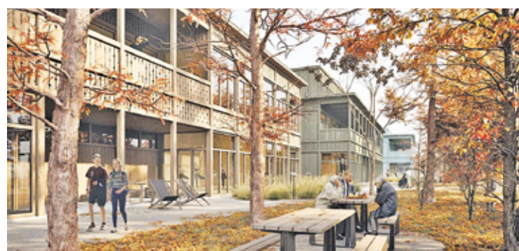
WIZUALIZACJE: BDR ARCHITEKCI/MATERIAŁY PRASOWE