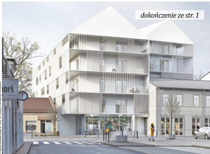
WIZUALIZACJA: MFR ARCHITEKCI

– Dom Uniwersalny to wielorodzinny budynek, który będzie zlokalizowany w ścisłym centrum miasta. Dzięki swojej ikonicznej formie oraz eksponowanej lokalizacji ma szansę stać się jedną z wizytówek Otwocka – mówi nam spółka Landmark z Józefowa. Inwestor podkreśla, że nowy projekt nie tylko wpłynie pozytywnie na prestiż miasta, ale także zapewni komfortowe mieszkania przede wszystkim młodym osobom. Architekci Domu Uniwersalnego tłumaczą, że nowoczesny budynek wielorodzinny jest w pewnym sensie kontrastem pod względem funkcjonalności w porównaniu do już istniejących, zrewitalizowanych obiektów zabytkowych, takich jak np.