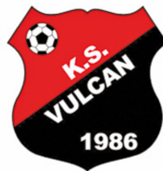
Vulcan Wólka Młdzka występuje w rozgrywkach A-klasy

Tydzień później miały miejsce kolejne derby, ale już nie powiatu, a Otwo-