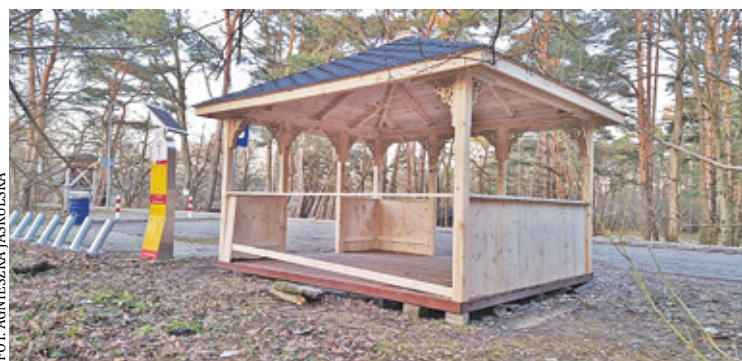
Wandale zniszczyli jedną z dwóch altan ogrodowych przy plaży miejskiej