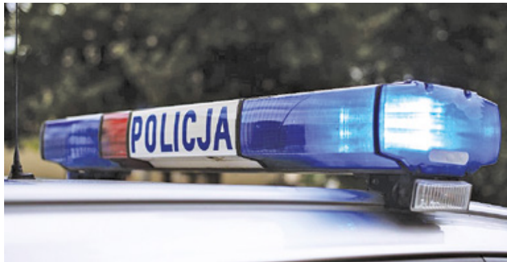
Kluczowe w wyjaśnieniu okoliczności śmierci rodziny będą wyniki sekcji zwłok

Kluczowe w wyjaśnieniu okoliczności śmierci rodziny będą wyniki sekcji zwłok. Nieoficjalnie dowiedzieliśmy się, że ciała nie miały widocz-