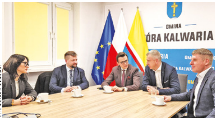
Trwają rozmowy dotyczące wydłużenia nowej linii autobusowej