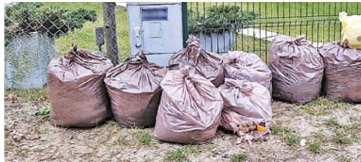
Selektywne odpady gromadzimy i wystawiamy do odbioru w workach