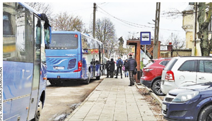
Autobusy będą kursowały nowymi trasami: Zambrzyków – Otwock oraz Kosumce – Otwock