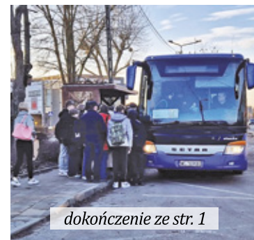
dokończenie ze str. 1

– W ten sposób linia autobusowa, która będzie posiadała tylko cztery przystanki w ekspresowym tempie ok. 30 minut, dowiezie pasażerów z Otwocka do linii metra, skąd będzie można dotrzeć w inne miejsce – wyjaśnia prezydent miasta. – Planujemy włączyć linię autobusową w ramy bezpłatnej otwockiej komunikacji miejskiej, co byłoby zachętą dla mieszkańców do korzystania z transportu zbiorowego, tak ważną w kontekście planowanych trudności ze względu na modernizację linii kolejowej S7 – tłumaczy Jarosław Margielski. Na tym nie koniec. Dodatkowo władze Otwocka omówiły z burmistrzem Józefowa oraz wójtem gminy Wiązowna możliwość skorelowania planowanej ekspresowej linii otwockiej, bezpłatnej komunikacji miejskiej z istniejącą linią L50, która łączy Wiązownę z Józefowem. Samorządowcy rozważali również opcję wprowadzenia dodatkowego przystanku na trasie