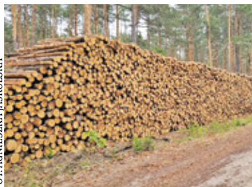
Policja zatrzymała ojca i jego syna

– Sprawą zajęli się policjanci z komisariatu w Józefowie oraz otwoccy kryminalnymi. Złodzieje długo nie pozostali bezkarni, ponieważ funkcjonariusze jeszcze tego samego dnia ustalili sprawców kradzieży – podkreśla oficer prasowy. I dodaje, że mundurowi za-