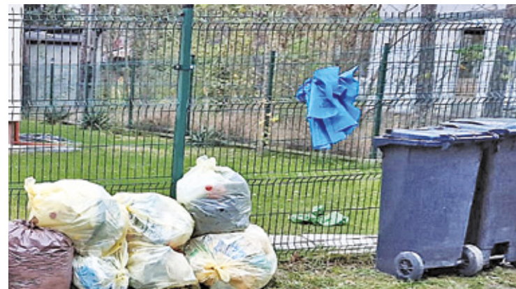
Niedawno rozstrzygnięto przetarg na odbiór nieczystości od mieszkańców

Urząd gminy prosi mieszkańców, którzy prowadzą kompostowanie bioodpadów w przydomowych kompostownikach, o wypełnienie specjalnej ankiety, dostępnej na stronie internetowej urzędu. – Celem przeprowadzenia ankiety jest oszacowanie ilości bioodpadów, które zostały poddane recyklingowi (wytworzone i poddane kompostowaniu) na terenie gminy w 2023 roku – wyjaśnia urząd. I tłumaczy, że w związku z nowymi zasadami obliczania