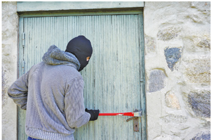
Policja zatrzymała seryjnego włamywacza

- Na pierwszy rzut oka włamania nie wydawały się być ze sobą powiązane. Sprawca dokonywał włamań na terenie Otwocka, Józefowa i Wiązowny.