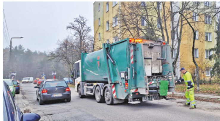
Na terenie dawnej bazy autobusowej w Karczewie, powstała baza dla śmieciarek

– Do urzędu gminy nie wpłynęły żadne dokumenty potwierdzające, że