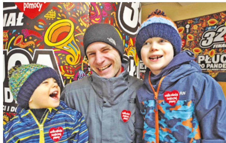
Podczas finału w wielu miejscowościach na darczyńców czekało mnóstwo atrakcji

W ramach 32. Finału WOŚP m.in. w Otwocku, Józefowie, Wiązownie czy Celestynowie odbyło się wiele wydarzeń sportowych, kulturalnych, koncertów, a także licytacji (niektóre jeszcze nie są zakończone). Część wydarzeń odbyła się m.in. w Powiatowym Młodzieżowym Domu Kultury w Otwocku. Natomiast finałowy koncert odbył się w parku miejskim. W akcję WOŚP zaangażowali się także funkcjonariusze z KPP Otwock oraz strażacy PSP Otwock i jednostek OSP, którzy przygotowali dla mieszkańców m.in. strażacką gro-