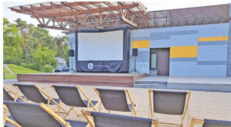
Wśród projekcji znajdują się filmy do najmłodszych, jak również pełnometrażowe

Koszt projektu to 50 tys. zł i głosowało na niego ponad 700 mieszkańców. Projekt zakłada organizację kina letniego dla wszystkich mieszkańców. Wyświetlane będą filmy zarówno dla dzieci, jak i młodzieży, a także dla dorosłych i seniorów, które będą emitowane na wielkim ekranie na scenie w centrum miasta. Będzie to kino z leżakami. Seanse nie mogą skończyć