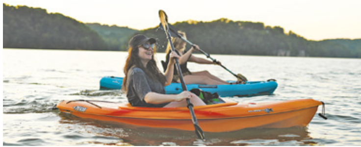
Jeden z wygranych projektów dotyczy spływów kajakowych