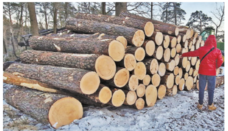
Wycinka lasu w Dąbrówce wywołała wiele emocji

Mieszkańcy są zbulwersowani masowym wycinaniem drzew w powiecie otwockim, zwłaszcza w rejonie parku krajobrazowego.