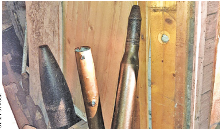
Policja zabezpieczyła dużą ilość broni

Ponieważ na posesji znajdowały się liczne materiały wybuchowe, konieczne było wezwanie funkcjonariuszy z Sekcji Minersko-Pirotechnicznej SPKP Warszawa, którzy zabezpieczyli niebezpieczny materiał w specjalnie przystosowanym pojeździe. Na miejscu