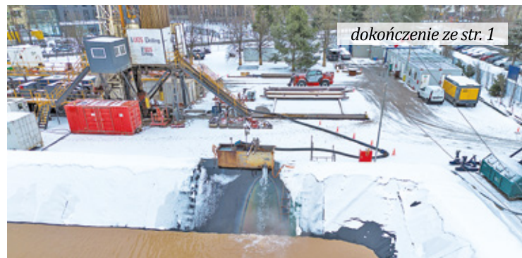
dokończenie ze str. 1

downym basenem zamontowano rurę, którą woda popłynie z ziemi na powierzchnię do specjalnie wybudowanego basenu. W nocy rozpoczął się proces pompowania gorących źródeł. Nieoficjalnie dowiedzieliśmy się, że temperatura wody przekracza 40 st. C. Dlatego w okolicy unosi się specyficzny