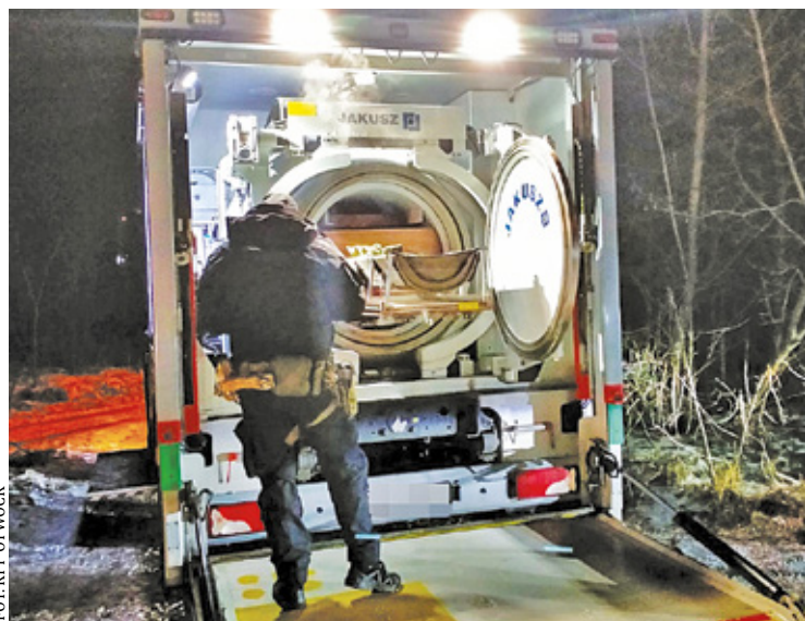
Funkcjonariusze zabezpieczyli niebezpieczny materiał w specjalnie przystosowanym pojeździe

Zgodnie z art. 49 k.p.a. w związku z art. 8c ust. 3 ustawy, niniejszą informację przekazuje się sołtysowi wsi Sewerynow w celu poinformowania mieszkańców wsi o jej treści poprzez ogłoszenie w sposób zwyczajowo przyjęty w tej miejscowości oraz wywiesza się na tablicach ogłoszeń Starostwa Powiatowego w Otwocku i Urzędu Gminy Sobienie Jeziory na okres 14 dni, a także zamieszcza się ją na stronach internetowych Urzędu Gminy Sobienie Jeziory i Starostwa Powiatowego w Otwocku oraz w prasie lokalnej.