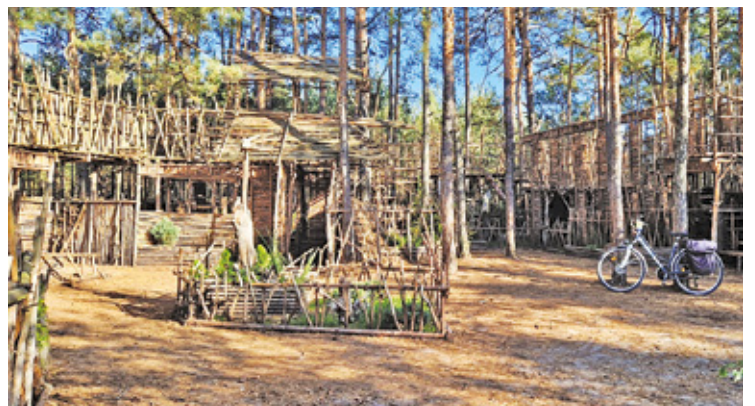
Mały Biskupin to popularne miejsce, które odwiedza młodzież i całe rodziny

W ładze Otwocka po przejęciu terenów OKS wzdłuż ul. Karczewskiej, zdecydowały, że powstaną tam trzy ogromne obiekty sportowe: stadion, kompleks basenowy ze strzelnicą (pod koniec roku rozpoczęła się budowa), a także nowoczesny ośrodek piłkarski dla reprezentacji Polski, który ma być jedną z flagowych inwestycji Polskiego Związku Piłki Nożnej (PZPN) oraz byłego Ministra Sportu i Turystyki, Kamila Bortniczuka. Obiekt ma powstać częściowo na obecnych