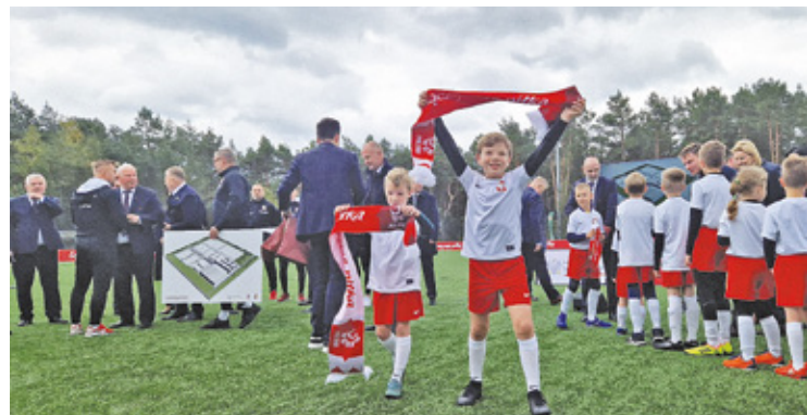
W październiku ub. r. miasto ogłosiło planowaną budowę ośrodka piłkarskiego

Chociaż nowy rząd podjął decyzję o anulowaniu znacznej dotacji na prestiżowy projekt w Otwocku, nie oznacza to konieczności jego całkowitego zaniechania. Polski Związek Piłki Nożnej nie zamierza rezygnować z realizacji swojego ambitnego planu i będzie musiał poszukać nowych źródeł finansowania.