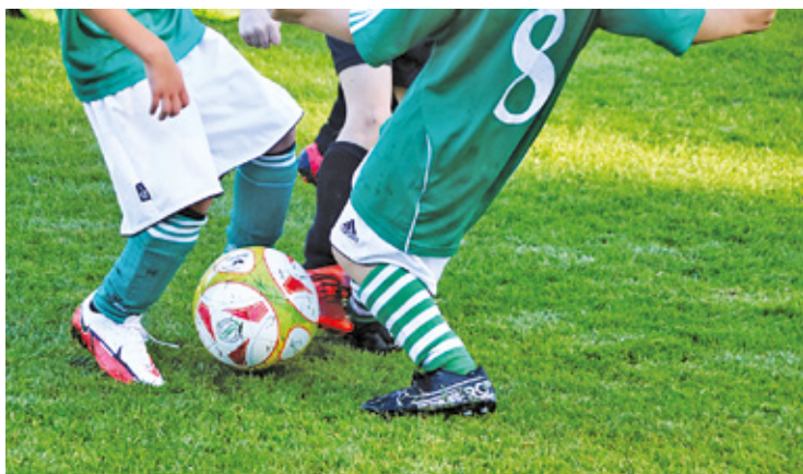
Certyfikat to swoisty znak jakości

Kluby mogą otrzymać jedną z czterech gwiazdek: złotą (najwyższy stopień), srebrną, brązową i zieloną (cer-