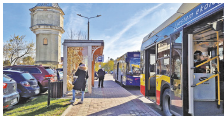
Mnóstwo uczniów dojeżdża do szkół autobusem

Otwockie starostwo informuje, że dzięki dofinansowaniu i wsparciu finansowym członków związku, czyli: powiatu otwockiego oraz gmin: Wiązowna, Osieck, Sobienie-Jeziory, Karczew, Celestynów oraz Kołbiel, od stycznia funkcjonuje osiem linii autobusowych. – Większość z nich już kursowała, ale od stycznia niektóre trasy zostały zmodyfikowane m.in. W12, gdzie autobus kursuje z Michałówka przez Zakręt i Wiązownę do Radiówka