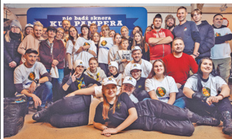
Wolontariusze Fundacji Ciepły Posiłek