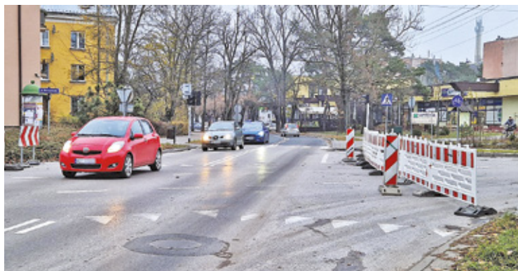
Okolice remontowanego skrzyżowania najlepiej omijać ul. Kraszewskiego, Batorego lub Andriollego

Dotychczasowe objazdy nadal obowiązują. Dwa fragmenty ul. Karczewskiej na odcinku od ul. Lennona do ul. Ślusarskiego są nadal nieprzejezdne. Drogowcy wyznaczyli objazdy ulicami: Hoża – Przewoska – Batorego – Kraszewskiego lub na odcinku od strony OKS i Karczewa ulicami: Ślusarskiego – Jeremy – Pułaskiego – Andriollego. Zamknięte skrzyżowanie przy szpitalu, najlepiej ominąć ul. Kraszewskiego (zwłaszcza od strony Karczewa) lub ul. Batorego i ul. Andriollego.