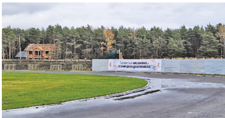
Pod koniec 2023 roku rozpoczęła się budowa basenu

unieważnił decyzję poprzedniego ministra dotyczącą udzielenia dotacji w wysokości ponad 304 mln zł na budowę