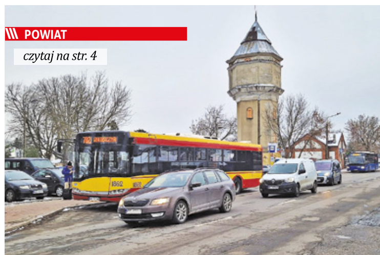
Do bulwersującego zdarzenia doszło w miejskim autobusie linii 702, który kursuje z Otwocka do Warszawy