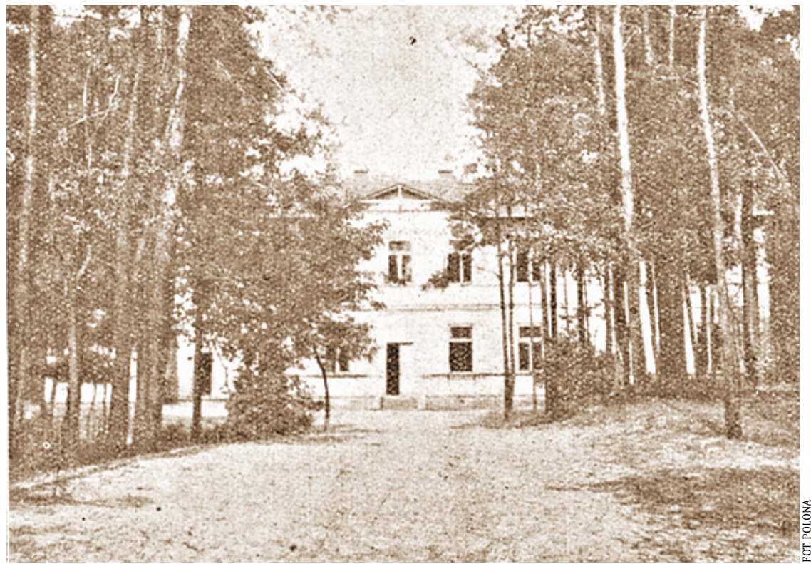
Gimnazjum w Otwocku przed wojną