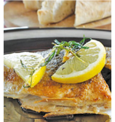
Tradycję spożywania karpia zawdzięczamy... rządowi Józefa Cyrankiewicza

Tego dnia tradycyjnie jemy postne potrawy, a na stole króluje ryba. Oczywiście – najlepiej karp. Co ciekawe, spożywanie akurat tej ryby jest jedną z najmłodszych świątecznych tradycji. Jeszcze przed wojną Polacy wybierali