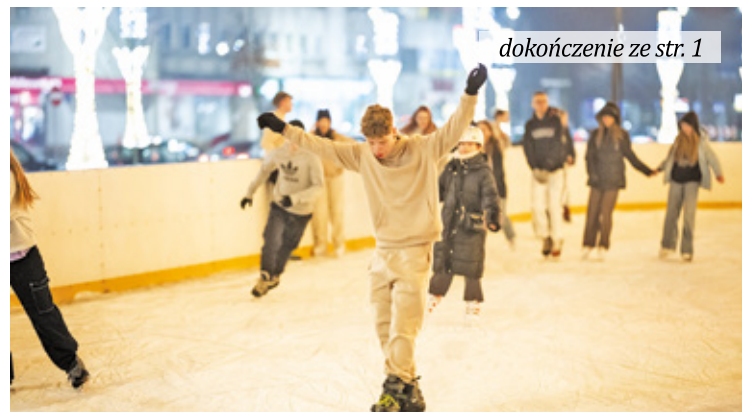
dokończenie ze str. 1

Zamrażanie tafli lodowiska rozpoczęło się pod koniec listopada. 13 grudnia nastąpiło otwarcie ślizgawki w Otwocku (rok temu podczas otwarcia miejskiego lodowiska również była deszczowa pogoda). – Szykujcie się na lodowe szaleństwo. Pierwsza sesja w środę o godzinie 16 – zachęca otwocki urząd. – Jak co sezon, na miejscu dostępne będą łyżwy i kaski do wypożyczenia. Dla najmłodszych adeptów jazdy na lodzie przygotowano specjal-