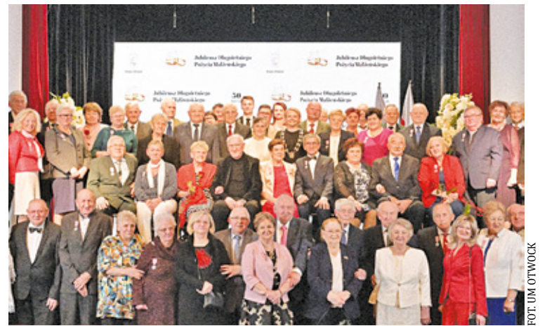
Pary świętujące jubileusz, zostały uhonorowane medalami za długoletnie pożycie małżeńskie