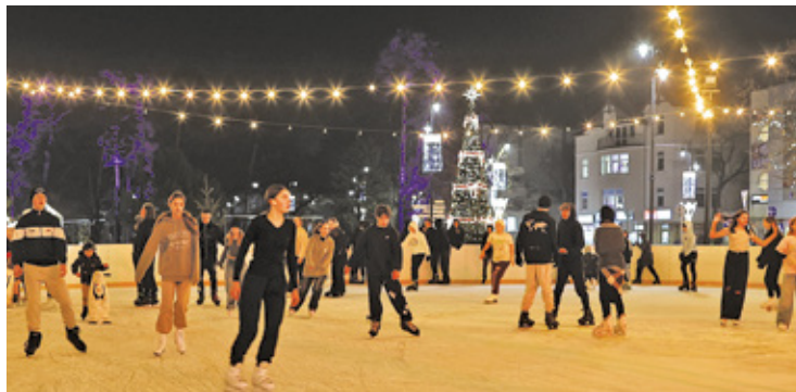
Po południu i wieczorem lodowisko jest oblegane przede wszystkim przez nastolatków

daszona duża ślizgawka jest w Aninie (ul. V Poprzeczna 22) oraz w Celestynowie – plac przed halą sportową od strony ul. Reguckiej. Kolejne lodowisko pod gołym niebem będzie w centrum Otwocka (od strony ul. Andriollego i małpiego gaju). Przy lodowisku będzie punkt handlowy m.in. z hot dogami, zapiekankami, frytkami i gorącą czekoladą. O to kiedy zostanie otwarta ślizgawka i ile będą kosztowały wej-