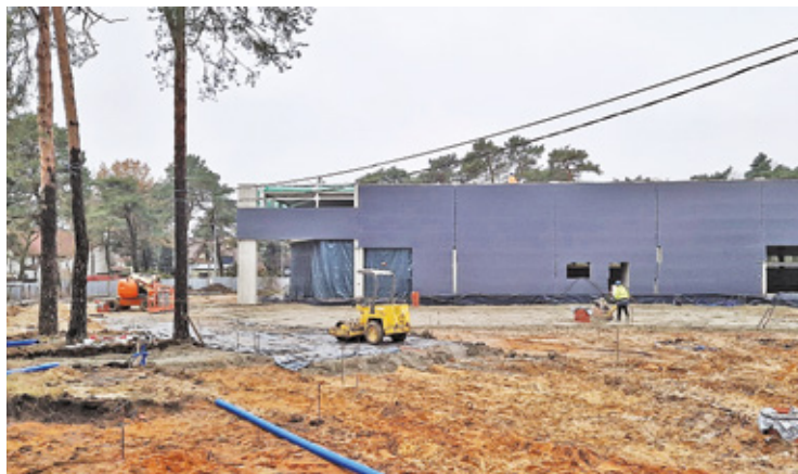
Część mieszkańców uważa, że w tym miejscu powinien powstać park

Firma ALDI, niemiecka sieć dyskontów spożywczo-przemysłowych, kupiła teren za ponad 11 mln zł. Przygotowania do inwestycji rozpoczęły się ponad rok temu. Wtedy firma zleciła (za zgodą urzędu miasta) wycięcie ponad 170 drzew. – Inwestor uiszczył opłatę za