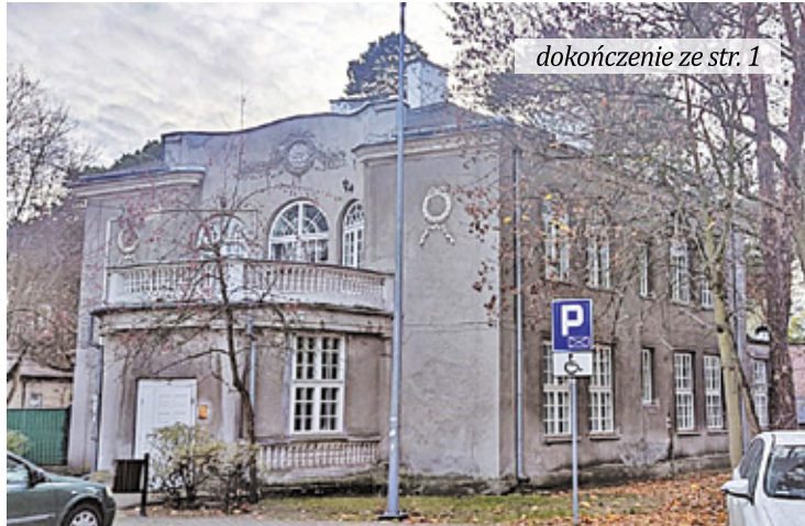
dokończenie ze str. 1

– Powodem unieważnienia uchwały jest m.in. błędne stwierdzenie przez Radę Miasta Otwocka, że stanowi ona