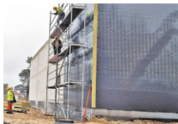
Supermarket powstaje na terenie po dawnym domu dziecka

wycinkę drzew w wysokości około 431 000 zł – tłumaczy józefowski urząd. Budowa nowego supermarketu, która rozpoczęła się w październiku, idzie pełną parą – o szczegółach informowaliśmy 5 października. W ciągu dwóch miesięcy powstał m.in. zadaszony obiekt, trwa montowanie odwodnienia i rynien. – Zgodnie z uzyskanym pozwoleniem na terenie, powstanie budynek handlowo-usługowy wraz z parkingami, dojazdami oraz niezbędną infrastrukturą tech-