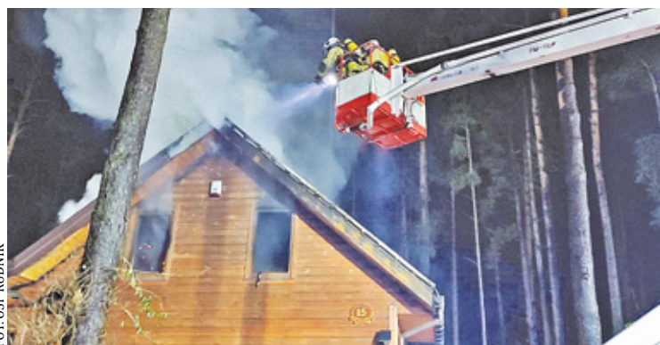
W gminie Osieck spłonął drewniany budynek

W środę, 13 grudnia w powiecie otwockim miały miejsce dwa pożary. Po godzinie 1 w nocy straż pożarna otrzymała zgłoszenie o płonącym budynku mieszkalnym w miejscowości Rudnik, w gminie Osieck. Na miejscu interweniowało kilka jednostek straży pożarnej: JRG Otwock, OSP Pogorzelski, OSP Górki, OSP Rudnik, OSP Osieck, OSP Wiązowna i WSP Celestynów.