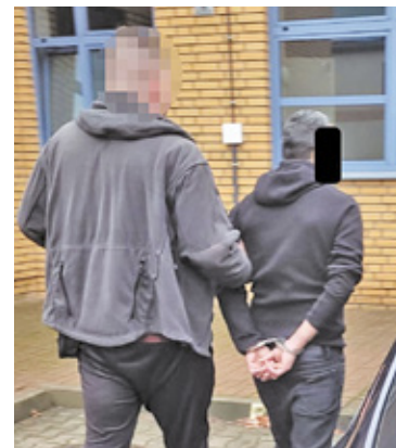
45-letni obywatel Gruzji został zatrzymany

– Gdy funkcjonariusze zbliżyli się do zaparkowanego bmw, użyli sygnałów świetlnych i dźwiękowych, informując kierowcę, aby nie kontynuował jazdy. W tym momencie kierowca osobówki niespodziewanie ruszył do