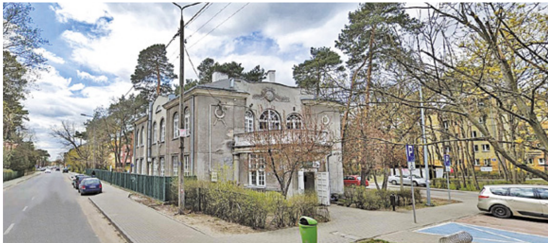
W dawnej willi przy ul. Czaplickiego ma powstać filia Instytutu im. Dmowskiego

Zgodnie z postanowieniami umowy, miasto miało wspólnie z resortem prowadzić Instytut Myśli Narodowej. Dwie komisje – budżetowa oraz nieruchomości – negatywnie zaopiniowały uchwałę. Wynik głosowania był jednoznaczny. Po kilku godzinach burzliwej dyskusji odbyło się głosowanie nad