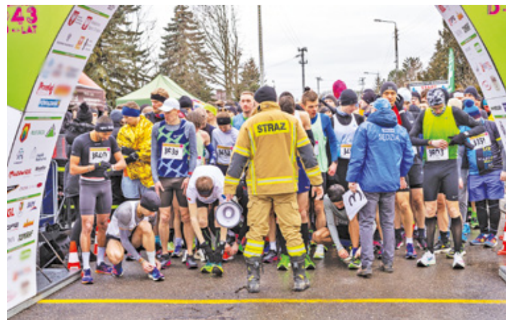
Zapisy rozpoczęły się na początku grudnia

W tym roku organizatorzy wprowadzają rywalizację drużynową na dy-