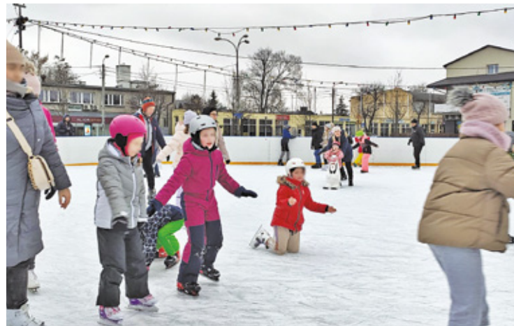
Przy lodowisku będzie działał punkt m.in. z hot dogami, zapiekankami i frytkami

Zasady funkcjonowania miejskiego lodowiska pozostaną takie same, jak w ubiegłym sezonie. – Grupy szkolne mogą korzystać z lodowiska bezpłatnie w godzinach od 8 do 15 w ramach lekcji wychowania fizycznego. Od godziny 16.00 obiekt będzie otwarty dla wszystkich mieszkańców – zapewnia ratusz. – Ceny biletów pozostaną takie same, jak w poprzednim sezonie, czyli: bilet ulgowy kosztuje 8 zł, normalny 10 zł, a posiadacze karty Rodzina 3+ zapłacą 6 zł za 50-minutową sesję. Wypożyczenie kasku to dodatkowe 5 zł, a za korzystanie z „pingwinka” pobierane są dodatkowe 2 zł. Lodowisko będzie czynne przez siedem dni