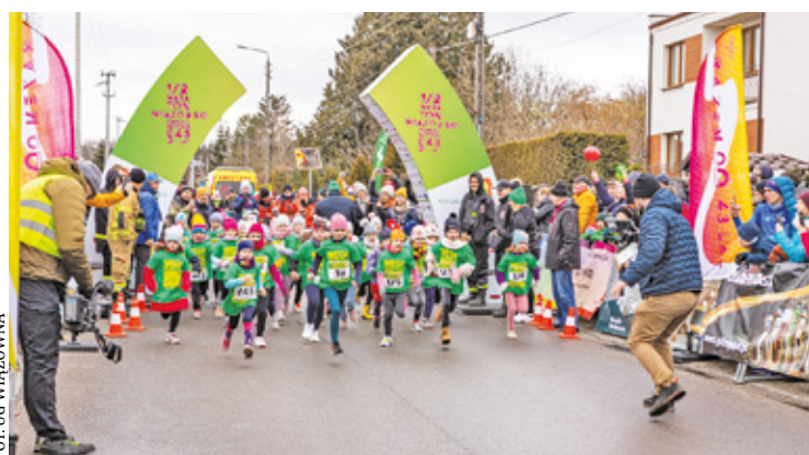
Co roku w półmaratonie uczestniczy mnóstwo małych i dużych biegaczy