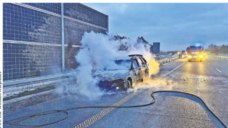
Na miejscu błyskawicznie interweniowały służby ratunkowe

ciem ratowników. Nikomu nic się nie stało. Pojazd spłonął doszczętnie – po-