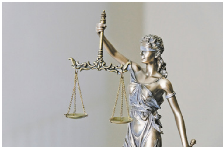
Józefów wygrał proces z samorządem wojewódzkim, ale miasto procesuje się także z Otwockiem

Sąd przyznał rację miastu Józefów, lecz samorząd województwa odwołał się do Naczelnego Sądu Administracyjnego. Ten również przyznał rację