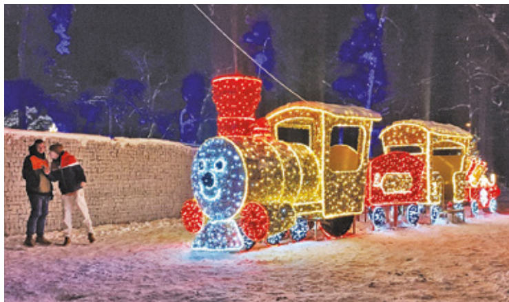
Świąteczna iluminacja rozbłyśnie na ulicach na początku grudnia

lodowisko w Aninie (OSiR przy ul. V Poprzeczna 22) oraz w Celestynowie – plac przed halą sportową od strony