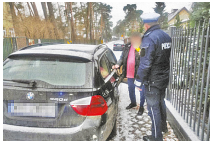
Policja zatrzymała pirata drogowego na jednej z otwockich ulic

Policjanci z Otwocka, mając na celu eliminację nieodpowiedzialnych kierowców, którzy prowadzą pojazdy, będąc pod wpływem alkoholu, przeprowadzają różne działania. W weekend realizowali akcję pod nazwą „Trzeźwy Kierowca”. Podczas tych działań przeprowadzono około 700 testów trzeźwości wśród kierowców. – Wykryto dwie osoby prowadzące pojazd w stanie nietrzeźwości oraz cztery osoby kierujące pojazdami po spożyciu alkoholu. Oprócz najpoważniejszych