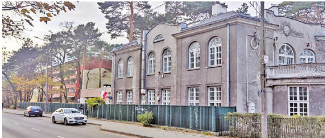
W dawnej willi przy ul. Czaplickiego miałyby powstać filia Instytut im. Dmowskiego w Otwocku

Jak czytamy w projekcie umowy, minister zobowiązuje się zapewnić instytutowi fundusze – ponad 10 mln zł rocznie (czyli przez 10 lat łącznie przeszło 100 mln zł) na prowadzenie działalności bieżącej. Z kolei miasto ma przekazywać na tę działalność 200 tys. zł