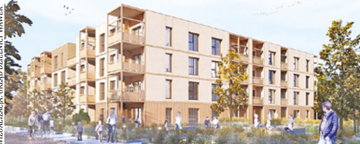
WIZUALIZACJA: URZĄD DZIELNICY WAWER

Zdecydował o wybudowaniu na niej mieszkań TBS (Towarzystwo Budownictwa Społecznego) dedykowanych osobom o średnich zarobkach. Lokale będą wynajmowane przez wawerski samorząd i przeznaczone dla osób, które zarabiają zbyt dużo, aby zakwalifikować się do otrzymania lokalu komunalnego, a jednocześnie mają zbyt niskie dochody, by móc zakupić mieszkanie na własność.