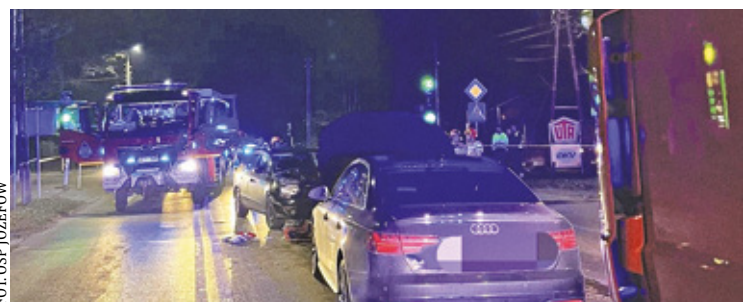
Mężczyzna został potrącony przez dwa samochody

Okoliczności tej tragedii wyjaśniają śledczy. Według świadków zdarzenia, pieszy wszedł na pasy na czerwonym