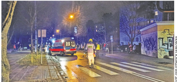
Do wypadku doszło na ul. Poniatowskiego w styczniu 2021 roku tuż po godzinie 17

W niedzielę, 10 stycznia 2021 roku tuż po godzinie 17, na oświetlonym i oznakowanym przejściu dla pieszych,