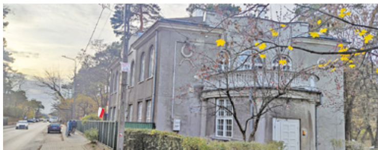
Urząd Miasta Otwock wyjaśnia, że dzięki podpisanej umowie miasto otrzyma pieniądze na renowację zabytkowego i zniszczonego budynku

W zabytkowej, dawnej willi Racówka, zlokalizowanej przy ul. Czaplickiego 7 w Otwocku, planowane jest utworzenie filii Instytutu Dziedzictwa Myśli Narodowej im. Romana Dmowskiego i Ignacego Jana Paderewskiego, które podlega Ministrowi Kultury i Dziedzictwa Narodowego Piotrowi Glińskiemu.