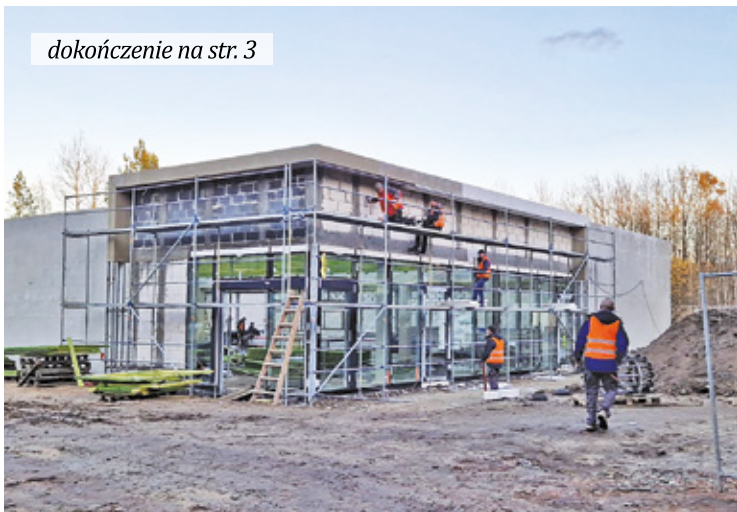
Nowy market powstaje w ekspresowym tempie