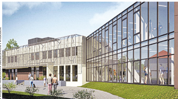
Wizualizacja Pawilonu Kultury w Wiązownie po rozbudowie – widok od frontu

Fundusze na realizację kolejnych etapów rozbudowy Pawilonu Kultury gmina zabezpieczyła w Wieloletniej Prognozie Finansowej. Wartość I etapu wynosi 2,3 mln zł, z czego 2 mln