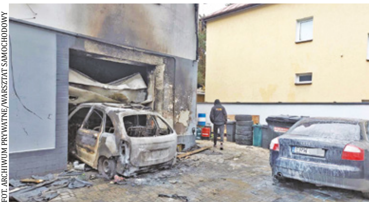
Pożar samochodu w warsztacie w Józefowie spowodował ogromne straty

W niedzielę służby ratunkowe otrzymały zgłoszenie dotyczące mężczyzny wymagającego natychmiastowej pomocy medycznej. – Mężczyzna został znaleziony leżący na chodniku przy ulicy Karczewskiej w Otwocku, był nieprzytomny – mówi st. kpt. Maciej Łodygowski z Komendy Powiatowej Państwowej Straży Pożarnej w Otwocku. Na miejscu interweniowali strażacy z JRG Otwock, OSP Otwock Jabłonna, OSP Wólka Mładzka, a także wezwano Lotnicze