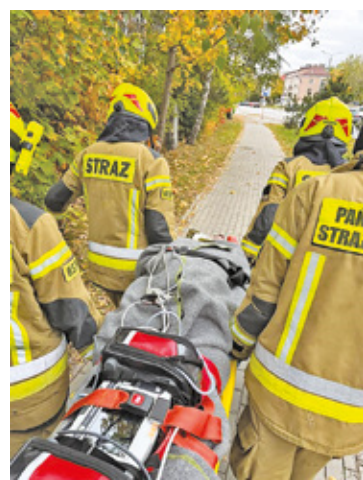
Strażacy przenieśli na noszach nieprzytomnego mężczyznę do szpitala

miejsce podczas mojej pracy przy samochodzie citroen. Naprawa elektrozaoporu w butli LPG zakończyła się dla mnie katastrofą. Doszło do eksplozji