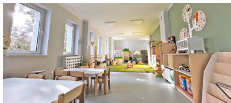
Obiekt jest nowoczesny i przyjazny dzieciom

Od kilku tygodni żłobek poszukuje pracowników. – Większość personelu już mamy, ale wolne są stanowiska dla kadrowej i intendenta. Nadal poszukujemy opiekunek dziecięcych. Ofert nie brakuje, ale mamy wysokie wy-