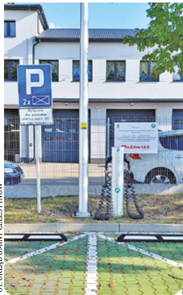
Nowa stacja ładowania e-pojazdów jest już otwarta

Samochody elektryczne w Polsce stają się coraz bardziej popularne. E-pojazdy są nie tylko ekologiczne, ale także przyjazne dla portfeli. Wielu kierowców jeździ autami elektrycznymi po drogach powiatu otwockiego. W miarę rozwoju elektromobilności rośnie także zapotrzebowanie na nowe punkty ładowania. Dlatego cały czas powstają nowe stacje ładowania dla e-pojazdów w powiecie otwockim i Wawrze.