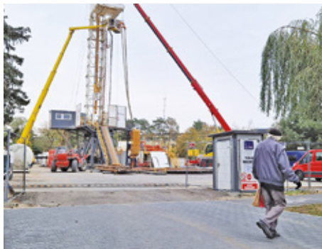
Wieża wiertnicza obok parku miejskiego jest już gotowa

Na zlecenie ratusza w Otwocku, Państwowy Instytut Geologiczny przeprowadził badania, z których wynika, że na głębokości prawie 2 kilometrów mogą znajdować się znaczne zasoby gorących wód, obfitujących w mikroelementy, przy szacowanej temperaturze wynoszącej od 40 do 45 stopni Celsjusza. – Geotermia w Otwocku to kamień milowy w rozwoju w kierunku miasta rekreacyjnego i uzdrowiskowe-