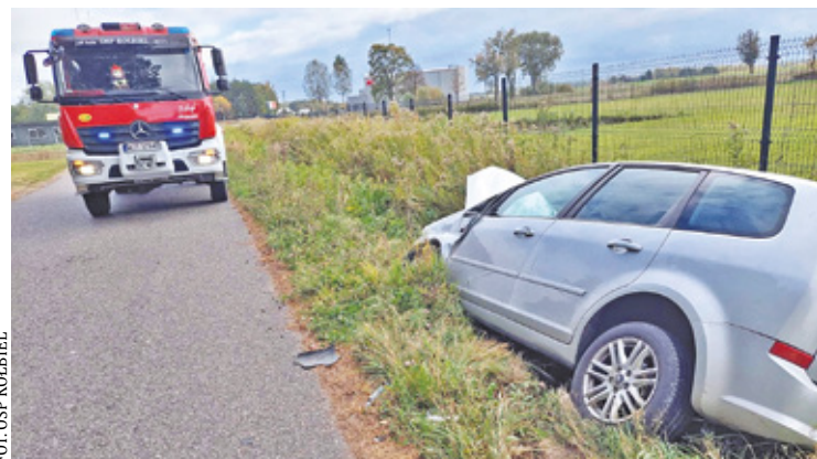
Do kolizji doszło w miejscowości Człkówka

Pogotowie Ratunkowe. Medyczny śmigłowiec wylądował na boisku OKS w Otwocku. Okazało się jednak, że nie ma potrzeby korzystania z transportu lotniczego. Strażacy przetransportowali mężczyznę na noszach bezpośrednio do powiatowego szpitala przy ul. Batorego.