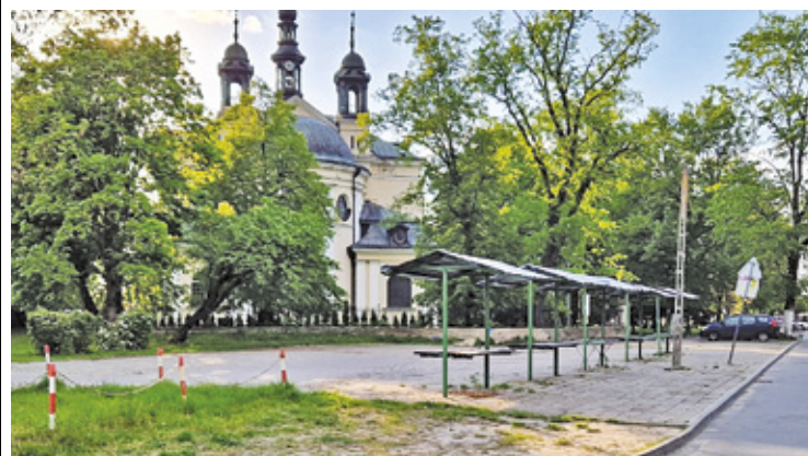
Gmina planuje poprawić warunki handlowania w tym miejscu, tworząc przestrzeń bardziej przyjazną zarówno dla sprzedających, jak i kupujących

Po kilku latach starań wreszcie to się stanie, ponieważ przygotowania do kompleksowej modernizacji rozpoczęły się po przeprowadzeniu kontroli (rok temu) przez Powiatowego Inspektora Nadzoru Budowlanego, który potwierdził, że stan techniczny targowiska jest fatalny. – Powiatowy inspektor nakazał gminie m.in. wymianę nawierzchni placu handlowego, uporządkowanie terenu w obrębie ogrodzenia kościoła i wyprofilowanie nawierzchni w taki sposób, aby wody deszczowe spływały poza obszar targowiska, a także usunięcie starych stoisk sprzedażowych.