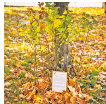
Wiąz jest zaliczany do grona najpiękniejszych europejskich drzew liściastych

Wiąz jest zaliczany do grona najpiękniejszych europejskich drzew liściastych. W naszym kraju spotkać można trzy gatunki wiązów. Są to kolejno wiąz szypułkowy, górski oraz polny.