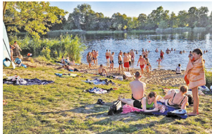
Jezioro przyciąga mnóstwo plażowiczów m.in. z Karczewa i okolic, Wilgi czy Warszawy

(w lipcu), w ciągu dnia przeprowadzono pomiary hałasu nad jeziorem Rokola. – Pomiary wykazały, że praca silnika podczas manewrów na jeziorze powoduje uciążliwość akustyczną dla środowiska. W porze dziennej wartość wyniosła 65,6 dB i 60,3 dB. Uzyskane wartości dźwięku były wyższe od dopuszczalnego poziomu hałasu dla terenów rekreacyjno-wypoczynkowych w porze dziennej odpowiednio o 10,6 i 5,3 dB. – informuje starostwo powiatowe, które pod koniec września obradowało nad uchwałą dotyczącą wprowadzenia zakazu używania jednostek pływających z silnikami spalinowymi na jeziorze w Otwocku Wielkim.