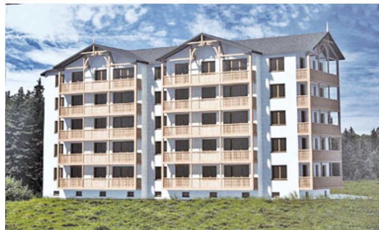
Pierwotnie planowano budowę w systemie TBS

Otowski Zakład Energetyki Ciepłej tłumaczy: – Z uwagi na zmiany uwarunkowań finansowych inwestycji, nie przystąpi do budowy budynków mieszkalnych, wielorodzinnych przy ul. Sikorskiego w Otwocku, w systemie TBS. Planowany montaż finansowy inwestycji wiązałby się z wysoką partycypacją najemców, koniecznością zaciągnięcia wyższego kredytu i ryzykiem dużych obciążeń finansowych dla najemców z tytułu spłaty rat kredytowych w kolejnych latach – czytamy w piśmie OZEC. Spółka podkreśla, że oferta bu-