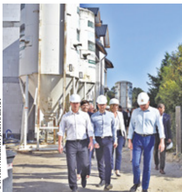
Na otwockich Ługach powstaną trzy budynki komunalne

W czerwcu 2022 roku miasto oddało dwa budynki wielorodzinne przy ul. Poniatowskiego w Otwocku, które wybudowano w systemie TBS (40 lokali). Były to pierwsze mieszkania wybudowane przez Otwocki Zakład Energetyki Ciepłej. Kolejna inwestycja jest