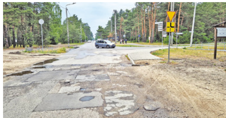
Droga od ul. Narutowicza w kierunku rezerwatu jest od lat w fatalnym stanie. Remont dotyczy odcinka ul. Andriollego na wysokości szkoły „Medyk” w Otwocku

Najniższą ofertę, wynoszącą ponad 1,5 mln zł, złożyła firma Tomiraf z Woli Karczewskiej, która już wcześniej wygrała wiele przetargów dotyczących prac drogowych (wybudowała m.in. rondo na Hożej). Podobną kwotę (ponad 1,5 mln zł) złożyło konsorcjum Specbruk z Gliny. Natomiast kolejna firma – przedsiębiorstwo JTM Construction z Karczewa zaofiarowała wykonanie inwestycji za około 2 mln złotych, natomiast firma TIT BRUK z