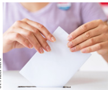
Wybory już za tydzień, w niedzielę 15 października.

Psycholog Sylwia Kowalska-Drozd uważa, że część kobiet nie chodzi na wybory, ponieważ czasem to brak wiary w swoją sprawczość, a czasem po prostu zmęczenie z nadmiaru obowiązków.