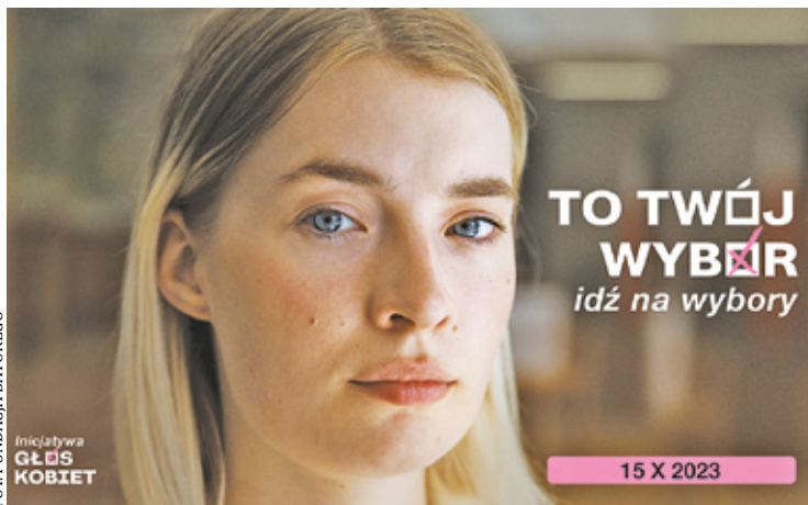
Warto poczytać, posłuchać prowadzących różne kampanie i dać się przekonać, ponieważ aż 52 procent głosów należy właśnie do nas, do kobiet

Może takim bodźcem będą bardzo aktywne kampanie internetowe namawiające kobiety, aby ruszyły do urn, ponieważ to właśnie w ich rękach jest przyszłość Polski. Fundacja Batorego ruszyła z profrekwencyjną kampanią zainicjowaną przez Inicjatywę Głos Kobiet, grupę organizacji społecznych działających na rzecz ochrony i promocji praw kobiet. „Kobiety na wybory”,