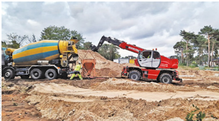
Kilka dni temu na placu pojawił się ciężki sprzęt

Przez długi czas działka pozostawała niezagospodarowana. Inwestor