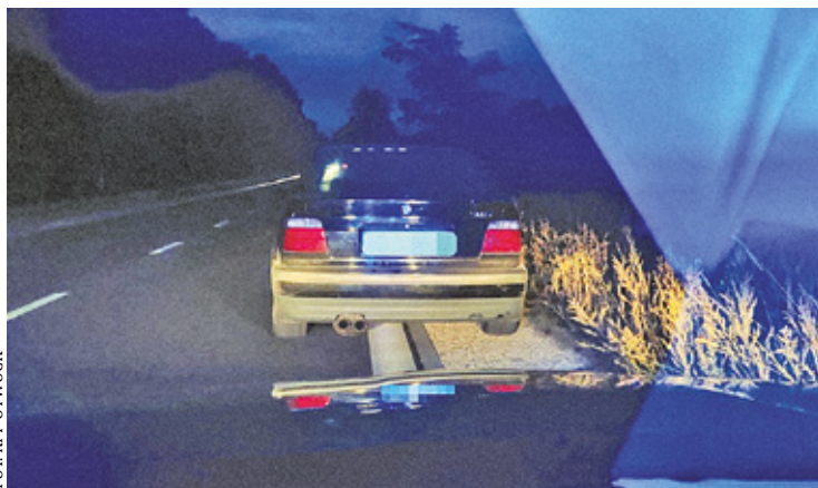
Podczas szczegółowej kontroli pojazdu wykryli szereg usterek zagrażających bezpieczeństwu

Okazało się, że za kierownicą bmw siedzi dobrze im znany 28-letni mieszkaniec Otwocka, który już wcześniej był karany mandatami, między innymi za przekraczanie dozwolonej prędkości. – Policjanci już na pierwszy rzut oka zauważyli, że samochód znajduje się w złym stanie technicznym. Podczas szczegółowej kontroli pojazdu wykryli szereg usterek zagrażających bezpieczeństwu – zaznacza sierż. szt. Patryk Domarecki. – Podczas badania pojazdu ujawnili wycieki oleju, usterki w oświetleniu pojazdu oraz zużyte opony. To jednak nie było wszystko, po-