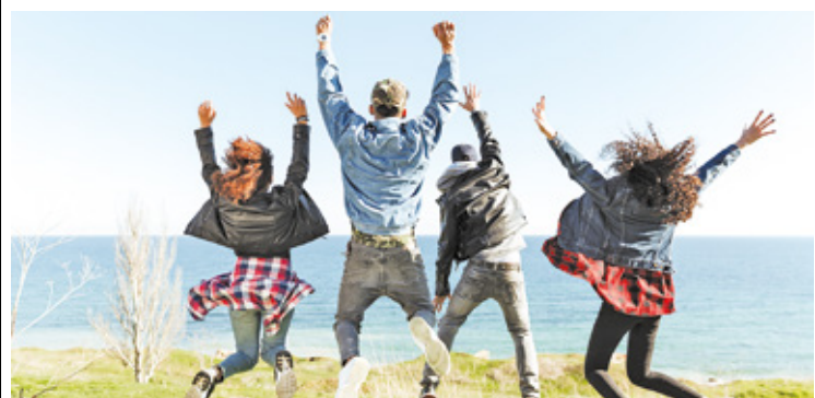
Dla członków rady młodzieżowej udział w tego typu projekcie to nauka zasad demokracji, ale też zachęta do pracy na rzecz lokalnej społeczności w przyszłości