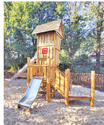
Na placu zabaw jest wiele urządzeń do zabawy m.in. huśtawki i plecione z wikliny szataśy

Oprócz standardowych urządzeń na nowym placu zabaw, takich jak