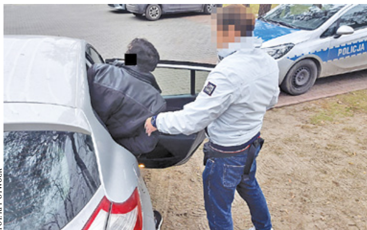
Policja wytropiła oszusta, który wyłudził od amerykańskich spółek około 80 tys. zł

Mail z informacją o rzekomej zmianie numeru rachunku bankowego trafia do biura finansowego spółki, gdzie realizowane są płatności np. za zakupiony towar. – Jeśli pracownik