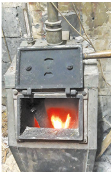
Biuro prasowe przypomina, że na jedno gospodarstwo domowe można kupić do 1,5 tony węgla w ciągu danego roku

Jak wygląda dystrybucja opału w pozostałych gminach powiatu otwo-