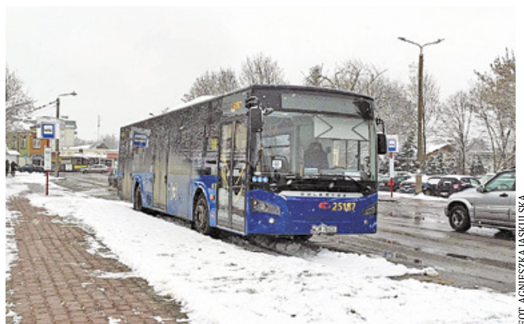
Alternatywą dla często opóźnionych pociągów jest stworzenie lokalnej linii autobusowej kursującej między kilkoma miastami

Po tym, jak prywatny przewoźnik MiniBus przestał kursować do Warszawy, mieszkańcy powiatu otwockiego musieli przesiąść się do pociągu. W Otwocku, Wiązownie czy Karczewie kursują autobusy „L”, ale pasażerowie narzekają, że autobusy za rzadko kursują lub ich rozkład jazdy nie jest dostosowany do rozkładu PKP. Może to być jednak nierealne z uwagi na to, że na kolei często dochodzi do opóźnień pociągów lub różnych awarii (na wysokości PKP Wawer i Dworca Zachodniego trwa modernizacja linii kolejowej).