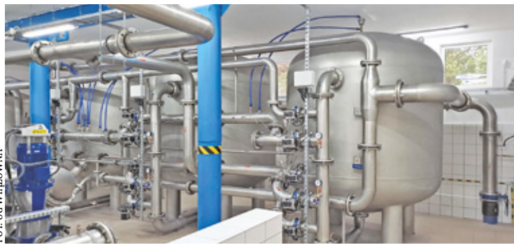
Zmodernizowana Stacja Uzdatniania Wody w Lipowie jest znacznie wydajniejsza, a także w pełni zautomatyzowana i nie wymaga stałego dozoru obsługi. Planowana jest już budowa czwartej studni głębinowej

– W ramach inwestycji został zmodernizowany budynek, zmieniono konstrukcję dachu z płaskiego na wielospadowy, docieplono dach, a także przebudowano instalacje technologiczne, wodociągowe, kanalizacyjne oraz elektryczne, zlikwidowano kocioł olejowy i istniejące grzejniki, zamontowano grzejniki elektryczne – wylicza urząd gminy. I dodaje, że zmieniono technologię uzdatniania wody, wymieniono całą instalację technologiczną, przebudowano i wybudowano doziemne instalacje wodociągowe, a także istniejące obudowy z kręgów betonowych zamieniono na obudowy z laminatu poliestrowo-szklanego z ogrzewaniem awaryjnym. – W ramach modernizacji stacji wykonano także oświetlenie terenu, zamontowano ogniwa fotowoltaiczne, zainstalowano monitoring, alarm i au-