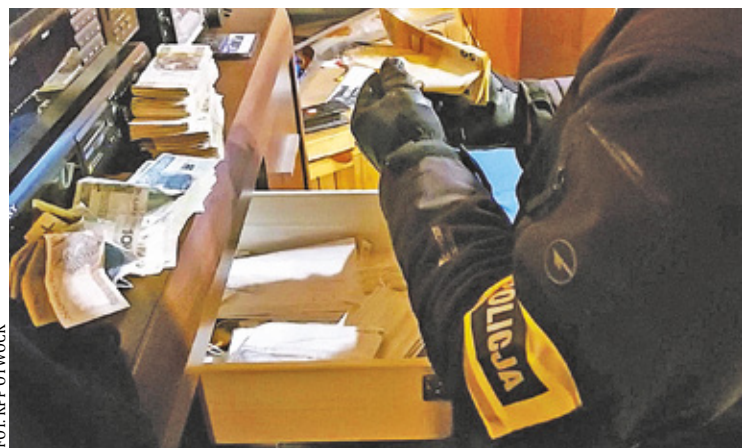
W miejscu zamieszkania funkcjonariusze zabezpieczyli sporą gotówkę w różnych walutach, a także ponad 2 kilogramy narkotyków