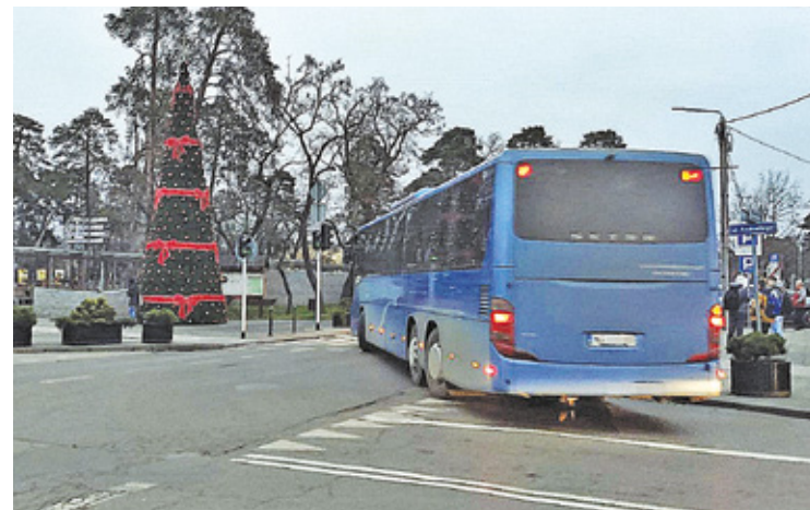
Starostwo powiatowe wraz z Józefowem, Otwockiem i Karczewem w przyszłym roku planują uruchomić nową lokalną linię autobusową, która będzie kursowała aż do Falenicy

– Wstępna kalkulacja kosztów uwzględni 12 kursów, czyli 6 w obydwie strony – wyjaśnia radny powiatowy. I dodaje, że autobus, który ma