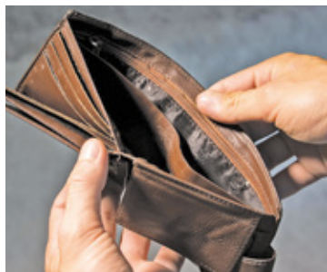
Nasze portfele będą się od stycznia opróżniać jeszcze szybciej

Analitycy prognozują średni wzrost cen za żywność w 2023 roku