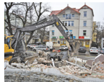
Dawna „Wiklinka” została zrównana z ziemią

Ulica Powstańców Warszawy w centrum miasta całkowicie się zmieni. Będzie to możliwe, dzięki współpracy dwóch samorządów, które na dużą inwestycję wyłożyły łącznie około 11 mln zł.