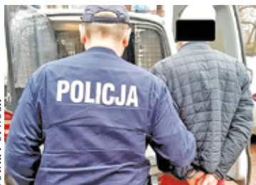
Zatrzymany nieuczciwy kurier

Jeden z kurierów pracujących na terenie powiatu otwockiego wśród dostarczanych paczek wyszukiwał takie, które były wartościowe lub można było je potem łatwo sprzedać. Dlatego część przesyłek nigdy nie dotarła do miesz-