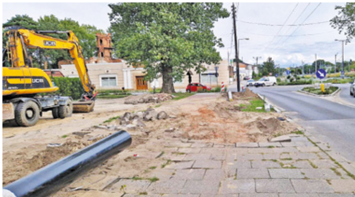
Na drodze w kierunku Świdra powstaje nowa ścieżka rowerowa i chodnik

To jedna z głównych oraz najdłuższych dróg wylotowych z Otwocka, która prowadzi przez most do Józefowa i Warszawy, a także do Śródborowa oraz trasy S17. Chodnik na odcinku prowadzącym od stacji kolejowej w kierunku Świdra, gdzie znajduje się m.in. przedszkole i szkoła podstawowa, od lat wymagał modernizacji. Nareszcie to się zmieni. Od kilku miesięcy trwa remont 2-kilometrowego fragmentu drogi powiatowej. Firma Rokom – na zlecenie starostwa – prowadzi modernizację odcinka od ronda na skrzyżowaniu ul. Warszawskiej i ul. Kościelnej, aż do ul. Majowej w Świdrze, gdzie znajduje się tunel drogowy.