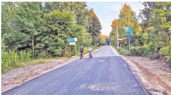
Remont ul. Wspaniałej w Wólce Młódzkiej

– Niedawno gmina Wiązowna już wykonała nawierzchnię asfaltową od strony Kopce na ul. Trakt Lubelski do granicy z Otwockiem – informuje Urząd Miasta Otwock. Teraz natomiast, na zlecenie ratusza, firma Tomiraf prowa-