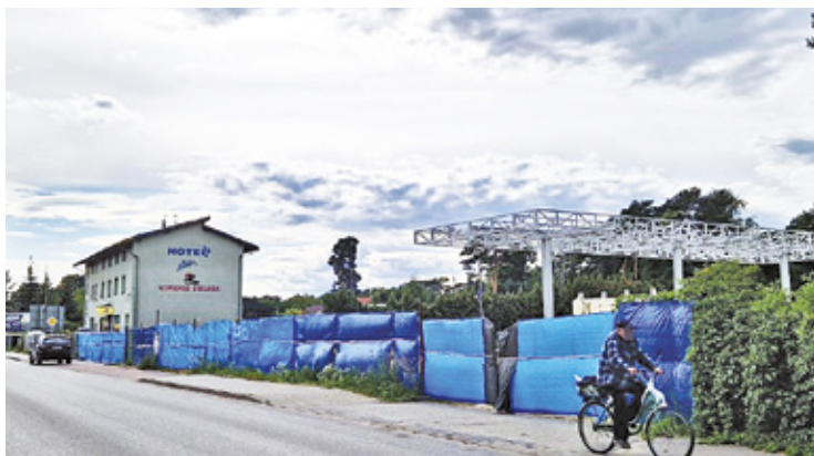
Investycja realizowana jest niedaleko szpitala klinicznego i europejskiej placówki medycznej przy ul. Borowej w Otwocku

B udynek zlokalizowany na rogu ulicy Samorządowej i ulicy Konarskiego w Otwocku, w którym znajduje się hotelik oraz sklep, powstał wiele lat temu. To jedno z nielicznych miejsc w okolicy, gdzie można by-