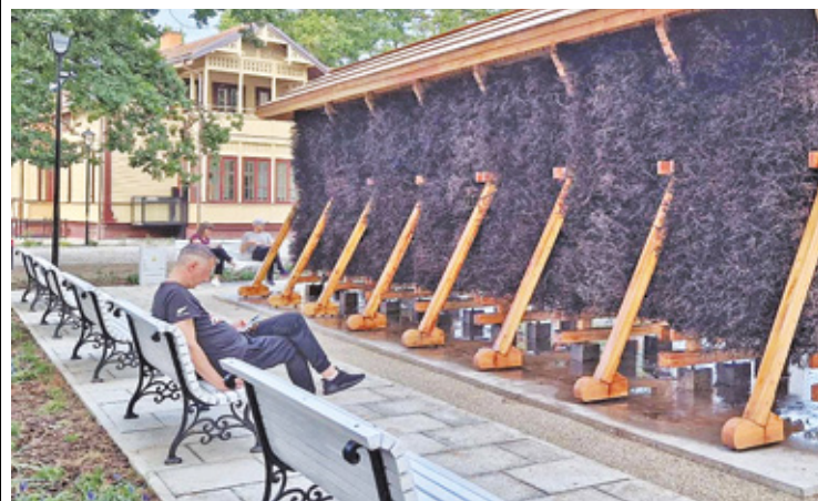
Mieszkańcy coraz częściej korzystają z nowej tęźni w centrum miasta

łodziarnia, kawiarnia, przystanek autobusowy, ścieżki rowerowe, miejski szalet, huśtawki, altany.