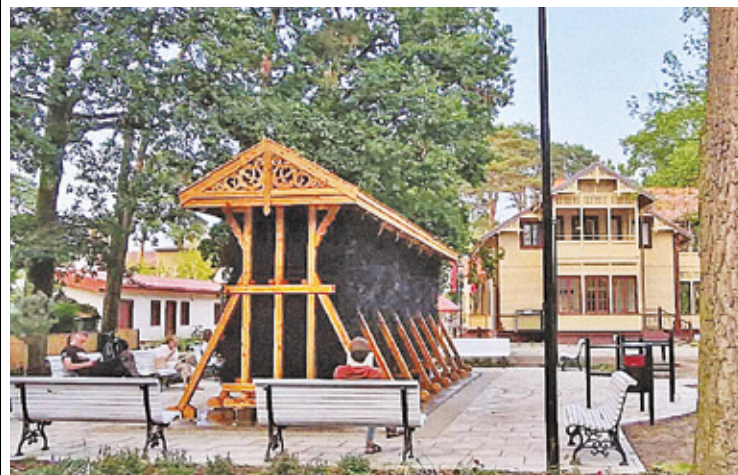
Tęźnia znajduje się obok willi Frankówka

Tęźnie pełnią rolę naturalnych inhalatorów, służących do wytwarzania tzw. „mgły wodnej”. Wodny roztwór soli kamiennej, zwany solanką, jest pompowany na górę tęźni, a następnie rozprzeczony systemem na powierzchnię