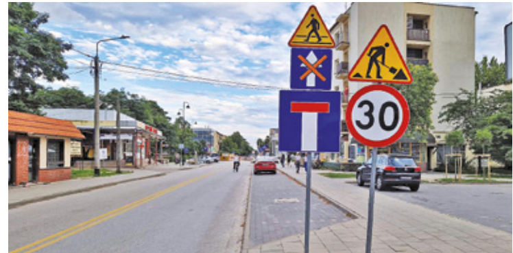
Na zamkniętym odcinku ul. Andriollego od strony ul. Hożej kierowcy zrobili sobie parking

Przypominamy, że obecnie w centrum miasta trwają nie tylko prace związane z budową ronda (inwestycja starostwa powiatowego), ale rów-