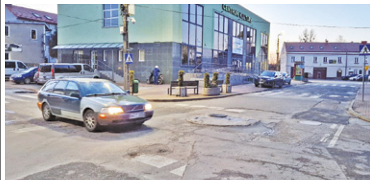
Od lat mieszkańcy czekają na modernizację skrzyżowania ul. Bielińskich i ul. Widok

Karczówek, gmina pozyskała dofinansowanie w wysokości 800 tys. zł – mówi w rozmowie z „Przeглядem” Michał