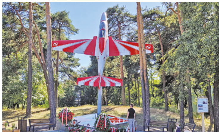
Podczas Nocy Wolności odbyło się odsłonięcie pomnika

lotów. Po oficjalnych przemówieniach proboszcz parafii pw. Św. Wincentego a Paulo poświęcił pomnik. Potem złożono kwiaty.