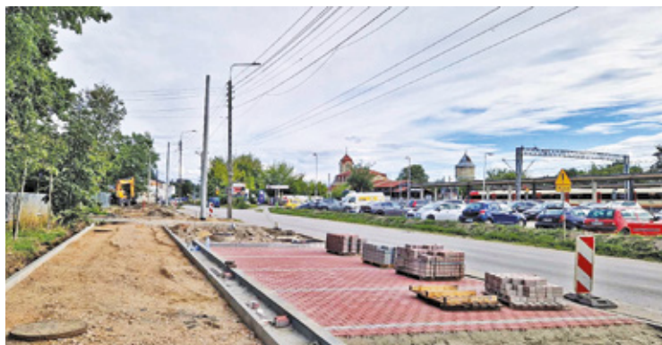
Przy stacji kolejowej będzie oznakowane przejście dla pieszych