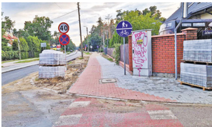
Na ul. Wyszyńskiego trwa budowa m.in. ciągu pieszo-rowerowego z kostki