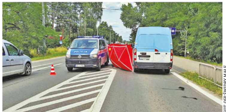
Do jednej z dwóch tragedii doszło na „Nadwiślanie” w Józefowie

Kierowca samochodu dostawczego nagle zatrzymał pojazd. Świadkowie zdarzenia wezwali na pomoc służby ratunkowe. Na miejscu interweniowała