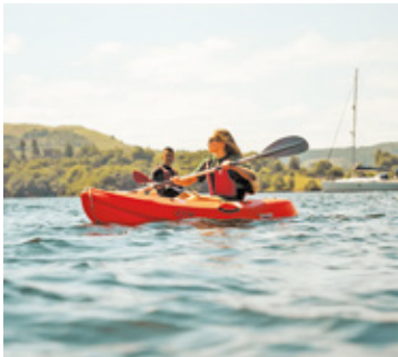
W ramach Roku Kopernika odbędzie się ekstremalny spływ kajakowy Wisłą z Otwocka do Torunia

Mobilna wystawa, warsztaty dla najmłodszych oraz spływ kajakowy z Otwocka do Torunia – wszystko to organizowane jest w ramach przypadającej w 2023 roku 550. rocznicy urodzin Mikołaja Kopernika.