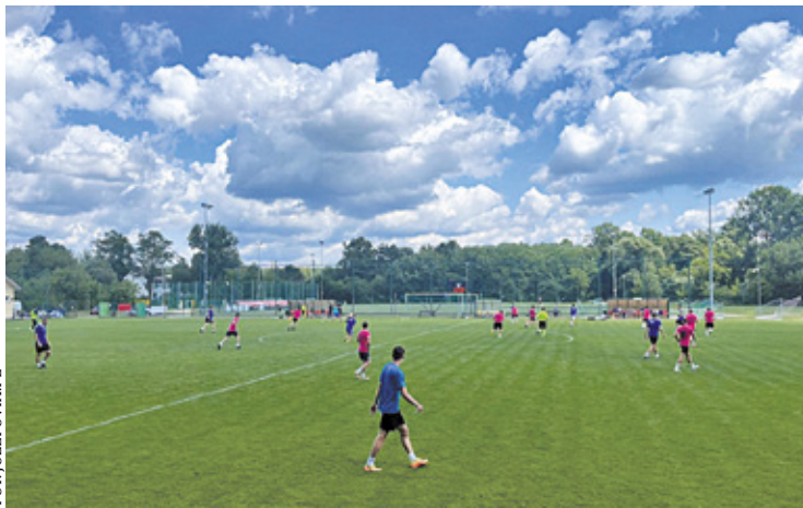
Józefovia Józefów pokonała w sparingu Sokola Serock