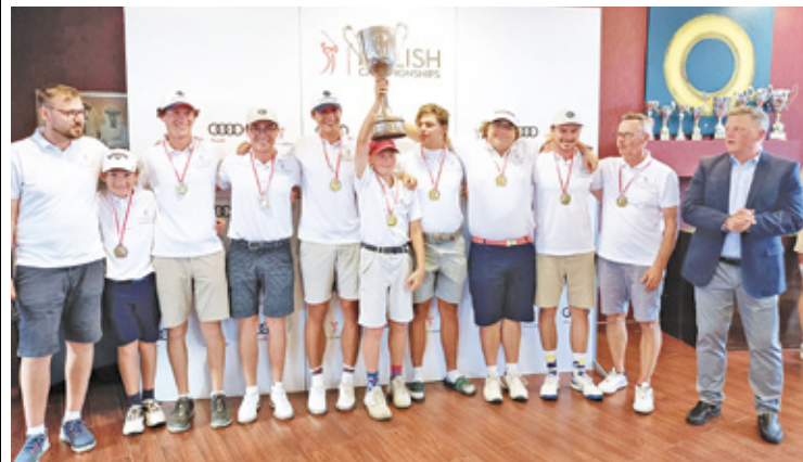
Złota drużyna Sobieni Królewskich