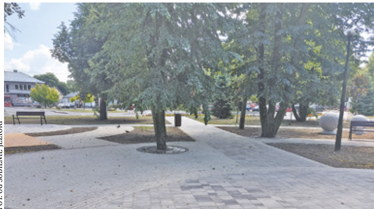
Na skwerze ułożono nową nawierzchnię z kostki betonowej