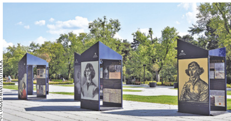
Wystawa w otwockim parku miejskim

Natomiast w czwartek, 10 sierpnia o godz. 9 zaplanowano spływ kajakowy. Trasa prowadzi z Otwocka do