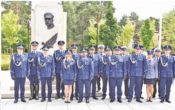
Uroczysty apel odbył się w parku miejskim w Otwocku

W trakcie uroczystości wygłoszono przemówienia, podczas których doceniano ciężką pracę, którą policjanci wykonują każdego dnia. Część z nich otrzymała awanse na wyższe stopnie służbowe, co wzbudziło ogromną dumę. – Łącznie w otwockiej komendzie akty mianowania odebrało 49 policjantów. Następnie zostali wyróżnieni policjanci, którzy zajęli pierwsze miejsce w konkursie „Policjant Służby