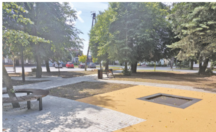
Modernizacja placu kosztowała blisko pół miliona złotych, a w planach są kolejne prace

– Zadanie realizowano z udziałem środków Europejskiego Funduszu Rolnego na rzecz Rozwoju Obszarów Wie-