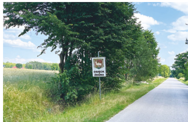
Gmina Osieck alarmuje, w okolicy pojawiły się wilki

Wilki są ważnym elementem ekosystemu leśnego. Są naturalnym drapieżnikiem, który reguluje liczebność