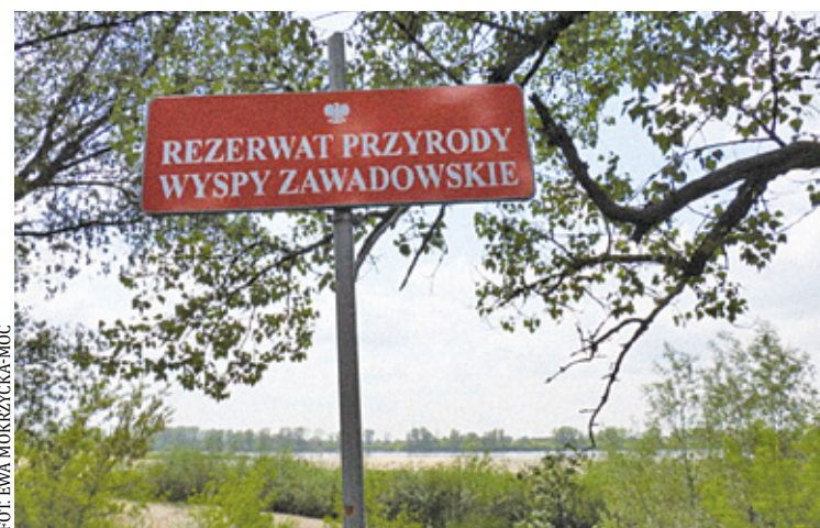
Wolontariusze OTOP roztawiają dodatkowe tablice informacyjne

bezpośrednio na piasku – na plażach, wyspach i ławicach. – Obecność ludzi w tym czasie w sąsiedztwie miejsc lęgowych zazwyczaj pociąga za sobą dramatyczne skutki – przepłaszani ptasi rodzice opuszczają gniazda i nie są w stanie chronić jaj ani piskląt przed zagrożeniami – podkreślają pracownicy Regionalnej Dyrekcji Ochrony Środowiska w Warszawie, którzy wraz z policjantami z komisariatu w Józefowie oraz wolontariuszami Ogólnopolskiego Towarzystwa Ochrony Ptaków kontrolują rezerwat. Informują również, co jest najgroźniejsze dla ptaków. – Rzy-