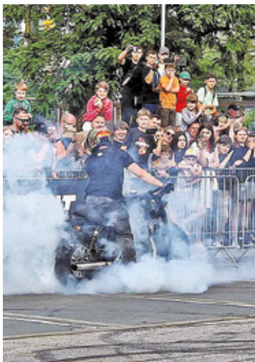
Motocyklowe show w centrum Otwocka było prawdziwym spektaklem