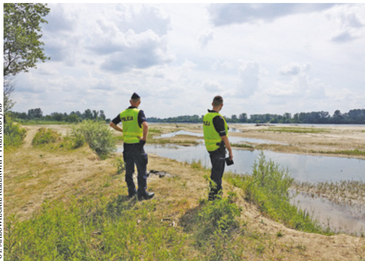
Jak informują urzędnicy, na Wyspach Zawadowskich i Wyspach Świdzkich należy spodziewać się kolejnych kontroli

Wyspy Zawadowskie i Wyspy Świdzkie to niezwykle cenne rezerваты, które są obszarem chronionym, o czym informują dziesiątki tablic informacyjnych o zakazie wstępu. W dodatku obecnie trwa okres lęgowy ptaków siewkowych, które zakładają gniazda