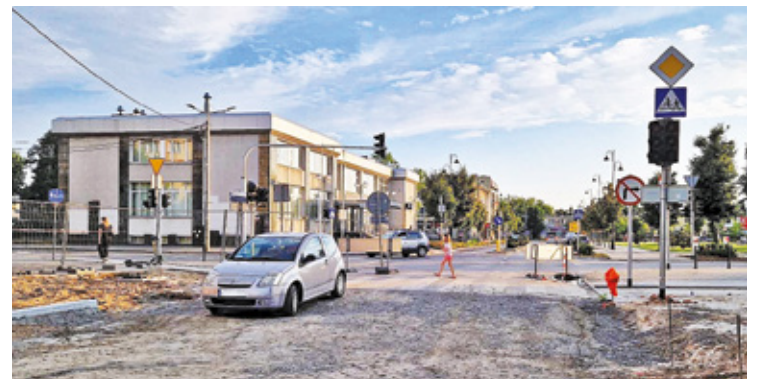
Za kilka tygodni rozpocznie się modernizacja kolejnego ruchliwego skrzyżowania w Otwocku

Budowę trzech innych rond w centrum realizuje także starostwo powiatowe przy wsparciu finansowym otwockiego samorządu. Do jesieni