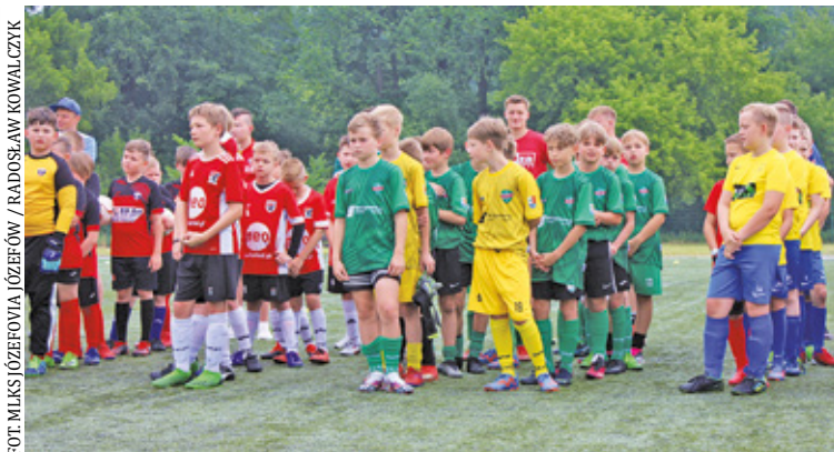
Piłkarskie święto w Józefowie

W grupie A najlepsi byli zawodnicy znad Świdra. W grupie B triumfo-