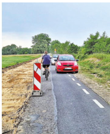
Obecnie prowadzony jest remont fragmentu drogi w kierunku Wisły

Przeprawa promowa, będąca jedną z najstarszych form transportu wodnego w Polsce, cieszy się dużą popularnością w różnych regionach kraju. Jednym z takich miejsc jest przeprawa na Wiśle między Karczewem a Gassami, dzięki której wielu mieszkańców powiatu otwockiego i piaseczyńskiego może ominąć korki, m.in. na drodze krajowej nr 50 i szybciej dotrzeć do domu czy pracy.