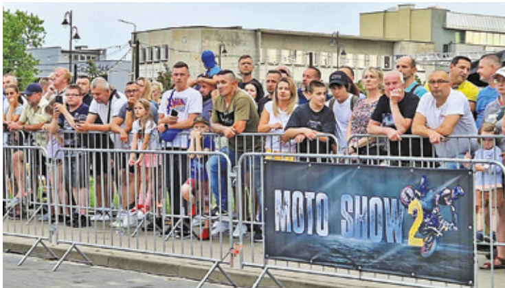
Uliczne popisy zaprezentowała ekipa Stunt Wars Poland

„Dopa” Bielickiego, rekordzisty Guinnessa w długości palenia gumy na motocyklu. Ten niezwykle utalentowany motocyklista zaprezentował swoje