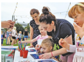
Organizatorzy przygotowali dla najmłodszych uczestników gry i zabawy

W sobotę, 24 czerwca po południu odbył się ekscytujący pokaz ulicznej akrobatyki motocyklowej, który zapewnił mocne wrażenia wszystkim miłośnikom motoryzacji. Pokaz odbył się przy ul. Andriollego w Otwocku, obok letniej sceny i palm. W show zaprezentowała się ekipa