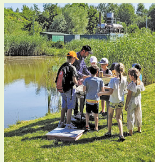
Dzieci podczas warsztatów Akademii Ekologicznej Amest Otwock

Istotne w ograniczaniu negatywnego wpływu na przyrodę są dobre nawyki. Zamiast samochodu warto przemyśleć wybór środka transportu o niższej emisji dwutlenku węgla