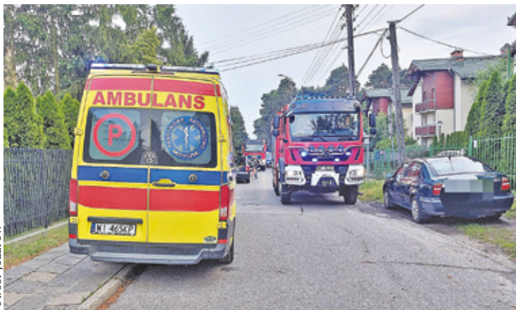
Służby interweniowały w jednym z budynków wielorodzinnych

Służby mundurowe otrzymały zgłoszenie dotyczące kobiety, która prawdopodobnie zaśląbła i upadła na balkonie w budynku wielorodzinnym przy ulicy Zawiszy Czarnego w Józefo-