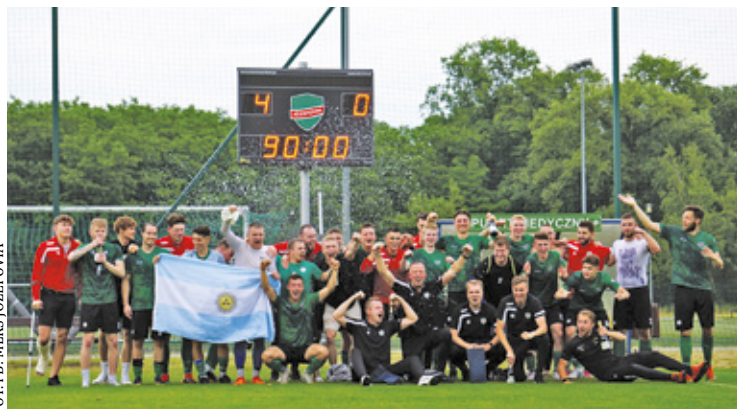
Piłkarskie święto w Józefowie! Będą derby powiatu

Pogoda zdecydowanie nie dopisała, a obfite opady deszczu zaalały boisko