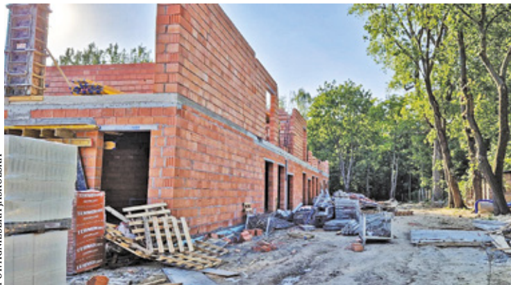
Trwa rozbudowa szkoły

Po dwóch latach zmagania ze skomplikowanymi procedurami gminie udało się pozyskać działkę od Lasów Państwowych, która była niezbędna do rozbudowy placówki w Starej Wsi. Dzięki rządowemu dofinansowaniu gmina Celestynów przeznaczyła około 19 mln zł na powiększenie i modernizację szkoły. W kwietniu spółka Arcus Technologie z Celestynowa na zlecenie gminy rozpoczęła długo wyczekiwana rozbudowę podstawówki. – W ramach inwestycji zostanie dobudowane skrzydło budynku, gdzie na parterze i piętrze znajdą się nowe pomieszczenia, takie jak świetlica z zapleczem, stołówka, biblioteka z czytelnią, sale zajęciowe, gabinety specjalistów, węzły sanitarne oraz pomieszczenia