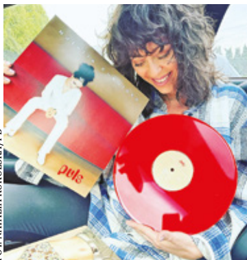
Podczas finału wystąpi Natalia Kukulska z Atom String Quartet

Wielki finał Festiwalu Świdermajer odbędzie się w dawnym pensjonacie Gurewicza. To będzie dzień pełen wrażeń dla małych i dużych mieszkańców. Wieczorem na scenie wystąpi gwiazda wieczoru – Natalia Kukulska z muzykami.