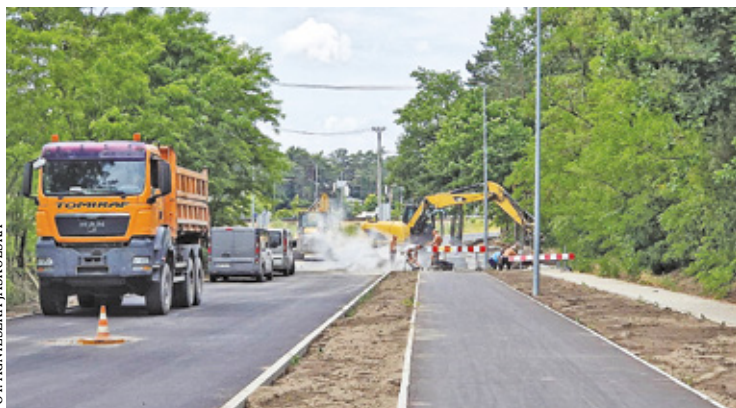
Modernizacja ul. Warszawskiej na wysokości Śródborowa

U lica Warszawska w Otwocku jest jedną z najdłuższych dróg, która prowadzi przez most do Józefowa i Warszawy lub do Śródborowa i trasy S17. Na wiosnę rozpoczęła się modernizacja ul. Warszawskiej na dwóch krańcach miasta. Jedno z zadań (od kwietnia) jest realizowane przez starostwo powiatowe. W ramach tego projektu, na odcinku o długości 2 kilometrów, od ul. Kościelnej do ul. Majowej w Świdrze, powstaną m.in. ścieżka pieszo-rowerowa, system odwodnienia, zostaną doświetlone przejścia dla pieszych, a także powstanie nowe oznakowane przejście dla pieszych przy PKP Otwock (na wysokości stacji LPG). Ponadto przystanek autobusowy zostanie przesunięty w kierunku ronda. Wykonawca przebuduje również zatokę postojową na rogu ul. Warszaw-