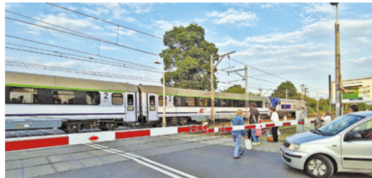
Piesi często przechodzą za opuszczone rogatki

Na początku czerwca informowaliśmy o wypadku na torowisku pomiędzy rzeką Świder a PKP Świder na wysokości ul. Sowińskiego i ul. A. Mickiewicza w Otwocku. W tym miejscu wiele osób przechodzi przez tory na skróty. W piątek około godz. 22 mężczyzna,