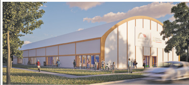
Siedem szkolnych boisk zamieni się w nowoczesne hale sportowe

Kolejną szkołą, gdzie zostanie zbudowane zadanie nad istniejącym boiskiem, jest SP nr 5. Inwestycja warta 2,7 mln zł obejmuje: budowę zadania