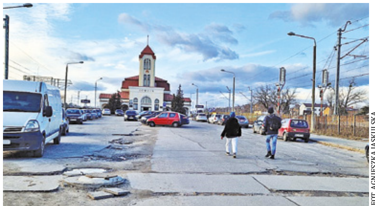
Pasażerowie od lat narzekają na bałagan przed dworcem w Otwocku