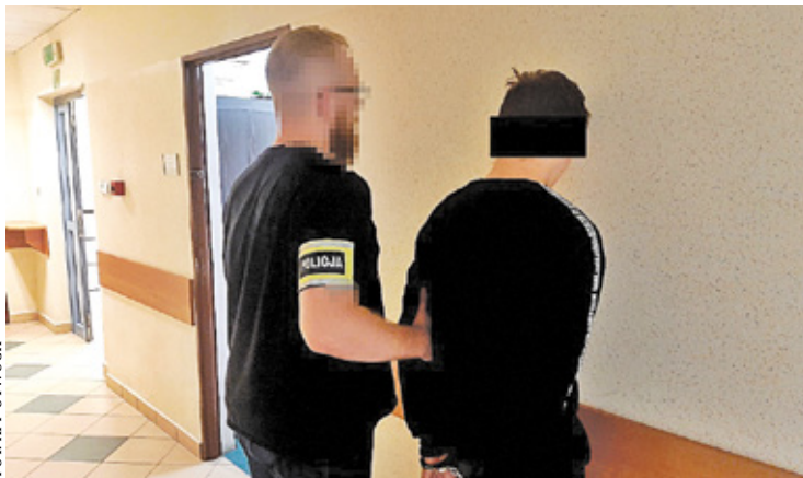
Policja zatrzymała sprawców oszustw

Funkcjonariusze z Otwocka zidentyfikowali i zatrzymali dwóch sprawców oszustw. Pierwszym okazał się 19-letni mężczyzna, który trafił do aresztu. Kolejny zatrzymano na 22-la-