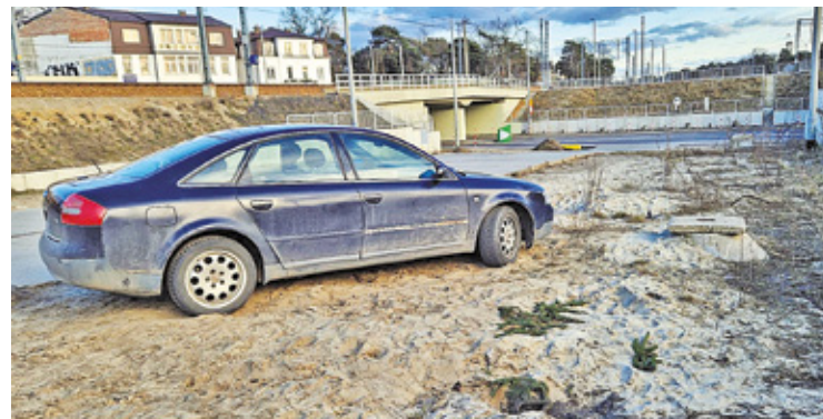
W ramach porządków przed budynkiem zostanie m.in. poszerzony dojazd

W związku z tym, że rewitalizacja zabytkowego dworca i placu przed budynkiem kolejowym może przedłużyć się o następne lata, postanowiono uporządkować rozgrzebany teren przed PKP Otwock. – Trzeba patrzeć pod nogi, bo można się przewrócić albo skrócić kostkę w wystających płytach i dziurach. Tu jest wielki bałagan, który straszy mieszkańców i przyjezdnych już od wielu miesięcy. Wstyd, żeby tak wyglądało jedno z najważniejszych miejsc w mieście! Czy jest tu jakiś gospodarz miasta? – skarży się w rozmowie z