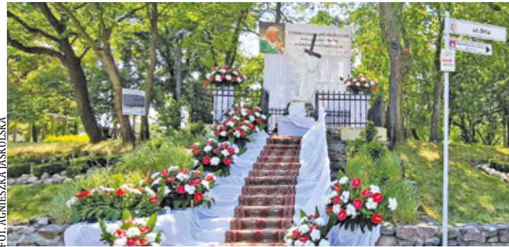
Ołtarz przy ul. Orlej w Otwocku

Karczew, od wielu lat słynie z tworzenia niezwykle pięknych ołtarzy na Boże Ciało. Co roku mieszkańcy skrupulatnie przygotowują się do tej