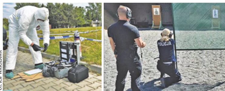
Policjanci musieli wykazać się nie tylko wiedzą teoretyczną, ale także praktyczną

Eliminacje na etapie wojewódzkim wygrała drużyna policjantów z otwockiej komendy policji, która zajęła pierwsze miejsce w ogólnopolskim konkursie. – Czteroosobowa drużyna policjantów z KPP Otwock wykazała się największą wiedzą dochodzenio-