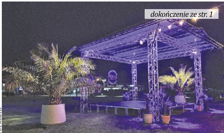
Letnia scena i palmy w centrum miasta