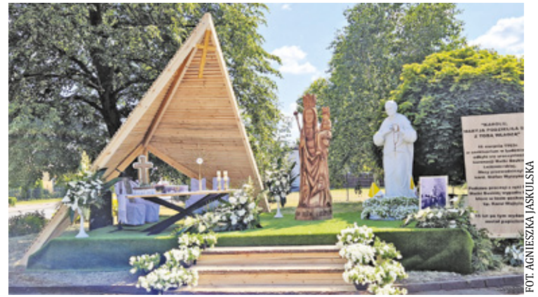
Ołtarze przy ul. Mickiewicza w Karczewie

uroczystości. Ołtarze te charakteryzują się różnorodnością pod względem wyglądu i tematyki, a także są pięknie ozdobione m.in. kłosami zboża (symbolizującymi chleb eucharystyczny), kwiatami polnymi (chabry, róże, lilie, bławatki czy margaretki), zielonymi gałęziami (bukspan, tuja czy cyprys), dodają ołtarzom symboliki nadziei i trwałości życia wiecznego. Ołtarze ozdabia się także tkaninami, welonami, białymi koronkami czy haftami. Na ołtarzach często umieszcza się również świece, wizerunki świętych czy sceny biblijne. Mieszkańcy wkładają dużo serca i pracy w to, aby ołtarz na Boże