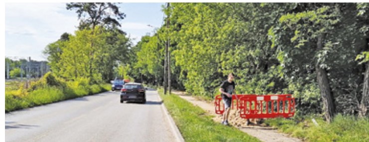
Trwa przebudowa ul. Warszawskiej i ul. Jana Pawła II w Otwocku